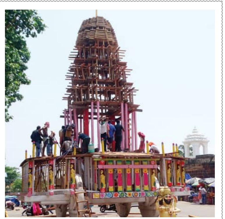
ଦିନକ ପରେ ଅଶୋକାଷ୍ଟମୀ: ଯାତ୍ରା ପାଇଁ ପ୍ରସ୍ତୁତ ରୁକୁଣା ରଥ