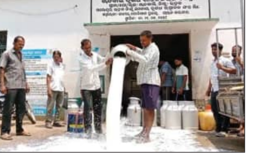
କ୍ଷୀର ଉତ୍ପାଦକ ସମବାୟ ସମିତି

କଟକ, ୩୪(ସମ୍ପାଦକ): କ୍ଷୀର ଉଚ୍ଚ ମୂଲ୍ୟ ମ ପାଇବାରୁ ରାଷ୍ଟ୍ରରେ ହଜାର ହଜାର କ୍ଷୀର ଚାଷୀ ଦୈନିକ ପ୍ରତିବାଦ କରିଛନ୍ତି ଗୋ-ଚାଷୀ। ଏଭଳି ଅଭାବନାୟ ଘଟଣା ଘଟିଛି, କଟକ ଜିଲ୍ଲା ଚାନ୍ଦବାଲି ଏନ୍‌ସିସି ସରକାରୀ ଦୁଗୁ ଉତ୍ପାଦକ ସମବାୟ ସମିତି ନିକଟରେ। ଚାନ୍ଦବାଲିରେ ଥିବା ଭାରତ ସରକାରଙ୍କ ଅଧୀନ ବାଲେଶ୍ୱର-କଟକ ଜିଲ୍ଲା ସମବାୟ ସମିତି ସ୍ଥାନୀୟ ଅଞ୍ଚଳରୁ ଦୁଗୁ ଚାଷୀଙ୍କଠାରୁ ଦୁଗୁ ସଂଗ୍ରହ କରିଥାଏ। ନିର୍ଦ୍ଦିଷ୍ଟ କିଛି ଚାଷୀଙ୍କ ଦୁଗୁକୁ କେନ୍ଦ୍ରର କର୍ମଚାରୀମାନେ ବାରମ୍ବାର ନିମ୍ନମାନର ଦର୍ଶାଉଛନ୍ତି। ଫଳରେ ଚାଷୀମାନେ ବାରମ୍ବାର କ୍ଷତିରେ ପଡ଼ୁଛନ୍ତି। ଆଜି ଚାଷୀମାନେ ଏକାଠି ହୋଇ ପ୍ରାୟ ୧୫କାର ଲିଟର କ୍ଷୀରକୁ ରାଷ୍ଟ୍ରରେ ଭାଲି ପ୍ରତିବାଦ କରିଛନ୍ତି। ଚାଷୀମାନଙ୍କ ଦୁଗୁର ମୂଲ୍ୟ ୩୦-୩୨ ଟଙ୍କା ଲିଟର ପିଛା ଦିଆଯାଉଛି। କିନ୍ତୁ ଏହି କ୍ଷୀର ବଜାରରେ ୧୫-୨୦ ଟଙ୍କା ବିକ୍ରି କରୁଛି। ଏଥିପାଇଁ ଚାଷୀମାନେ ବାରମ୍ବାର ସମିତି ନିକଟରେ ମୂଲ୍ୟ ବଢ଼ାଇବାକୁ ଦାବି କରିଥିଲେ ମଧ୍ୟ ବାଲେଶ୍ୱର ଉତ୍ପାଦକ ସମବାୟ ଦୁଗୁ ସମିତି ଦାବି ଗ୍ରହଣ କରୁନାହିଁ। ଫଳରେ ନିରାଶ ହୋଇ ଚାଷୀମାନେ ଆଜି ରାଷ୍ଟ୍ରରେ ସେମାନଙ୍କ ଦୁଗୁକୁ ଭାଲିଛନ୍ତି।