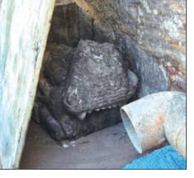
ଶ୍ରୀମନ୍ଦିରର ଐତିହ୍ୟ କାର୍ତ୍ତବୀରି