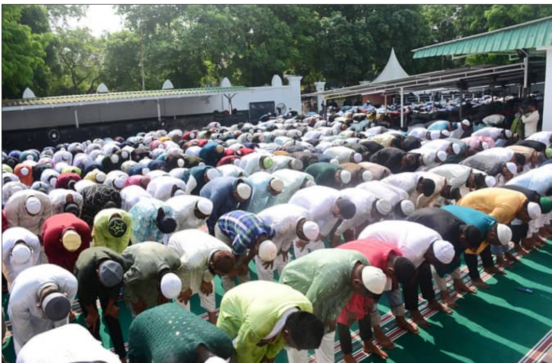
ପବିତ୍ର ଲବ୍ ଉପଲକ୍ଷେ ଭୁବନେଶ୍ୱର ଯୁନିଟ୍-୪ ସ୍ଥିତ ମସଜିଦ୍ରେ ସମୂହ ନମାଜ ପାଠ