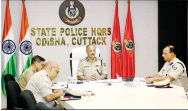
ଡିଜିଟାଲ୍ ସୁରକ୍ଷା ସମାକ୍ଷାରେ ଉପସ୍ଥିତ ଉଚ୍ଚ ଅଧିକାରୀଙ୍କ ସହିତ ପୁଲିସ୍ ଅଧିକାରୀଙ୍କ ମଧ୍ୟରେ ଆଲୋଚନା ହେଉଛି।

କଟକ, ୨୧ମାର୍ଚ୍ଚ (ସମ୍ପାଦକ): ଆସନ୍ତା ୩୧ ତାରିଖରେ ଇଦ-ଉଲ-ଫିତର, ଏପ୍ରିଲ ୬ ତାରିଖରେ ଶ୍ରୀରାମ ନବମୀ ଏବଂ ଏପ୍ରିଲ ୧୪ ତାରିଖରେ ହନୁମାନ ଜୟନ୍ତୀ ଓ ମହାବିଷୁବ ଫଳାଣ୍ଟି ପାଳନ ହେବ। ଏହି ସମସ୍ତ ପର୍ବରେ ଶାନ୍ତିଶୃଙ୍ଖଳା ସୁନିଶ୍ଚିତ ପାଇଁ ଆଜି ଡିଜିଟାଲ୍ ସୁରକ୍ଷା ସମାକ୍ଷା ଯୋଜନା କରାଯାଇଛି।