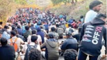
ଛତ୍ରାଳନେଲେ ଜବତ ଟାଙ୍ଗେଇ ଡିଏସ୍ପି, ଥାନା ଅଧିକାରୀଙ୍କ ସମେତ ୨୬ କର୍ମଚାରୀ ଆହତ

ପାରଳାଖେମୁଣ୍ଡି, ୨୧ମା (ସମ୍ବେଦ): ରକ୍ତମୁଖା ଟାଙ୍ଗେଇ ମାଝିଆ । ଧରପଗଡ଼ ବେଳେ ବାଟରେ ଗଢ ପକାଇ ପୁଲିସ୍ ଟିମ୍‌ର ବାଟ ଓଗାଳିବା ସହ ଘଣ୍ଟାଘଣ୍ଟା ଧରି ଅଟକ ରଖିଲେ । ସେତିକିରେ ରାଗ ଶାନ୍ତ ହେଲାନି ଯେ ପୁଲିସ୍ ଉପରକୁ ବହୁବହୁ ପଥରମାଡ଼ କରିବା ସହ ଠେଙ୍ଗାରେ ପିଟିଲେ । ଏପରିକି, ପାଞ୍ଚ ପାଞ୍ଚଟି ପୁଲିସ୍ ଗାଡ଼ିକୁ ବାଡ଼େଇ ତୂରମାଡ଼ କରିଦେଲେ । ଏଭଳି ଏକ ଘଟଣା ଘଟିଛି, ଗଜପତି ଜିଲ୍ଲା ମୋହନା ଥାନା ଅନ୍ତର୍ଗତ ଯୁବ ପଞ୍ଚାୟତ ପଡ଼ିଆରା ଗ୍ରାମରେ । ଜଣେ କି ଦୁଇଜଣ ନୁହେଁ, ପୂରା ଗାଁରା ଯାକ ଲୋକ ପୁଲିସ୍ ଟିମ୍ ଉପରକୁ ମରଣାନ୍ତକ ଆକ୍ରମଣ କରିଛନ୍ତି । ଏଥିରେ ୨୬ରୁ ଉର୍ଦ୍ଧ୍ୱ ପୁଲିସ୍ ଲହୁଲହୁଆ ହୋଇଛନ୍ତି । ୮୫-୬