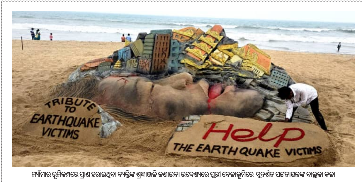
ମାଁମାରି ଭୂମିକମ୍ପରେ ପ୍ରାଣ ହରାଇଥିବା ବ୍ୟକ୍ତିଙ୍କ ଶ୍ରଦ୍ଧାଞ୍ଜଳି ଜଣାଇବା ଉଦ୍ଦେଶ୍ୟରେ ପୁରୀ ବେଳାଭୂମିରେ ସୁଦର୍ଶନ ପଟ୍ଟନାୟକଙ୍କ ବାଲୁକା କଳା

କୋରାପୁଟ ଜିଲ୍ଲାରେ ମହାପ୍ରଭୁଙ୍କ ଜମି ଜବରଦଖଲ ମୁକ୍ତ କରାଯାଇଛି। ଯେଠାରେ ୨୭ ହଜାର ୪୧୦ ଏକର ଜମାଧାରୀ ଜମି ରହିଛି।