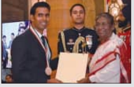
ଭାବେ ସେ ୨୦୦୪ରେ 'ଅର୍ଜୁନ' ପୁରସ୍କାର ଜିତିଥିଲେ।

୨୦୨୨ରେ ପାଇଥିଲେ 'ଖେଳରତ୍ନ' ୨୦୨୨ ମସିହାରେ ଶରତଙ୍କୁ ଦେଶର ସର୍ବୋଚ୍ଚ କ୍ରୀଡ଼ା ସମ୍ମାନ 'ଖେଳର ଧ୍ୟାନ' ଖେଳରତ୍ନ ପୁରସ୍କାର ପ୍ରଦାନ କରାଯାଇଥିଲା। ସେହିଭଳି ୨୦୧୯ରେ ସେ ଭାରତର ୪ର୍ଥ ସର୍ବୋଚ୍ଚ ନାଗରିକ ସମ୍ମାନ 'ପଦ୍ମଶ୍ରୀ'ରେ ଆଭୂଷିତ ହୋଇଥିଲେ। କ୍ୟାରିୟରର ପ୍ରଥମ ବଡ଼ ସମ୍ମାନ