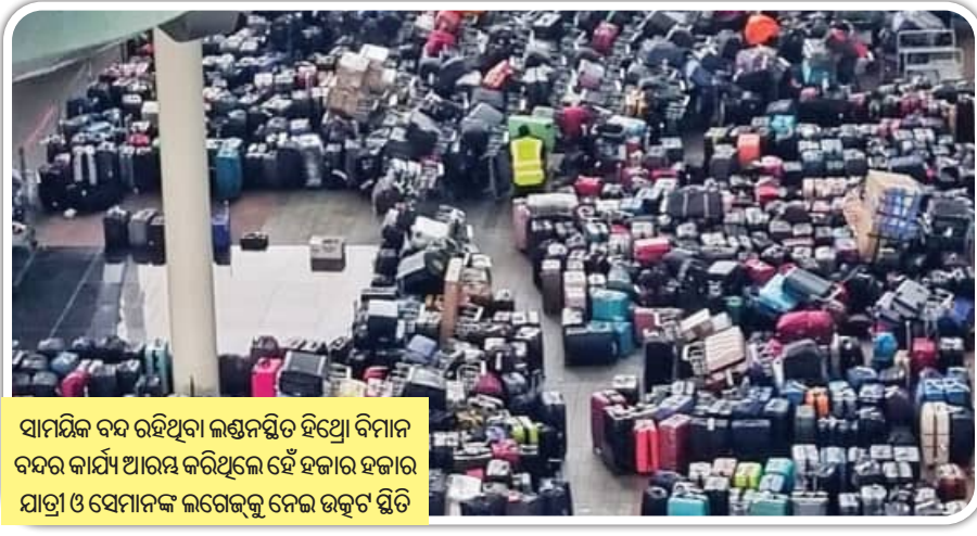
ସାମାଜିକ ବନ୍ଦ ରହିଥିବା ଲଣ୍ଡନସ୍ଥିତ ହିସ୍ତୋ ବିମାନ ବନ୍ଦର କାର୍ଯ୍ୟ ଆରମ୍ଭ କରିଥିଲେ ହେଁ ହଜାର ହଜାର ଯାତ୍ରୀ ଓ ସେମାନଙ୍କ ଲଗେଜ୍‌ସ୍ ନେଇ ଉକ୍ତ ସ୍ଥିତି