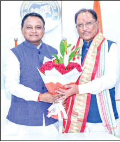
ସେ ମତ ଦେଇଛନ୍ତି । ଉଭୟ ରାଜ୍ୟର ମୁଖ୍ୟମନ୍ତ୍ରୀ ଏହି ବିଷୟ ଉପରେ ଗୁରୁତ୍ୱ ଦେଇ ଏହାର ଶାନ୍ତିପୂର୍ଣ୍ଣ ସମାଧାନ ପାଇଁ ରାଷ୍ଟ୍ର ବାହାର କରିବାକୁ ଏକମତ ହୋଇଛନ୍ତି ।

ଭୁବନେଶ୍ୱର, ୨୨ମାର୍ଚ୍ଚ (ସମ୍ବିଧ): ଓଡ଼ିଶା ଗସ୍ତରେ ଆସିଥିବା ଛତିଶଗଡ଼ର ମୁଖ୍ୟମନ୍ତ୍ରୀ ବିଷ୍ଣୁଦେବ ସାଏ ଶନିବାର ଲୋକସଭା ଭବନରେ ମୁଖ୍ୟମନ୍ତ୍ରୀ ମୋହନ ଚରଣ ମାଝୀଙ୍କୁ ଭେଟିଛନ୍ତି । ଏହି ସମୟରେ ଉଭୟଙ୍କ ମଧ୍ୟରେ ବିଭିନ୍ନ ବିଷୟ ସହିତ ମହାନଦୀ ଜଳ ବିବାଦ ସମ୍ପର୍କରେ ଆଲୋଚନା ହୋଇଛି ବୋଲି ମୁଖ୍ୟମନ୍ତ୍ରୀଙ୍କ କାର୍ଯ୍ୟାଳୟ ପକ୍ଷରୁ ସୂଚନା ଦିଆଯାଇଛି । ଆଲୋଚନା ସମୟରେ ମହାନଦୀ ବିବାଦର ଆଞ୍ଚଳିକ ସମାଧାନ ସମ୍ପର୍କରେ ମୁଖ୍ୟମନ୍ତ୍ରୀ ମୋହନ ମାଝୀ ଗୁରୁତ୍ୱାହୀନ କରିଛନ୍ତି । ସେ କହିଛନ୍ତି ଯେ ଦୁଇ ରାଜ୍ୟ ପରସ୍ପର ପଡ଼ୋଶୀ; ଉଭୟ ରାଜ୍ୟ ମଧ୍ୟରେ ରାଷ୍ଟ୍ର ଓ ଭାବନା ସମ୍ପର୍କ ରହିଛି । ତେଣୁ ଉଭୟ ରାଜ୍ୟର ଜନସାଧାରଣଙ୍କ ହିତ ଦୃଷ୍ଟିରୁ ଏହାର ଉତ୍ତର ସମାଧାନ ହେବା ଆବଶ୍ୟକ । ଛତିଶଗଡ଼ ମୁଖ୍ୟମନ୍ତ୍ରୀ ଶ୍ରୀ ସାଏ ମଧ୍ୟ ଏ ସମ୍ପର୍କରେ ସକଳାତ୍ମକ ମତାମତ ପ୍ରକାଶ କରି ସମାଧାନ ଆପଣେ ସମାଧାନ ସମୟରେ ଅଛନ୍ତି ବୋଲି କହିଛନ୍ତି । ଏହା ସହ ଆଲୋଚନା କରିଆରେ ଏହି ସମସ୍ୟାର ଉପଯୁକ୍ତ ସମାଧାନ ହୋଇପାରିବ ବୋଲି