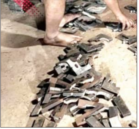
୧୧୦ ବନ୍ଧୁକ ଓ ୧୨୧ ଗୁଳି, ୨୦୧୮ରେ ୩୫୭ ବନ୍ଧୁକ ଓ ୫୩୯ ଗୁଳି ଜବତ ହୋଇଛି । ଏହି ଖବରରେ ଓଡ଼ିଶାରେ ମୋଟ ୯୨୮ଟି ଚୋରା ବନ୍ଧୁକ ଓ ୧୪୧୫୪ଟି ଗୁଳି ଜବତ କରାଯାଇଛି । ମାତ୍ର ଗତ ଦୁଇବର୍ଷରେ ୧୫ହଜାରରୁ ଅଧିକ ବନ୍ଧୁକ ଜବତ ହୋଇଛି । ସେହିପରି ବିହାରରେ ବ୍ୟବସାୟମାନେ ରାଜପଲ୍ଲୀ(ମାସେଟ୍), ରିଭଲଭର, ପିସ୍ତଲ, ମାଉଜର ଏବଂ କାର୍ବାଇନ୍ ଭଳି ଅତ୍ୟାଧୁନିକ ଅସ୍ତ୍ରଶସ୍ତ୍ର ତିଆରି କରୁଛନ୍ତି । ଏହି କାରବାରରେ ସବୁବର୍ଗର ବ୍ୟକ୍ତିବିଶେଷମାନେ ସାମିଲ ହୋଇଛନ୍ତି । ସେମାନେ ପ୍ରସ୍ତୁତ କରୁଥିବା ବନ୍ଧୁକରେ ମେଡ଼ିକାଲ୍ କଲେଜ, ମେଡ଼ିକାଲ୍ ଚାକର, ମେଡ଼