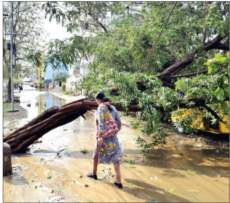
ବୁଢ଼ପୁର ସହରରେ କାଳବୈଶାଖୀ ଜନିତ ବର୍ଷା-ପବନ ଯୋଗୁଁ ଜନଜୀବନ ଅସ୍ତବ୍ୟସ୍ତ ହୋଇପଡ଼ିଛି । ବିଭିନ୍ନ ସ୍ଥାନରେ ଗଛ ଉପୁଡ଼ି ପଡ଼ିଥିବା ବେଳେ ସହରରେ ଆଣ୍ଟୁଏ ଉଚ୍ଚର ବର୍ଷାଜଳ ଲହଡ଼ି ମାରୁଛି ।