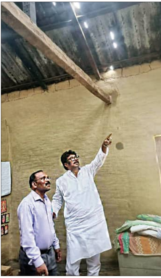
ବାରପଦା, ୨୧ ମାର୍ଚ୍ଚ (ସମ୍ପାଦକ)