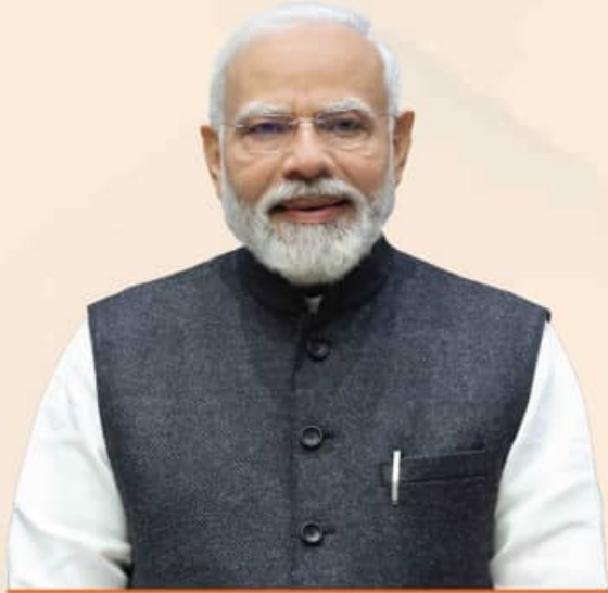
ଶ୍ରୀ ନରେନ୍ଦ୍ର ମୋଦୀ ପ୍ରଧାନମନ୍ତ୍ରୀ