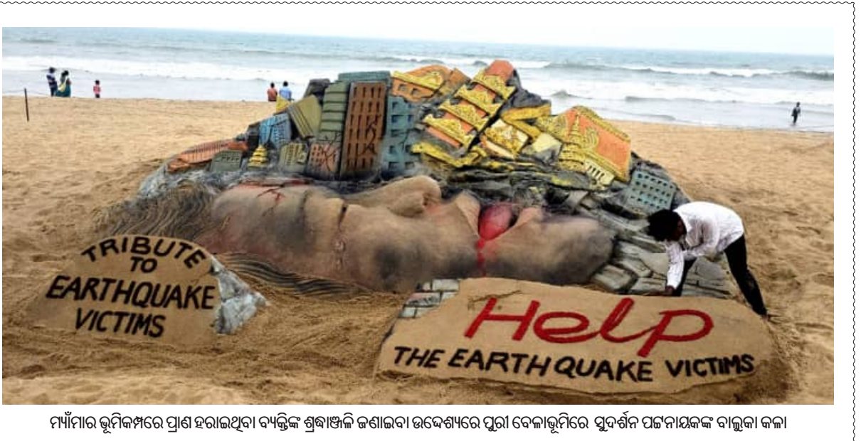
ମାଁମାରି ଭୂମିକମ୍ପରେ ପ୍ରାଣ ହରାଇଥିବା ବ୍ୟକ୍ତିଙ୍କ ଶ୍ରଦ୍ଧାଞ୍ଜଳି ଜଣାଇବା ଉଦ୍ଦେଶ୍ୟରେ ପୁରୀ ବେଳାଭୂମିରେ ସୁଦର୍ଶନ ପଟ୍ଟନାୟକଙ୍କ ବାଲୁକା କଳା

କୋରାପୁଟ ଜିଲ୍ଲାରେ ମହାପ୍ରଭୁଙ୍କ ଜମି ଜବରଦଖଲ ମୁକ୍ତ କରାଯାଇଛି।