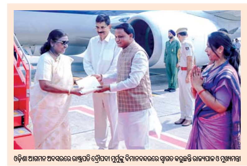
ଓଡ଼ିଶା ଆଗମନ ଅବସରରେ ରାଷ୍ଟ୍ରପତି ଡ୍ରୋପିନୀ ପୂର୍ଣ୍ଣିକା ବିମାନବନ୍ଦରରେ ସ୍ୱାଗତ କରୁଛନ୍ତି ରାଜ୍ୟପାଳ ଓ ମୁଖ୍ୟମନ୍ତ୍ରୀ