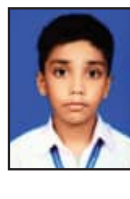
ହର୍ଷବର୍ଦ୍ଧନ ମଣ୍ଡଳ ଦ୍ଵିତୀୟ ଶ୍ରେଣୀ ସେଣ୍ଟ ଜେଭିଏଡ଼ ହାଇସ୍କୁଲ ଝୁନି-୯, ଭୁବନେଶ୍ଵର