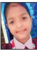
ସାଲ ଶ୍ରୀ ପଞ୍ଚମ ଶ୍ରେଣୀ ଭେକ୍‌ବେଟର ସ୍କୁଲ ନିମାପଡ଼ା