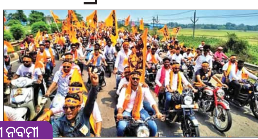
ଶ୍ରୀରାମ ନବମୀ ମହୋତ୍ସବ-୨୦୨୫