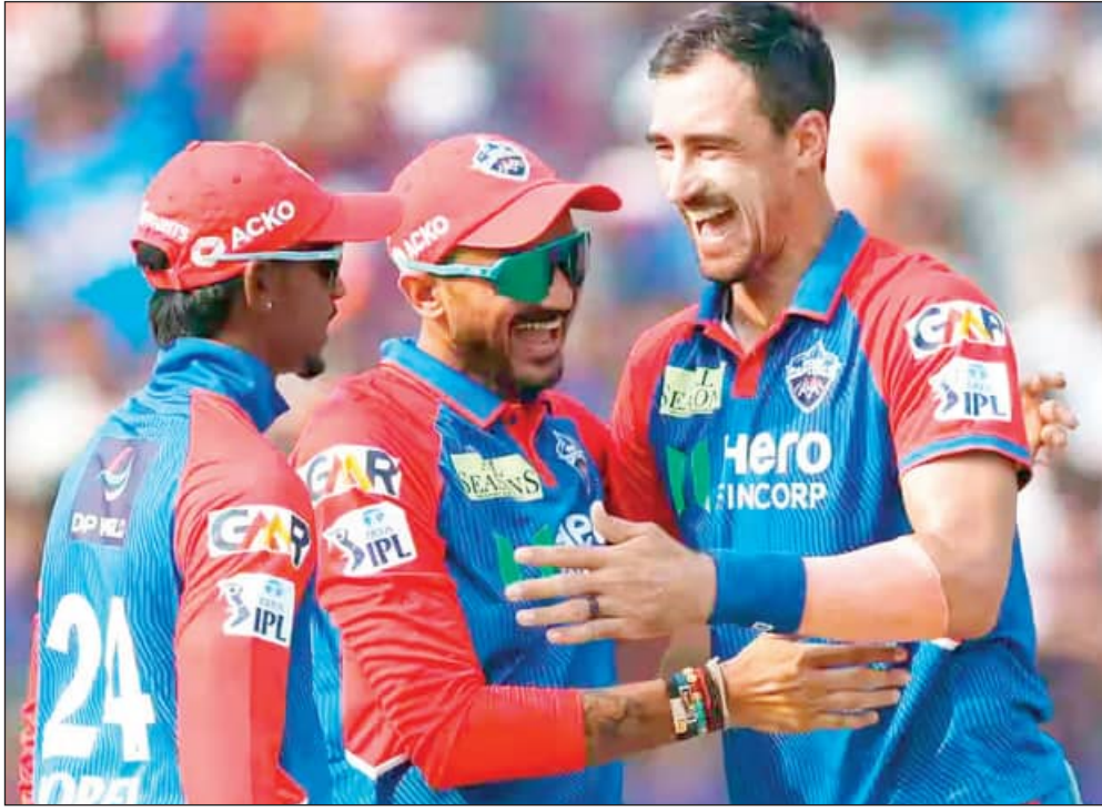
ବିଶାଖାପାଟଣା, ୩୦ମାର୍ଚ୍ଚ (ଏକେନ୍ଦ୍ରି)

ଅଷ୍ଟେଲାଇ ଯାଏ ବୋଲର ମିଡ଼ିଆ ଉଦ୍ୟୋଗୀଙ୍କ ଘାତକ ବୋଲି ବଳରେ ଏଠାରେ ରବିବାର ଖେଳାଯାଇଥିବା ଆଇପିଏଲ୍ ମ୍ୟାଚରେ ଦିଲ୍ଲୀ କ୍ୟାପିଟାଲ୍ସ ସହଜ ବିଜୟ ହାସଲ କରିଛି । ଷ୍ଟାର୍ଟି ଚିଟ୍ଟି ଓ କୁଲଦାପ ଯାଦବ ୩୧ ଓ ୨୯ ରନ୍ କରିବା ପରେ ଦିଲ୍ଲୀ ୬ ଓ ୧୯ ରନ୍ରେ ସହଜରେ ହାଇଦରାବାଦ୍ ପରାସ୍ତ କରିଛି । ଏହା ପରେ ଅକ୍ଷୟ ପଟେଲଙ୍କ ନେତୃତ୍ୱରେ ଗଠିତ ଦିଲ୍ଲୀ ୨ଟି ମ୍ୟାଚରେ ୨ଟି ବିଜୟ ସହ ଶତପ୍ରତିଶତ ସଫଳତା ପାଇଛି । ଏହି ଦଳ ପ୍ରଥମ ମ୍ୟାଚରେ ଆକ୍ରମଣ ଶୀର୍ଷକ ବିଶେଷକରି ଅର୍ଦ୍ଧଶତକ ବଳରେ ନାଟକୀୟ ଭାବେ ଲକ୍ଷ୍ମୀ ସୁପର ଜ୍ୟାଣ୍ଟସ୍କୁ ପରାସ୍ତ କରିଥିଲା । ଅନ୍ୟ ପକ୍ଷରେ ପ୍ରଥମ ମ୍ୟାଚରେ ୨୮ ଓ ୨୯ ରନ୍ କରି ଦମଦାମ ବିଜୟ ହାସଲ କରିଥିବା ହାଇଦରାବାଦ୍ ଏହା ପରେ କ୍ରମାଗତ ଦ୍ୱିତୀୟ ପରାସ୍ତ ବରଣ କରିଛି । ଏହି ମ୍ୟାଚରେ ୩୫ ରନ୍ ଦେଇ ଚିଟ୍ଟି ଓ ୧୯ ରନ୍ ଦେଇ ପଟେଲ ଦିଲ୍ଲୀ ଦଳର ମିଡ଼ିଆ ଉଦ୍ୟୋଗୀଙ୍କ ଶ୍ରେଷ୍ଠ ଖେଳାଳି ବିବେଚିତ କରାଯାଇଛି ।