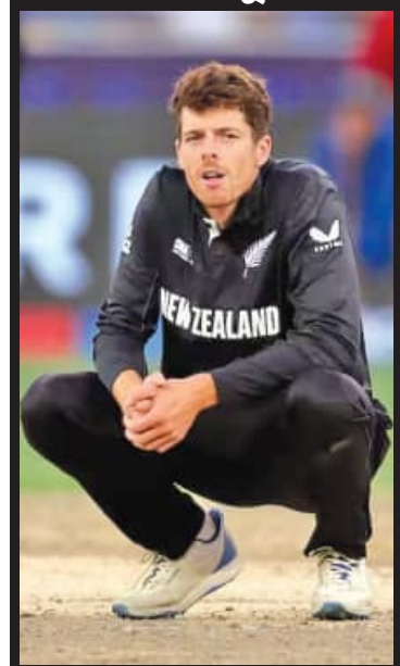
ପରାଜୟ ପରେ ବିଷାଦଗ୍ରସ୍ତ ଅଧିନାୟକ ସାୟନର

୨୦୧୩ରେ ଚାମ୍ପିଅନ ହୋଇଥିଲା । ଭାରତ ମଧ୍ୟ କ୍ରମାଗତ ତୃତୀୟଥର ଲାଗି ଅର୍ଥାତ୍ ୨୦୧୩, ୨୦୧୭ ଓ ୨୦୨୫ରେ ପାଇନାଲରେ ପ୍ରବେଶ କରି ୨ଥର ଚାମ୍ପିଅନ୍ ହୋଇଛି । ଏହି ମ୍ୟାଚ୍‌ରେ ସର୍ବାଧିକ ୭୬ ରନ କରିଥିବା ଭାରତୀୟ ଅଧିନାୟକ ରୋହିତ ଶର୍ମାଙ୍କୁ ମ୍ୟାଚର ଶ୍ରେଷ୍ଠ ଖେଳାଳି ବିବେଚିତ କରାଯାଇଛି ।