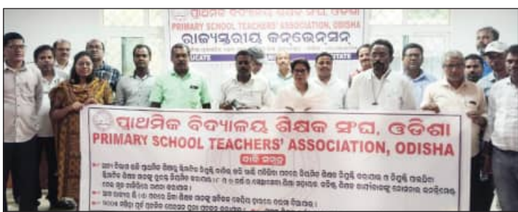
■ ଭିତ୍ତିଭୂମି ବିକାଶ ନ କରି ଲାଗୁ କରାଯାଇଛି ଜାତୀୟ ଶିକ୍ଷାନୀତି ■ ଶିଶୁ ବାଟିକା କାର୍ଯ୍ୟକ୍ରମ ବିଫଳ ହେବାନେଇ ଚେତାଇଲେ

ଭୁବନେଶ୍ୱର, ୯।୩।(ସମିଧା): ଆସନ୍ତା ଶିକ୍ଷାବର୍ଷରୁ ପ୍ରଥମ କରି ପ୍ରାଥମିକ ବିଦ୍ୟାଳୟରେ ଆରମ୍ଭ ହେଉଛି ଶିଶୁ ବାଟିକା। ପ୍ରାୟ ୪୫ ହଜାର ବିଦ୍ୟାଳୟରେ ଶିଶୁ ବାଟିକା ଖୋଲିବାକୁ ସରକାର ନିଷ୍ପତ୍ତି ନେଇଛନ୍ତି। ହେଲେ ସେମାନଙ୍କୁ ପଢ଼ାଇବ କିଏ? ଛୋଟ ପିଲାଙ୍କ ଶାରୀରିକ ଯତ୍ନ ନେବ କିଏ? ଆବଶ୍ୟକ ସଂଖ୍ୟକ ଶିକ୍ଷକ ନିଯୁକ୍ତି ନ କରି ସରକାରଙ୍କ ଏହି ନିଷ୍ପତ୍ତି ପ୍ରାଥମିକ ଶିକ୍ଷକଙ୍କୁ ଅଧିକ ଚାପଗ୍ରସ୍ତ କରିବ। ତେଣୁ, ଶିଶୁବାଟିକାରେ ପିଲାଙ୍କୁ ପଢ଼ାଇବେ ନାହିଁ ବୋଲି ରୋକଠୋକ ଶୁଣାଇ ଦେଇଛି ପ୍ରାଥମିକ ଶିକ୍ଷକ ସଂଘ। ଉଦ୍ଦିଷ୍ଟ ରାଜ୍ୟସ୍ତରୀୟ ସମ୍ମିଳନୀରେ ସଂଘ ଏପରି ଆଭିମୁଖ୍ୟ ଘୋଷଣା କରିବା ପରେ ସରକାର ଅତୁରାରେ ପଡ଼ିଛନ୍ତି। ଶିକ୍ଷକ ଅଭାବରୁ ଶିଶୁଙ୍କ ଶିକ୍ଷଣ ଓ ଶାରୀରିକ ବିକାଶ କିପରି ହେବ ବୋଲି ମଧ୍ୟ ପ୍ରଶ୍ନ ଉଠିଛି।