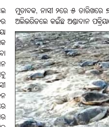
ହୋଇଥିବା ବେଳେ ୬ ତାରିଖରେ ୧,୧୪,୦୦୨, ୬ ତାରିଖରେ ୨୧,୯୧୨, ୮ ତାରିଖରେ ୩୧, ୬୨୯ କର୍ଳକ୍ଷ ଗଣ ଅଣ୍ଟାଦାନ କରିଛନ୍ତି। ଏକକୂଳ ନାସୀ ରେ

ରାଜନଗର, ୯।୩।(ସମିଧା): ବିରଳ ଅଲିଭରିଡ଼ଲେ କର୍ଳକ୍ଷକ ଏକାନ୍ତରେ କେନ୍ଦ୍ରୀୟ ଉପକୂଳର ଗହୀରମଥାଠାରେ କର୍ଳକ୍ଷକ ଅଣ୍ଟାଦାନ ପଦ୍ଧତି ଜାରି ରହିଛି। ଚେତୁରାଗାରେ ରେକର୍ଡ଼ ସଂଖ୍ୟକ ଅଲିଭରିଡ଼ଲେ ଗଣ ଅଣ୍ଟାଦାନରେ ସାମିଲ ହେବା ପରେ ଚଳିତବର୍ଷ ଗହୀରମଥାରେ ଗଣ ଅଣ୍ଟାଦାନ ହେବ କି ନାହିଁ ଆଶଙ୍କା ପ୍ରକାଶ ପାଇଥିଲା। ମାତ୍ର ସବୁ ଆଶଙ୍କାର ଅବସାନ ଘଟଣା ଗତ ୫ ଦିନ ହେଲା ନାସୀ-୨ ଓ ୩୧ ବର୍ଷ ପରେ ଏକକୂଳ ନାସୀରେ ୪ଦିନ ହେଲା ଗଣଅଣ୍ଟାଦାନ ଜାରି ରହିଛି। ୫ଦିନ ମଧ୍ୟରେ ଗହୀରମଥା ନାସୀ-୨ରେ ୨ ଲକ୍ଷ ୫୩ ହଜାର ୪୨୬ ଅଲିଭରିଡ଼ଲେ ଅଣ୍ଟାଦାନ ପ୍ରକ୍ରିୟାରେ ସାମିଲ ହୋଇ ସାରିଥିବା ବେଳେ ଏକକୂଳ ନାସୀରେ ୨ ଲକ୍ଷ ୯୬ ହଜାର ୪୩୬ କର୍ଳକ୍ଷ ଅଣ୍ଟାଦାନ କରିଛନ୍ତି। ବନ ବିଭାଗ ସୁତରା ମିଳିଥିବା ସୂଚନା