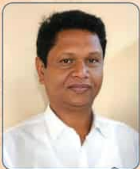
ପ୍ରଣବ ପ୍ରକାଶ ଦାସ

ପ୍ରଖ୍ୟାତ ଜନନାୟକ, କୋଟି ଓଡ଼ିଆଙ୍କ ମଉତମଣୀ, ପ୍ରବାଦ ପୁରୁଷ