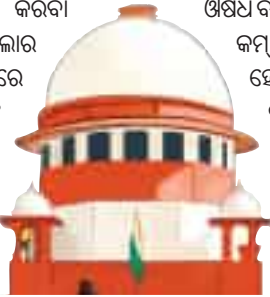
ରୋଗୀଙ୍କୁ ଲୁଚୁଛନ୍ତି ଘରୋଇ ହସ୍ତିଚାଳ: ସୁପ୍ରିମକୋର୍ଟ

ଏତେ ସଂଖ୍ୟାରେ ଘରୋଇ ହସ୍ତିଚାଳ କାର୍ଯ୍ୟ କରୁଥିଲା ବେଳେ ସେଠାରେ କ'ଣ ଘଟୁଛି ସରକାର କିଭଳି ଜାଣିପାରିବେନି ବୋଲି ସୁପ୍ରିମକୋର୍ଟ ପ୍ରଶ୍ନ କରିଛନ୍ତି। ଏଥିପାଇଁ କ'ଣ ନ୍ୟାୟିକ ନିର୍ଦ୍ଦେଶ ଦେବାର ଅବକାଶ ଅଛି କି ବୋଲି ଖଣ୍ଡପୀଠ କହିଛନ୍ତି। ଜଣେ ରୋଗୀ ଚିକିତ୍ସା ପାଇଁ ହସ୍ତିଚାଳରେ ଭର୍ତ୍ତି ହେବା ପରେ ତାଙ୍କୁ ସ୍ତବ୍ଧ କରି ଘରକୁ ଆଣିବା ତାଙ୍କ ପରିବାର ସଦସ୍ୟଙ୍କ ଏକମାତ୍ର ଲକ୍ଷ୍ୟ ରହିଥାଏ। କିନ୍ତୁ ସବୁ ଘରୋଇ ହସ୍ତିଚାଳରେ ରୋଗୀଙ୍କ ନିକଟତମ ଲୋକଙ୍କୁ ହସ୍ତିଚାଳ ପରିସରରୁ ଔଷଧ କିଣିବାକୁ ବାଧ୍ୟ କରାଯାଇଥାଏ। ଏହାକୁ ନେଇ ଅନେକ ସମୟରେ ହସ୍ତିଚାଳ କର୍ତ୍ତୃପକ୍ଷ ► ପୃଷ୍ଠା-୯