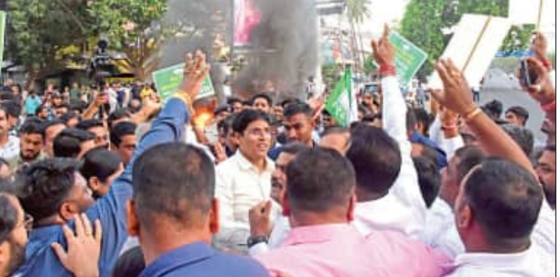
ସରକାରଙ୍କ ନିଷ୍ପତ୍ତି ସଂକୀର୍ଣ୍ଣ ମନୋଭାବର ପରିଚୟ

■ ଭୁବନେଶ୍ୱର, ୬ ମାର୍ଚ୍ଚ (ସମ୍ପାଦକ): ମାର୍ଚ୍ଚ ୫ରେ ବିଜୁ ଜୟଶିଙ୍କରଙ୍କୁ ପ୍ରତିବର୍ଷ ଅନୁଷ୍ଠିତ ହେଉଥିବା ପଞ୍ଚାୟତିରାଜ ଦିବସକୁ ଏପ୍ରିଲ ୨୪କୁ ପରିବର୍ତ୍ତନ ଓ ସରକାରୀ ଛୁଟି ବାତିଲ କରି ରାଜ୍ୟ ସରକାର ପ୍ରବାଦ ପୁରୁଷ ବିଜୁ ପଟ୍ଟନାୟକଙ୍କୁ ଅସମ୍ମାନ ପ୍ରତିବାଦରେ ସାରା ରାଜ୍ୟରେ ଗର୍ଜିଛି ବିଜେଡି । ସରକାର ସଂକୀର୍ଣ୍ଣ ମନୋଭାବର ପରିଚୟ ଦେବା ସହ ଅସହିଷ୍ଣୁତା ପୋଷଣ କରିଥିବା ଅଭିଯୋଗ କରି ରାଜ୍ୟର ସମସ୍ତ ନିର୍ବାଚନମଣ୍ଡଳରେ ପ୍ରତିବାଦ ସମାବେଶ ଓ ଶୋଭାଯାତ୍ରା ଅନୁଷ୍ଠିତ ହୋଇଛି । ଦଳର ନେତାମାନେ ରାଜ୍ୟ ସରକାରଙ୍କ ବିଜୁ ବିରୋଧୀ ମନୋଭାବକୁ କରୁ ସମାଲୋଚନା କରିଛନ୍ତି । ରାଜ୍ୟ ସରକାରଙ୍କ ଏହି ନିଷ୍ପତ୍ତି ବିରୋଧରେ ରାଜ୍ୟର ପ୍ରତ୍ୟେକ ବର୍ଗର ଲୋକଙ୍କୁ ଆଘାତ ଦେଇଛି ବୋଲି ଦଳ ପକ୍ଷରୁ କୁହାଯାଇଛି । ଗତ ୩ ଦଶନ୍ଧି ଧରି ରାଜ୍ୟରେ