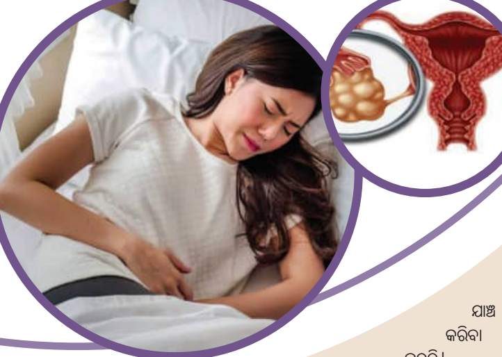
ଯାଞ୍ଚ କରିବା ଜରୁରି। ସେହିପରି ହୃଦ୍‌ସମ୍ପର୍କରେ ଚେଷ୍ଟା କରିବା ଆବଶ୍ୟକ।