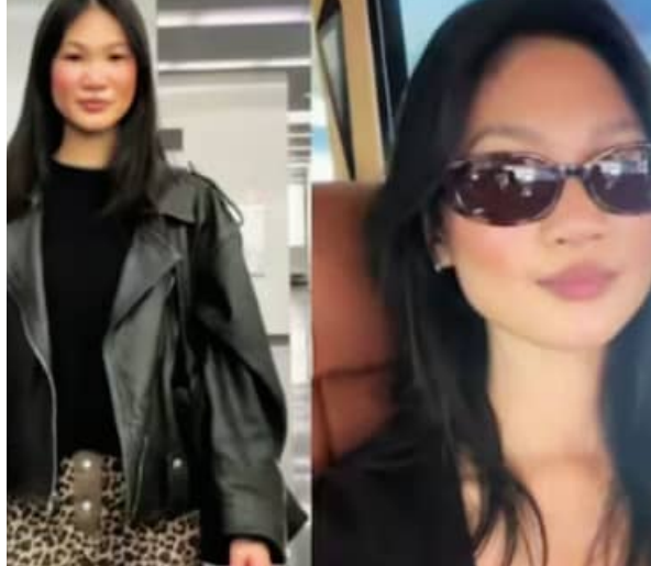
୮୩ ଲକ୍ଷ ଟଙ୍କା ସଞ୍ଚୟ କରିସାରିଲେଣି। ଯଦି ଏହି ଧାରା ଜାରି ରୁହେ ତାହେଲେ ଯୁବତୀ ଜଣକ ୪୦ ବର୍ଷ ମଧ୍ୟରେ ୧୧ କୋଟି ଟଙ୍କା ସଞ୍ଚୟ କରି ନିଜ ପାଇଁ ଘର ବିଶିଷ୍ଟ ଆଶା ରଖୁଛନ୍ତି।