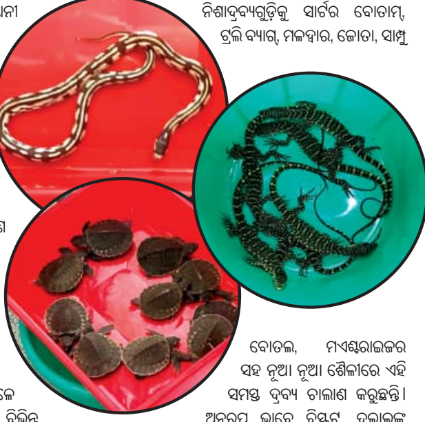
ଦୋତଳ, ମଧ୍ୟସ୍ତରୀୟର ସହ ନୁଆ ନୁଆ ଶୈଳରେ ଏହି ସମସ୍ତ ବୃନ୍ଦ୍ୟ ଚାଲାଣ କରୁଛନ୍ତି। ଅନୁରୂପ ଭାବେ ବିଷ୍କର୍, ଦଲାଲ୍ ସହାୟତାରେ ଗ୍ୟାଙ୍ଗ୍ ମୁଖ୍ୟ ଆଞ୍ଚାଟ ସ୍ଥାନରେ

ମାଟିଆ ବିଭିନ୍ନ ସାମଗ୍ରୀ ଚୋରା ଚାଲାଣ କରି ନୁଆ ନୁଆ କାର୍ଯ୍ୟକାରୀ କରୁଛନ୍ତି। ସୁରକ୍ଷା କର୍ମୀଙ୍କଠାରୁ ଗୋଟିଏ ପାଦ ଆଗକୁ ବଢ଼ିଛନ୍ତି ମାଟିଆ। ପୁନା, ଟଙ୍କା ଓ ନିଶାଦ୍ୱୟଗୁଡ଼ିକୁ ସାର୍ବତ୍ର ବୋତାମ୍, ଗ୍ରାଭି ବ୍ୟାଗ୍, ମଲ୍‌ବାର, ଜୋଡା, ସାମ୍ବୁ ରହି ଚୋରା ଚାଲାଣର ଅପରେଟ୍ କରୁଛି। ଠିକଣା ସ୍ଥାନରେ ମାଲ୍ ପହଞ୍ଚାଇବା ପରେ ଦଲାଲ୍ ନିଜର କମିଶନ ଟଙ୍କା ନେଇଯାଉଛନ୍ତି। ସୂଚନାଯୋଗ୍ୟ ଯେ, ନିକଟରେ ଭୁବନେଶ୍ୱର ବିମାନ ବନ୍ଦରରୁ ୧୪ କୋଟିର ମାଟିଆ ସହ ୩ ମାଟିଆକୁ ଗିରଫ କରାଯାଇଥିଲା। କର୍ମୀମାନେ ମାଟିଆ (ଗଞ୍ଜେଇ)କୁ ଆଇଲ୍ୟାଣ୍ଡର ବ୍ୟାକ୍ ଓ ମାଲେସିଆର ବାଲୁକାପୁରରୁ ଭାଙ୍ଗି ଓଡ଼ିଶା ଦେଇ ଚାଲାଣବେଳେ ଧରାପଡ଼ିଥିଲା। ଏଥିସହ ବିମାନ ବନ୍ଦରରୁ ପୁନା ପୁନା ପୁନା ଓ ରୁପା ଜବତ ହୋଇଛି। ଏହି ସବୁ ସୁନାକୁ ସିଙ୍ଗାପୁର, ଯୁଏଭି, ହୁବାଇ, ମାଲେସିଆ, ବ୍ୟାକ୍ ଓ ସୁଇଜର୍ଲାଣ୍ଡର ସୁନା ବିସ୍କର୍ ଆଣି ଦକ୍ଷିଣ ଭାରତ ଯାଏଁ ଏହାର ଚେର ଲମ୍ବିଛି। ଅନୁରୂପ ଭାବେ ବିରଳ ଅଷ୍ଟାଧୁ ମୂଲି ବିମାନରେ ବିଦେଶକୁ ଚାଲାଣ କରାଯାଉଛି। ସ୍ୱେଡେନରେ ଦେଶଗୁଡ଼ିକୁ ଭଣ୍ଡାନ୍ତ କଟେକ୍ ଏମ୍ପୋରିଅମ୍ ଖୋଲି ସେଠାରେ ବିରଳ ଅଷ୍ଟାଧୁ ମୂଲି ଯାଉଥିବା ପ୍ରମାଣ ମିଳିଛି। ରାଜ୍ୟର ପ୍ରାଚୀନ ମନ୍ଦିରରୁ ବହୁ ମୂଲ୍ୟର ଅଷ୍ଟାଧୁ ମୂଲି ଚୋରି ଘଟଣା ଘାଟା ରାଜ୍ୟରେ ଆଲୋଡ଼ିତ ହୁଏ। ପାର୍ଚ୍ଚ, ବିଷ୍ଣୁ, ରାଧାକୃଷ୍ଣ, ଶିବ, ତନ୍ତ୍ରଶେଖର, ପାର୍ବତୀ ପ୍ରାଚୀନ ମୂଲି ଉପରେ ମାଟିଆମାନେ ସ୍ୱେଡେନ ଦେଶ ତଥା ଆମେରିକା, ଆଇଲ୍ୟାଣ୍ଡ ଭଳି ବିଦେଶରେ ଭାରତୀୟ ପ୍ରାଚୀନ ମୂଲିକୁ ଚାଲାଣ କରୁଛନ୍ତି।