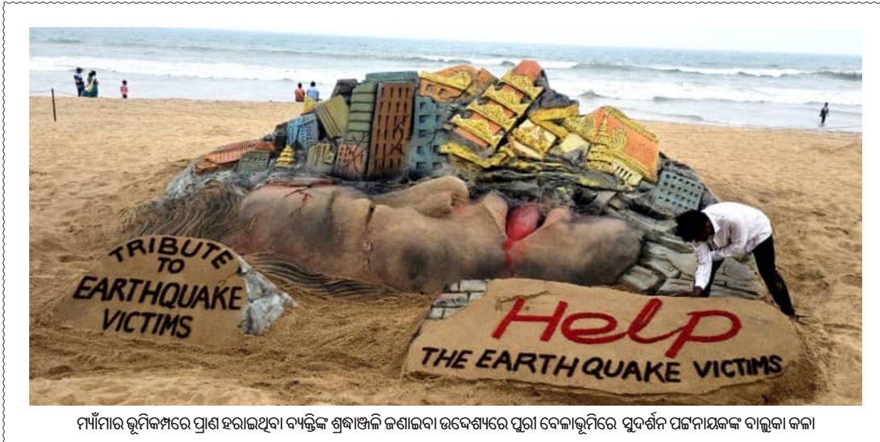
ମାଁମାରି ଭୂମିକମ୍ପରେ ପ୍ରାଣ ହରାଇଥିବା ବ୍ୟକ୍ତିଙ୍କ ଶ୍ରଦ୍ଧାଞ୍ଜଳି ଜଣାଇବା ଉଦ୍ଦେଶ୍ୟରେ ପୁରୀ ବେଳାଭୂମିରେ ସୁଦର୍ଶନ ପଟ୍ଟନାୟକଙ୍କ ବାଲୁକା କଳା

କୋରାପୁଟ ଜିଲ୍ଲାରେ ମହାପ୍ରଭୁଙ୍କ ଜମି ଜବରଦଖଲ ମୁକ୍ତ କରାଯାଇଛି।