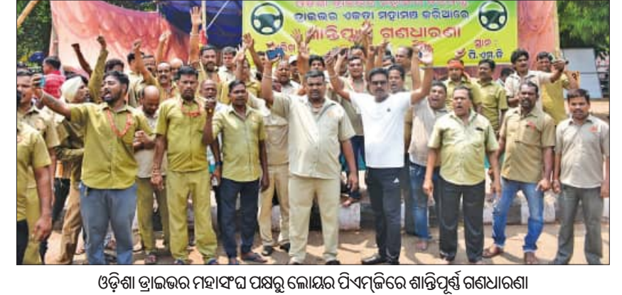
ଓଡ଼ିଶା ଗୃହକର୍ମ ମହାଫଣ୍ଡ ପକ୍ଷରୁ ଲୋକପ୍ରିୟ ପଦ୍ଧତିରେ ଶାନ୍ତିପୂର୍ଣ୍ଣ ଗଣଧାରଣା