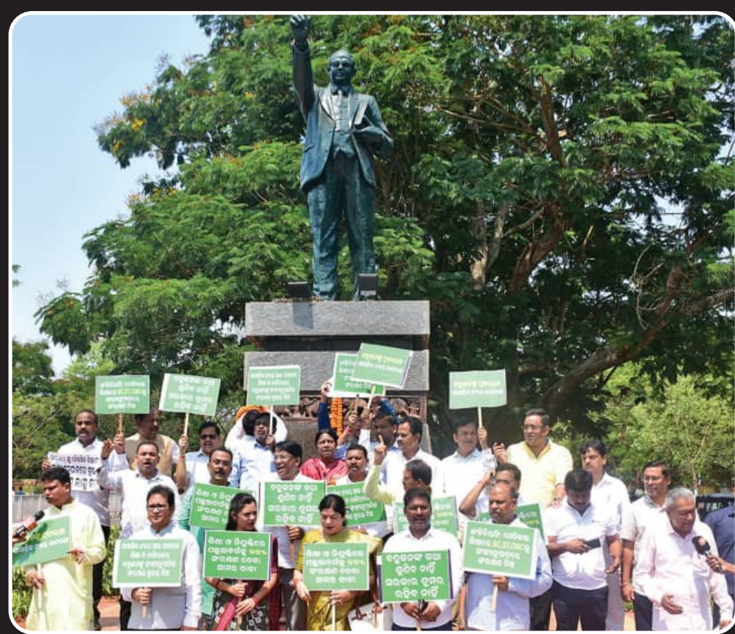
ଆନ୍ଦୋଳନର ପ୍ରତିମୂର୍ତ୍ତି ଚଳେ ବିକେଡ଼ିର ଧାରଣା