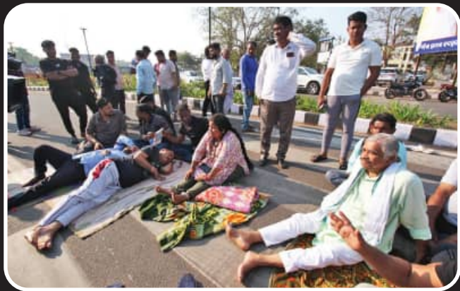
ବିଧାନସଭାରୁ କଂଗ୍ରେସ ବିଧାୟକଙ୍କ ନିକମ୍ପନ ବିରୋଧରେ ଦକାୟ ନେତା ଓ କର୍ମୀଙ୍କ ଧାରଣା ଓ ପ୍ରତିବାଦ