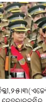
ନୂଆଦିଲ୍ଲୀ, ୨୫ମାର୍ଚ୍ଚ (ଏକେଡି): ୯୨ ବର୍ଷରେ ପ୍ରଥମ ଥର ପାଇଁ ତେହରାହୁନସ୍ଥିତ ପ୍ରତିଷ୍ଠିତ ଇଣ୍ଡିଆନ୍ ମିଲିଟାରୀ

ଏକାଡେମୀ (ଆଇଏମ୍‌ଏ)ରେ ମହିଳା ଅଧିକାରୀଙ୍କୁ ପୁଣିକ୍ଷଣ ଦିଆଯିବ। ଏଥିପାଇଁ ଆସନ୍ତା ଜୁଲାଇ ମାସରେ ପ୍ରଥମ ବ୍ୟାଚ୍ ଆରମ୍ଭ ହେବ। ମହାରାଷ୍ଟ୍ରର ଶତ୍ରୁକରାସନାସ୍ଥିତ ନ୍ୟାସନାଲ ଡିଫେନ୍ସ ଏକାଡେମୀ (ଏନଡିଏ)ରୁ ଉତ୍ତୀର୍ଣ୍ଣ ହୋଇଥିବା ମହିଳା କ୍ୟାଡେଟ୍‌ମାନେ ଏହି ବ୍ୟାଚ୍‌ରେ ପୁଣିକ୍ଷଣ ନେବେ। ତିନି ବର୍ଷ ପୂର୍ବେ ସୁପ୍ରିମକୋର୍ଟଙ୍କ ଐତିହାସିକ ରାୟ ପରେ ତଳିତ ବର୍ଷ ଜୁଲାଇରେ ଆଇଏମ୍‌ଏରେ ମହିଳା ଅଫିସର କ୍ୟାଡେଟ୍‌ଙ୍କ ପ୍ରଥମ ବ୍ୟାଚ୍ ସାମିଲ ହେବାକୁ ଯାଉଛି ବୋଲି କୁହାଯାଇଛି। ତିନି ବର୍ଷ ତଳେ ଏନଡିଏରେ ମହିଳାଙ୍କୁ ଏହି ସୁଯୋଗ ମିଳିବ।