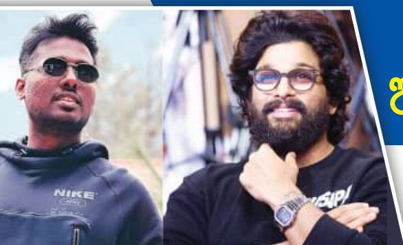
ଟେଲିଭିଜନ ପ୍ରସିଦ୍ଧ 'ଅଜବ ଏ ପ୍ରେମ କାହାଣୀ'ର ପ୍ରମୁଖ କଳାକାରମାନଙ୍କ ସହିତ ଫୋଟୋ ।