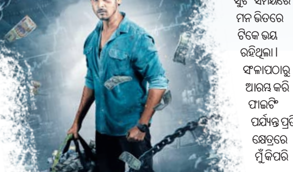
'ଘମାଘୋଟ' ଥିଲା ମୋ ଅଭିନୀତ ପ୍ରଥମ ସିନେମା । ତେଣୁ ଏହାର ସୁଟିଂ ସମୟରେ ମନ ଭିତରେ ଟିକେ ଭୟ ରହିଥିଲା । ସଂଳାପଠାରୁ ଆରମ୍ଭ କରି ଫାଇଟ୍ ପର୍ଯ୍ୟନ୍ତ ପ୍ରତି କ୍ଷେତ୍ରରେ ମୁଁ କିପରି