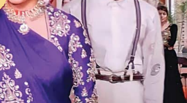
ଫିଲ୍ମ 'ଅଜବ ଏ ପ୍ରେମ କାହାଣୀ'ର ପ୍ରମୁଖ କଳାକାରମାନଙ୍କ ସହିତ ଫୋଟୋ ।

୨୦୨୧ ମସିହାରେ ନୂସରତ୍ତ୍ୱ ଭରୁବାଙ୍କ ଅଭିନୀତ ସିନେମାକୁ ଦର୍ଶକମାନେ ଆଦୃତି ମିଳିଥିଲା । ଏହା ସହିତ ଦର୍ଶକଙ୍କ ଏହାର ସିଦ୍ଧାନ୍ତକୁ ଅପେକ୍ଷା କରି ରହିଥିଲେ । ଏବେ ନିର୍ମାତା ଏହି ସିନେମାର ଦ୍ୱିତୀୟ ଭାଗ ଘୋଷଣା କରିଛନ୍ତି । ଏଥିରେ ନୂସରତ୍ତ୍ୱ ଅଭିନୟ କରିଥିବା ବେଳେ ଏହି ସିନେମାର ଟିଜର୍ ରିଲିଜ୍ କରିଛନ୍ତି । ସେହିପରି ଏହାର ଟିଜର୍‌କୁ ଦେଖି ବୁଝାପଡ଼ୁଛି ପ୍ରଥମ ଭାଗଠାରୁ ଏହା ଅତ୍ୟନ୍ତ ଭଲ ଲାଗିବ । ସୋହା ଅଲୀ ଖାନଙ୍କ ଭୟାନକ ରୂପ ମଧ୍ୟ ଏହାର ଟିଜର୍‌ରୁ ଦେଖିବାକୁ ମିଳିଛି । ଗୋଟିଏ ମିନିଟ୍ ୨୮ ସେକେଣ୍ଡର ଟିଜର୍‌ରୁ ଦର୍ଶକଙ୍କ ବେଶ୍ ପସନ୍ଦ କରିଛନ୍ତି । ଟିଜର୍ ପ୍ରାରମ୍ଭକୁ ଦେଖିବାକୁ ମିଳୁଛି ଗୋଟିଏ ଛୋଟା ପିଲା ତା' ମା' ସାଥୀ (ନୂସରତ୍ତ୍ୱ ଭରୁବା) ଠିକ୍ ଖୋଜୁଛି । ଏହାର ଭିତରେ ଭୟାନକ ଛାୟା ସଂଖ୍ୟରେ ଆସୁଛି । ଏହାପରେ ସାକ୍ଷୀର ସଂଗଠିତ ଆରମ୍ଭ ହୋଇଛି ଏବଂ ସେହି ଛାୟାରୁ ସେ ନିଜ ଛୁଆକୁ ବଞ୍ଚାଇବାକୁ ପ୍ରୟାସ କରିଛି । ସେହିପରି ଏହି ଟିଜର୍‌ରେ ନିର୍ମାତା ସୋହା ଅଲିଙ୍କ ମଧ୍ୟ ପରିଚିତ କରାଯାଇଛି ।