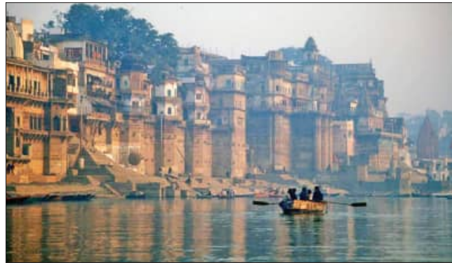
ଶୁବଶାସ୍ତ୍ର ନଦୀଗୁଡ଼ିକର ଜଳସ୍ତର ହ୍ରାସ ପାଇଯିବ। ହିମାଳୟ ଗୁଆୟର୍ସରୁ ବାହାରିଥିବା ଦୁଇ ଧାରା