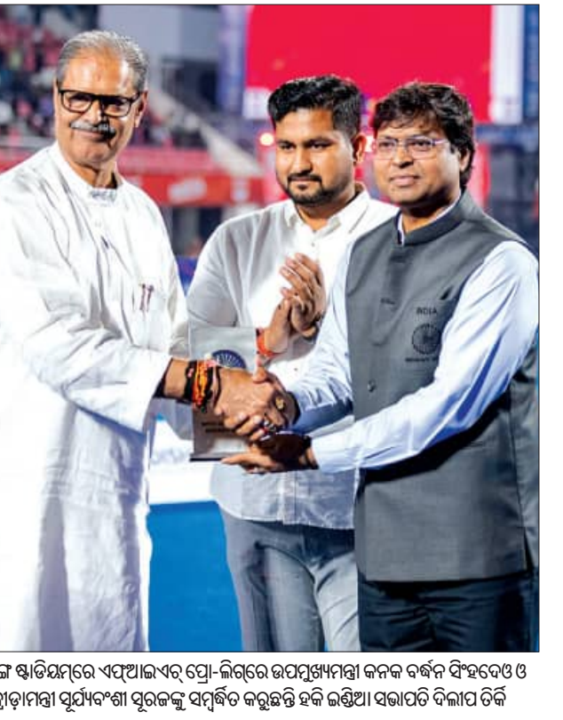
କଳିଙ୍ଗ ଷ୍ଟାଡ଼ିୟମରେ ଏଫଆଇଏର୍ ପ୍ରୋ-ଲିଗ୍ରେ ଉପମୁଖ୍ୟମନ୍ତ୍ରୀ କନକ ବର୍ଦ୍ଧନ ସିଂହଦେଓ ଓ କ୍ରୀଡ଼ାମନ୍ତ୍ରୀ ସୁଧାଂଶୁ ସୂରଜକୁ ସମ୍ବର୍ଦ୍ଧିତ କରୁଛନ୍ତି ହରି ଇଣ୍ଡିଆ ସଭାପତି ଦିଲୀପ ତିର୍କି