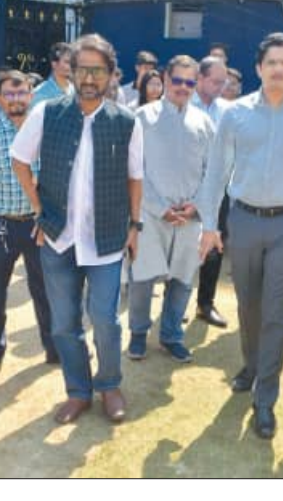
ଟିଆରୀ ଭୋକପୁରା ଦକ୍ଷିଣରେ ନେତୃତ୍ୱ ନେଉଛନ୍ତି । ସିସିଏଲ ପାଇଁ ଟିକେଟ୍ ସର୍ବନିମ୍ନ ମୂଲ୍ୟ ୧୦୦ ଟଙ୍କା ରଖାଯାଇଛି ।