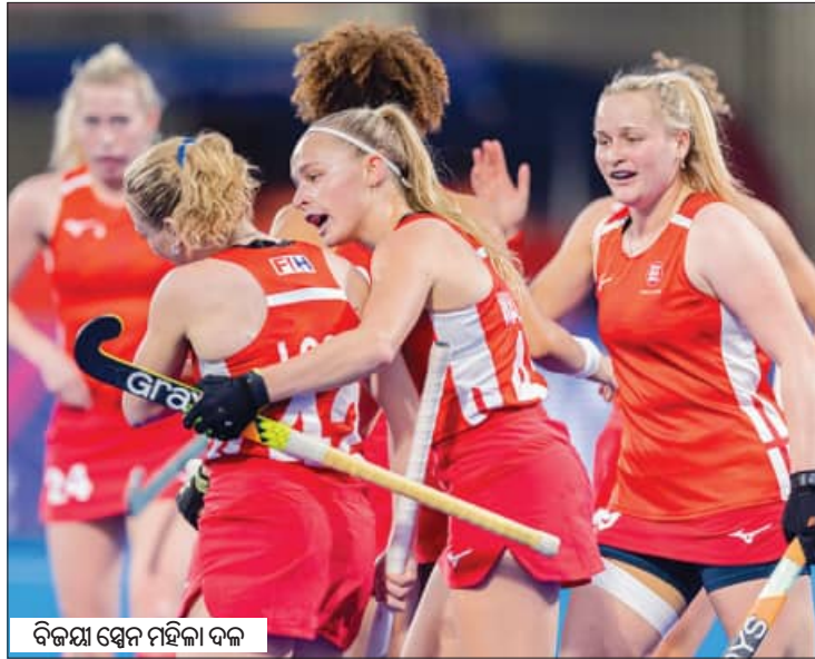
ବିଜୟ ଷ୍ଟେନ୍ ମହିଳା ଦଳ