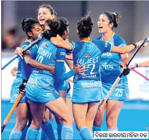
ବିଜୟ ଭାରତୀୟ ମହିଳା ଦଳ