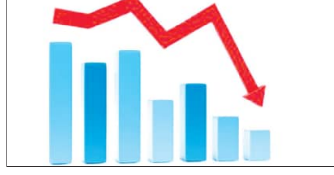
ରାଜ୍ୟର ଆର୍ଥିକ ସ୍ୱାସ୍ଥ୍ୟକୁ ରୁଗଣ କରିବ ଦୁଇ ବର୍ଷରେ ୯୦ ହଜାର କୋଟି ରଖି

■ ଭୁବନେଶ୍ୱର, ୨୦୧୨ (ସମିତ): ବିଧାନସଭାରେ ରାଜ୍ୟପାଳଙ୍କ ଅଭିଭାଷଣ ଓ ବଜେଟ୍ ଉପସ୍ଥାପନ ସମୟରେ ରାଜ୍ୟ ସରକାର ଦେଖାଇଛନ୍ତି ଅର୍ଥନୀତିର ଗୋଲାପା ଚିତ୍ର। ୨୦୩୬ ସୁଦ୍ଧା ରାଜ୍ୟର ଅର୍ଥନୀତିକୁ ୫୦୦ ବିଲିୟନ ଡଲାରରେ ପହଞ୍ଚାଇବାକୁ ସରକାର ଲକ୍ଷ୍ୟ ରଖିଥିବା କହିଛନ୍ତି। ମାତ୍ର ବିଦ୍ୟୁତ୍ ନାହିଁ ହେଉଛି ରାଜ୍ୟ ସରକାର ରାଜ୍ୟପାଳଙ୍କ ମୁହଁରେ କୁହାଇଥିବା କଥା, ରାଜ୍ୟ ବଜେଟ୍ ସହ ବାସ୍ତବତା ସାମ୍ୟାନ୍ତର ସମ୍ପର୍କ ନାହିଁ। ଗତ ୮ ମାସରେ ବିଜେପି ସରକାରଙ୍କ ଆର୍ଥିକ ପରିଚାଳନାକୁ ଅନୁଶୀଳନ କଲେ ସରକାରଙ୍କ ପାରିବା ପରିସ୍ଥିତି ଉପରେ ଖାଲି ପ୍ରଶ୍ନ ଉଠିନାହିଁ, ରାଜ୍ୟ ଅର୍ଥନୀତିର ଧୂସର ଚିତ୍ର ଜଳଜଳ ଦିଶୁଛି। ବିଭାଗ ପରିଚାଳନାରେ ବିଦ୍ୟୁତ୍ ସରକାରଙ୍କୁ ବିକାଶ କୃପଣରେ ପରିଣତ କରିଛି।