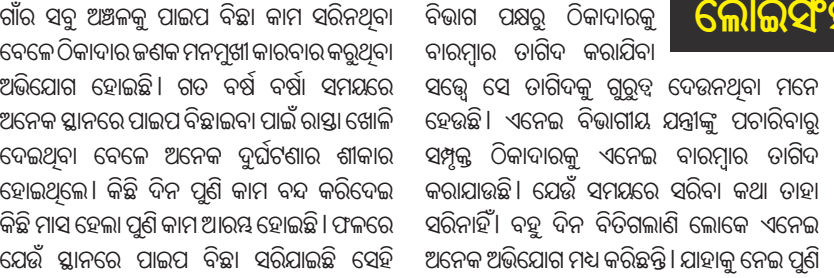
ଦୁର୍ଘଟଣା ଭୋଗୁଛନ୍ତି ଲୋଇଫିଙ୍ଗାବାସୀ

ପରେ ପାନୀୟ ଜଳ ସମ୍ପର୍କରେ କାମ କରୁଥିବା ଠିକାଦାରଙ୍କ ମନମୁଖୀ କାରବାରକୁ ନେଇ ତାଙ୍କୁ ଚିରିବ କରୁଥିଲେ। ଅବହେଳା କରୁଥିବା ଠିକାଦାରଙ୍କ ବିରୋଧରେ କଡ଼ା କାର୍ଯ୍ୟାନୁଷ୍ଠାନ ପାଇଁ ନିର୍ଦ୍ଦେଶ ଦେଇଥିଲେ। କିନ୍ତୁ ସମ୍ପୂର୍ଣ୍ଣ ଠିକାଦାର ଜଣକ କିଛି ବିଜେପି ନେତାଙ୍କୁ ହାତବାର୍ଦ୍ଧି କରି ମନମୁଖୀ କାରବାର ଚଳାଇଥିବା ଅଭିଯୋଗ ହୋଇଛି। ସମ୍ପୂର୍ଣ୍ଣ ଠିକାଦାର ବିରୋଧରେ ବିଭାଗୀୟ କଡ଼ା କାର୍ଯ୍ୟାନୁଷ୍ଠାନ ଗ୍ରହଣ କରିବା ସହ କାମ ଶାନ୍ତ ସାରିବା ବ୍ୟବସ୍ଥା ପାଇଁ ଦାବି ହୋଇଛି।