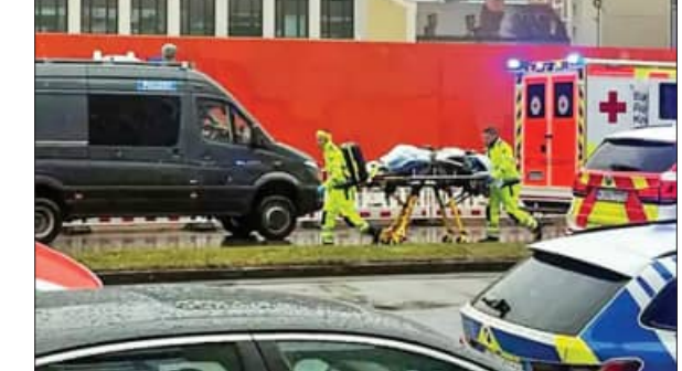
ପ୍ରହାରୀ ଲୋକଙ୍କ ଉପରେ ମିନି କୁପର କାର୍ତ୍ତବ୍ୟ ରଖାଯାଇଛି। ପୁଲିସ୍ ଏହାକୁ ଜବତ କରିଛି। ଜାଣିଶୁଣି ଆକ୍ରମଣ କରାଯାଇଛି ବୋଲି ପୁଲିସ୍ ସମେତ କରୁଛି।

୧୪ ଆହତ; ଆକ୍ରମଣକାରୀ ଗିରଫ ରାଜିଆ, ୧୩୧୨ (ଏଜେନ୍ସି): ଜର୍ମାନୀର ମ୍ୟୁନିଖ୍ ସହରରେ ଜଣେ ଆତମହତ୍ୟା ଗଳ୍ପୀଙ୍କ ଉପରେ କାର୍ତ୍ତବ୍ୟ ରଖାଯାଇଛି। ଏହି ଆକ୍ରମଣରେ ୨୮ ଜଣ ଆହତ ହୋଇଛନ୍ତି। ଗଣେଶ୍ୱରୀ ନାମରେ ଜଣେ ଆତମହତ୍ୟା ଗଳ୍ପୀଙ୍କୁ ଗିରଫ କରାଯାଇଛି।