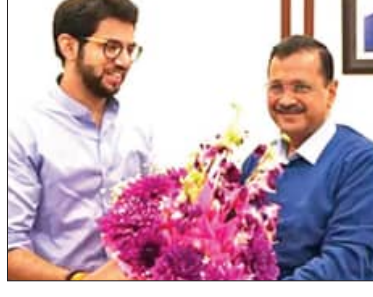
ଆଦିତ୍ୟ କହିବା ସହିତ ନିର୍ବାଚନରେ ଅନିର୍ଣ୍ଣିତତା କରି ଦଳ ସବୁ ସ୍ଥାନରେ କ୍ଷମତାପ୍ରାପ୍ତ ହେବାକୁ ଚାହୁଁଛନ୍ତି ବୋଲି କହିଛନ୍ତି। ଦିଲ୍ଲୀ ନିର୍ବାଚନରେ

ନୂଆଦିଲ୍ଲୀ, ୧୩୧୨ (ଏଜେନ୍ସି): ଶିବସେନା(ୟୁଭିଟି) ନେତା ଆଦିତ୍ୟ ଠାକରେ ଗତକାଳି କଂଗ୍ରେସ ନେତା ରାହୁଲ ଗାନ୍ଧୀଙ୍କୁ ଭେଟିବା ପରେ ଗୁରୁବାର ଆମ ଆଦମ୍ବା ପାର୍ଟି ମୁଖ୍ୟ ଅରବିନ୍ଦ କେଜ୍ରିଝାଲଙ୍କୁ ଭେଟି ବିଭିନ୍ନ ପ୍ରସଙ୍ଗରେ ଆଲୋଚନା କରିଛନ୍ତି। ଦଳ କ୍ଷମତାରେ ଥାଇ ବି ନ ଥାଇ ଲକ୍ଷ୍ମୀ ମୋଦୀ ସହଯୋଗୀ ଦଳ ଭାବେ କେଜ୍ରିଝାଲଙ୍କ ସହ ତାଙ୍କର ସାମ୍ପାଦକାର ଯୋଜନାମୁକ୍ତ ଥିଲା ବୋଲି ସେ କହିଛନ୍ତି। ତେବେ ଏହି ସମୟରେ ଆଞ୍ଚଳିକ ଦଳଗୁଡ଼ିକୁ ପ୍ରତି ବିଜେପିର ଆକ୍ରମଣକୁ ନେଇ ସେ ବଡ଼ ପ୍ରଶ୍ନ ଉଠାଇଛନ୍ତି। ବିଜେପି ଦେଶର ସବୁ ଆଞ୍ଚଳିକ ଦଳକୁ ଶେଷ କରି ଦେବାକୁ ବସିଛି ବୋଲି କହିଛନ୍ତି।