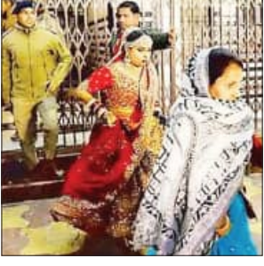
ବନ୍ଦୁକ ଖସି ପଡ଼ିଥିଲା। ହାତକୁ ଆକ୍ରମଣ କରି ବାସ ଅନ୍ୟପଟକୁ ଚାଲି ଯାଇଥିଲା। ଦୀର୍ଘ ସମୟ ପରେ ବନ୍ଦୁକଟି ବାସରୁ ବାହାରିବାରେ ସମର୍ଥନ ହୋଇଥିଲା। ପରେ ବିବାହ ହୋଇଥିଲା।

ବାହାରର ବନ୍ଦ କରିଦେଲା କଲରାପତରିଆ ବାସ ଲକ୍ଷ୍ନୌ, ୧୩୧୨ (ଏଜେନ୍ସି): କଲରାପତରିଆ ବାସ ପାଇଁ ଏକ ବିବାହ ବନ୍ଦ ହୋଇଯାଇଛି। ବରଯାତ୍ରୀ ଖାଇବା ପୂର୍ବେ ଛାଡ଼ି ପକାଇ ଯାଇଛନ୍ତି। ବରକନ୍ୟା ଭୟରେ ଦୌଡ଼ି ପକାଇ କାରରେ ଲୁଚି ଜୀବନ ବଞ୍ଚାଇଛନ୍ତି। ବୁଦ୍ଧ କ୍ୟାମେରାମାନଙ୍କୁ ବ୍ୟାମେରା ଛାଡ଼ି ପକାଇବା ପରେ ଘଟଣା ସମ୍ବନ୍ଧରେ ସମ୍ପୂର୍ଣ୍ଣ ବିବରଣୀ ମିଳିପାରେ।