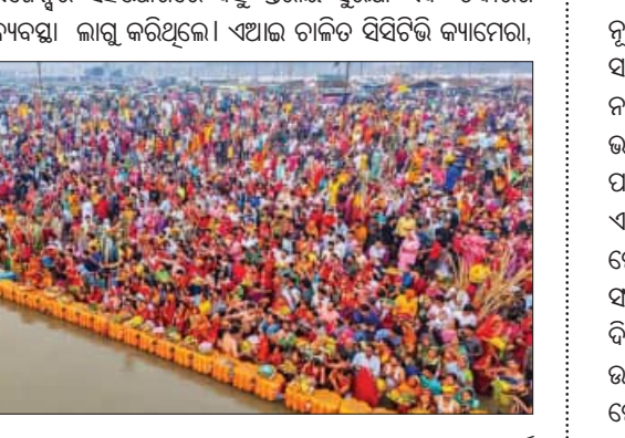
ସେସନ ସାମୟିକ ଭାବେ ବନ୍ଦ ରହିଛି। ରାଜ୍ୟ ସରକାର ବିଭିନ୍ନ ଏଜେନ୍ସିର ସହଯୋଗରେ ବହୁ ସୁଯୋଗ ସୂଚଣା ଏବଂ ତଦାରଖ ବ୍ୟବସ୍ଥା ଲାଗୁ କରିଥିଲେ। ଏହା ଚାଲି ଥିବିତ୍ତି ବ୍ୟାମେରା, ଗୁରୁବାର ଦିନେ

ପ୍ରାୟଗରାଜ, ୧୩୧୨ (ଏଜେନ୍ସି): ପ୍ରାୟଗରାଜ ମହାକୁମ୍ଭ ମେଳାରେ ଗୁରୁବାର ସୁଦ୍ଧା ୫୦ କୋଟି ଶ୍ରମିକ ସାମିଲ ହୋଇସାରିଛନ୍ତି। କାହ୍ନୁଆରା ୧୩୧୨ ଆରମ୍ଭ ହୋଇଥିବା ଇତିହାସର ସବୁଠାରୁ ବଡ଼ ସାମିଲ ସମାବେଶ ଫେବୃଆରୀ ୨୬ ଯାଏଁ ଚାଲିବାକୁ ରହିଥିବା ବୋଲି ଏଥିରେ ପ୍ରାୟ ୪୫ କୋଟି ଶ୍ରମିକ ସାମିଲ ହେବେ ବୋଲି ପ୍ରାୟ ଆକଳନ କରାଯାଇଥିଲା। ହେଲେ ମହାକୁମ୍ଭ ଶେଷ ହେବାର ୧୩ ଦିନ ପୂର୍ବରୁ ୫୦ କୋଟି ଶ୍ରମିକ ବୁଡ଼ ପକାଇ ସାରିଥିବା କୁହାଯାଇଛି। ବର୍ତ୍ତମାନ ମଧ୍ୟ ଦେଶ ବିଦେଶରୁ ଶ୍ରମିକଙ୍କ ବ୍ୟକ୍ଷା ବଢ଼ିବାରେ ଲାଗି ଥିବାରୁ ଆଗାମୀ ଦିନରେ ଲୋକଙ୍କ ବ୍ୟକ୍ଷା ରେକର୍ଡ ଅତିକ୍ରମ କରିବ ବୋଲି କୁହାଯାଇଛି। ଦିନକୁ ଦିନ ଭିତ୍ତ ବହୁଥିବାରୁ ଏହାକୁ ମୁକାବିଲା କରିବା ଲାଗି ରାଜ୍ୟ ସରକାରଙ୍କ ପକ୍ଷରୁ ବିଭିନ୍ନ ପଦକ୍ଷେପ ଗ୍ରହଣ କରାଯାଇଛି। ପ୍ରାୟଗରାଜ ଜଳସମ୍ପଦ ସମେତ ସମସ୍ତ ଆଠଟି ସେସନ୍ ଏକାଠି କାର୍ଯ୍ୟକ୍ରମ ଥିବାବେଳେ ଯାତ୍ରା ପରିଚାଳନା ପାଇଁ ପ୍ରମୁଖ ସାଧନ ଚାରିଖରେ ପ୍ରାୟଗରାଜ ସମ୍ପାଦନା ସିପିଏସ୍ ସିପିଏସ୍ ଏବଂ ରିଭାଇଟିଂ ଏବଂ ରିଉଡ୍ ଟ୍ରାଫିକ୍ ଆନାଲିଟିକ୍ସ ଏବଂ ନେଟୱାର୍କ ନିର୍ଦ୍ଦିଷ୍ଟ କ୍ଷେତ୍ରଗୁଡ଼ିକରେ ଚାପାଡାଡାକି ନିରାପଦ ଗତିକୁ ସୁନିଶ୍ଚିତ କରାଯାଇଛି। ସାନ ଘାଟକୁ ଉତ୍କଳ ଯାତାୟତକୁ ସହଜ କରିବା ପାଇଁ ଏକ ବିକିଟାଲ ଟୋକେନ ସିଷ୍ଟମ ମଧ୍ୟ ପ୍ରଦର୍ଶନ କରାଯାଇଛି।