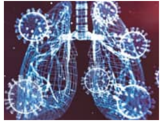
ହସ୍ତିଚାଳରେ ସ୍ଥିତି ଏକକି ହୋଇଥିଲା ଯେ, ଲୋକଙ୍କୁ ଶ୍ଯମାମିଳିବା ସମ୍ଭବ ହୋଇନଥିଲା। ଏହାକୁ ଦୂଷିତ ରଖି ଚୀନ ସରକାର ଜରୁରୀ ସ୍ଥିତି ଘୋଷଣା କରିବା ସହିତ କରୋନା

କୋଭିଡ୍-୨ ରଖାଯାଇଥିଲା ବେଳେ ଯେଉଁ ଆଧାରରେ (ହୁମାନ ରିସେପ୍ଟର) କରୋନା ଭୂତାଣୁ ମଣିଷ ଶରୀରରେ ପ୍ରବେଶ କରେ ଏହାମଧ୍ୟ ଠିକ୍ ସେହି ଆଧାରରେ ମଣିଷକୁ ଫୁଲୁନିତ କରିବାର ସମ୍ଭାବନା ରହିଛି ବୋଲି ବିଜ୍ଞାନିକମାନେ କହିଛନ୍ତି। କରୋନା ଭୂତାଣୁର ହୁମାନ ରିସେପ୍ଟର ସାର୍ବ-କୋଭିଡ୍-୨ ରହିଥିଲା ବେଳେ ଏକେଡିଏ-୨ କୋଭିଡ୍-୨ ଭୂତାଣୁର ମଧ୍ୟ ସମାନ ହୁମାନ ରିସେପ୍ଟର ରହିଥିବା କୁହାଯାଇଛି। କିଛି ମାସ ତଳେ ମଣିଷ ଶରୀରକୁ ଫୁଲୁନିତ ହୋଇପାରେ। ଏହି ଭୂତାଣୁର ନାମ ଏକେଡିଏ-୨