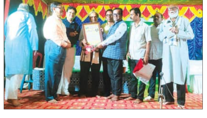
ଓଡ଼ିଆ ଅସ୍ମିତାର ତୀର୍ଥଭୂମି ହେଉଛି ଶ୍ରୀରାମଚନ୍ଦ୍ରପୁର