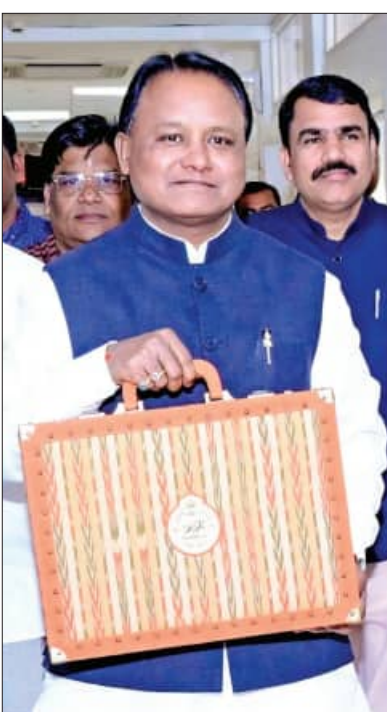
ବିଭାଗ ପାଇଁ ମୋଟ ୧୪ ହଜାର ୭୦୧ କୋଟି ଟଙ୍କା ରହିଛି। ଜଳସେଚନ କାର୍ଯ୍ୟକ୍ରମକୁ ବୃଦ୍ଧୀକୃତ କରାଯିବାରୁ ଯାକ ୨୦୨୫-୨୬ରେ ୨୬୭୬ ଲକ୍ଷ ହେକ୍ଟର ଜମିକୁ ଜଳସେଚନ ଲକ୍ଷ୍ୟ ରଖାଯାଇଥିବା ବେଳେ ଏଥିପାଇଁ ସରକାର ଏକ ମାଷ୍ଟରପ୍ଲାନ ପ୍ରସ୍ତୁତ କରୁଛନ୍ତି।

■ ଭୁବନେଶ୍ୱର, ୧୭ 1୨ (ସମ୍ପାଦକ): ମୁଖ୍ୟମନ୍ତ୍ରୀ ମୋହନ ରଣ ମାଝୀ ୨୦୨୫-୨୬ ଆର୍ଥିକ ବର୍ଷ ପାଇଁ ଆଜି ୨ ଲକ୍ଷ ୯୦ ହଜାର କୋଟି ଟଙ୍କାର ବଜେଟ ଆରତ କରିଛନ୍ତି। ୨୦୨୪-୨୫ରେ ବଜେଟ୍ ଆକାର ୨ ଲକ୍ଷ ୬୫ ହଜାର କୋଟି ଥିବା ବେଳେ ବଜେଟ୍ ଅଧିକ ରାଜ୍ୟ ସରକାର ଅଧିକ ୨୫ ହଜାର କୋଟି ଟଙ୍କା ବୃଦ୍ଧି କରିଛନ୍ତି। ବଜେଟ୍ରେ ମୁଖ୍ୟମନ୍ତ୍ରୀ ମୋହନ ୧୬ଟି ନୂଆ ଯୋଜନା ଘୋଷଣା କରିଛନ୍ତି। ପୁରୁଣା ଯୋଜନା ଏବଂ ନୂଆ ଯୋଜନାକୁ ମିଶାଇ ସରକାରୀ କାର୍ଯ୍ୟକ୍ରମ ବ୍ୟୟ ବାବଦରେ ମୋଟ ୧ ଲକ୍ଷ ୭୦ ହଜାର କୋଟି ଟଙ୍କା ବରାଦ କରାଯାଇଛି। ଯାହା ମୋଟ ବଜେଟ୍ ଆକାରର ୫୮.୬୨ ପ୍ରତିଶତ। ସେହିପରି ପ୍ରଶାସନିକ ବ୍ୟୟ ବାବଦରେ ୧ ଲକ୍ଷ ୮ ହଜାର କୋଟି ଟଙ୍କା ବରାଦ ହୋଇଛି। ତେବେ ବିଜେଡି ସରକାର ନିଜ ଶେଷ ପାଳିର ୨୯୩ ବର୍ଷ ଖୋଲା ବଜାରରୁ ରଣ କରୁନଥିବା ବେଳେ ମୋହନ ସରକାର କିଛି କ୍ରମାଗତ ଦ୍ୱିତୀୟଥର ପାଇଁ ରଣ କରିବାକୁ ନିଷ୍ପତ୍ତି ନେଇଛନ୍ତି। ରାଜ୍ୟ ସରକାର ୨୦୨୫-୨୬ ଆର୍ଥିକ ବର୍ଷ ପାଇଁ ପ୍ରାୟ ୪୬୪୦୦ କୋଟି ଟଙ୍କା ରଣ କରିବାକୁ ଯୋଜନା କରିଛନ୍ତି ଓ ଆର୍ଥିକ ବର୍ଷ ଶେଷ ବେଳକୁ ରାଜ୍ୟର ରଣ ଭାର ୧ ଲକ୍ଷ ୩୪ ହଜାର ୯୧୪ କୋଟିରେ ପହଞ୍ଚିବା ଆକଳନ କରାଯାଇଛି।