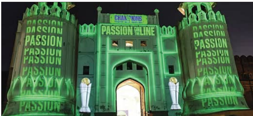
ଚାମ୍ପିଅନ୍ସ ଟ୍ରଫି ଭାରି ସୁସଜ୍ଜିତ ଲହରୀର ଆଲମ୍ପରିରି ଚେନ୍ନୌ

ବୋଲି ସେ ନିଜ ଭାଷଣରେ ଘୋଷଣା କରିଥିଲେ । ଏପର୍ଯ୍ୟନ୍ତ ୪ଟି ଦଳ କରାଚୀରେ ପହଞ୍ଚି ସାରିଛନ୍ତି । ସେହିପରି ଜର୍ମାନୀ ଓ ଅଷ୍ଟ୍ରେଲିଆ ଦଳ ମଙ୍ଗଳବାର ପହଞ୍ଚିବାର କାର୍ଯ୍ୟକ୍ରମ ରହିଛି ସେ ସୂଚନା ଦେଇଥିଲେ । ଏହି ରଙ୍ଗାରଙ୍ଗ ଉତ୍ସବରେ ଚୁର୍ଣ୍ଣାମେଣ୍ଟର ଅଂଶଗ୍ରହଣ କରିବାକୁ ଥିବା ୮ଟି ଦଳର ଅଧିନାୟକ ଉପସ୍ଥିତ ନଥିଲେ । ଫଳରେ ଉତ୍ସବ ସାମାନ୍ୟ ଫିକା ପଡିଯାଇଥିଲା । ଚାମ୍ପିଅନ୍ସ ଟ୍ରଫି ଇତିହାସରେ ବଡ଼ ଉଦ୍‌ଘାଟନା ଉତ୍ସବରେ ପରମ୍ପରା ନ ଥିଲେ ମଧ୍ୟ 'କ୍ୟାପ୍ଟେନ୍ସ ଲଭେସ୍' ଓ ଫଟୋସୁଟ୍‌କୁ ବେଶ୍ ଗୁରୁତ୍ୱ