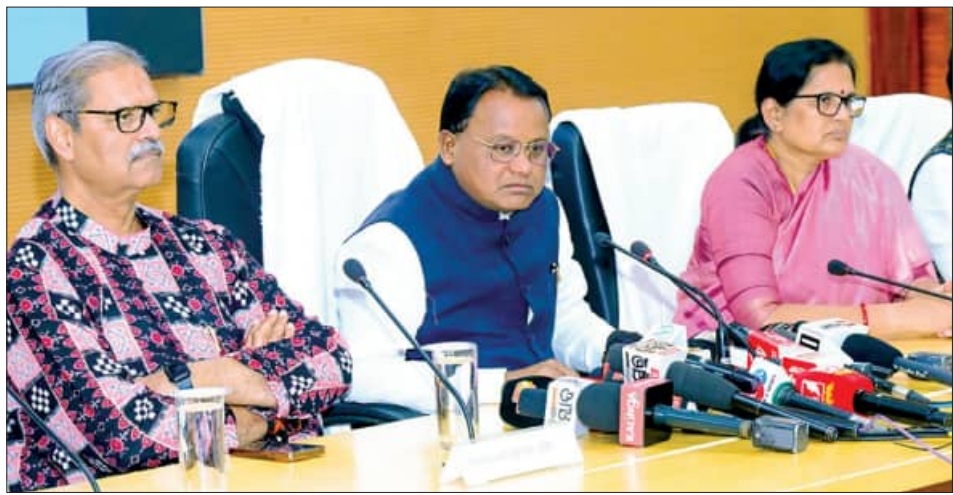
ବଜେଟ ସମ୍ପର୍କରେ ମୁଖ୍ୟମନ୍ତ୍ରୀଙ୍କ ସାମ୍ବାଦିକ ସମ୍ମିଳନୀ, ନିକଟରେ ଦୁଇ ଉପମୁଖ୍ୟମନ୍ତ୍ରୀ କନକ ବର୍ଦ୍ଧନ ସିଂହଦେବ ଓ ପ୍ରଭାତା ପରିଡ଼ା