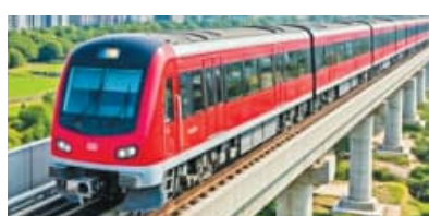
୪ ବର୍ଷରେ ପ୍ରକଳ୍ପ ସାରିବାକୁ ସମୟ ଆଣି କରିଥିଲେ ପୂର୍ବ ସରକାର ବ୍ୟୟବରାଦ କରିବା ପରେ ପ୍ରକଳ୍ପ ଭବିଷ୍ୟତକୁ ନେଇ ଅନିଶ୍ଚିତତା

ବ୍ୟୟବରାଦ କରି ନବୀନ ସରକାର ଉକ୍ତ ପ୍ରକଳ୍ପକୁ ବଳ ଦେଇଥିଲେ। ମାତ୍ର ୨୦୨୫-୨୬ ବର୍ଷ ପାଇଁ ଏହି ପ୍ରକଳ୍ପ ବାବଦକୁ ବ୍ୟୟ ଅଟକଳ ଯଥେଷ୍ଟ ପରିମାଣରେ ହ୍ରାସ କରି ଦିଆଯାଇଛି। ସାଧାରଣ ନିର୍ବାଚନ ଦୃଷ୍ଟିରୁ ଗତବର୍ଷ ଯେଉଁସବୁ ମାସରେ ତତ୍କାଳୀନ ବିଜେଡି ସରକାର ମେଟ୍ରୋ ପ୍ରକଳ୍ପ ପାଇଁ କାମଚଳା ବଜେଟ୍ରେ ୧ ହଜାର କୋଟି ଟଙ୍କା ବ୍ୟୟ