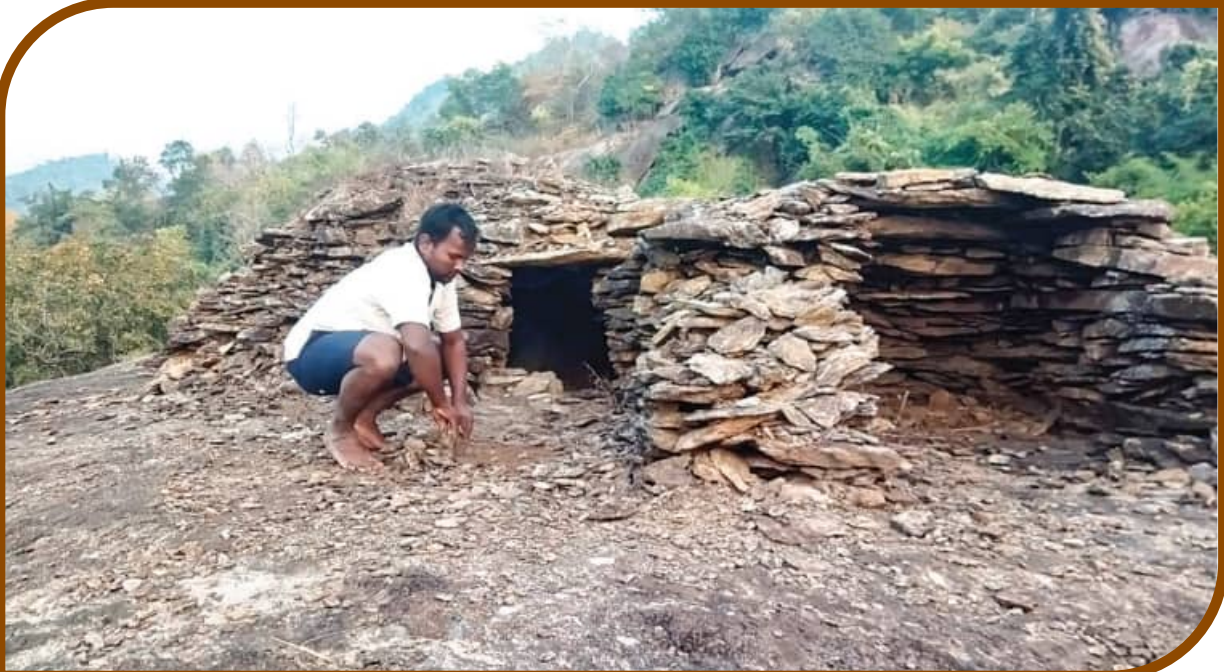
ବୌଦ୍ଧର ଅନନ୍ୟ ପ୍ରାଚୀନ କାର୍ତ୍ତି