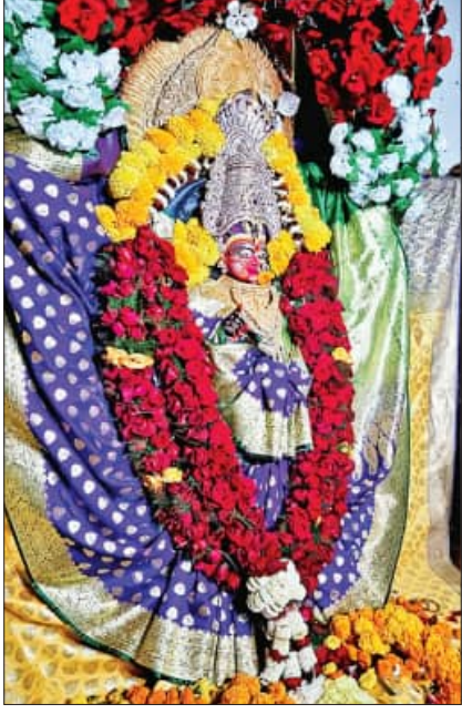
ବଡ଼ପୂଜା, ୧୫୨(ସମ୍ପାଦକ): ଉତ୍ତର ଓଡ଼ିଶାର ପ୍ରସିଦ୍ଧ ତଥା ମୟୂରଭଞ୍ଜ ଜିଲ୍ଲା ବଡ଼ପୂଜା କଉଡ଼ଖଣା ଶାଳ

ଜଙ୍ଗଲ ଓ ଛେଳିଆ ପାଠରେ ପୂଜା ପାଉଥିବା ପ୍ରଦ୍ୟୁଷ ଦେବୀ ମା' ହିଙ୍ଗୁଳାଙ୍କ ବାର୍ଷିକ ବଡ଼ପୂଜା ଶନିବାର ମହାସମାରୋହରେ ଅନୁଷ୍ଠିତ ହୋଇଯାଇଛି। ଏଥିରେ ୮ ଲକ୍ଷରୁ ଊର୍ଦ୍ଧ୍ୱ ଲୋକଙ୍କ ଜନସମାଗମ ହୋଇଥିଲା। ବିଶେଷକରି ବଡ଼ପୂଜା, ଦେଉଳିଆ, ମାଳତୀକନ୍ୟା ଓ ପଲ୍ଲୀ ପର୍ଯ୍ୟନ୍ତ ଲୋକଙ୍କ ଭିଡ଼ ଲାଗି ରହିଛି। ବଡ଼ପୂଜା