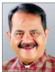
ଗୃହ ବାହାରେ ଖଣ୍ଡନ କଲେ ମନ୍ତ୍ରୀ