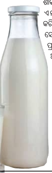
ଚିକେନ୍, ମାଛ ଆଦି ପ୍ରାଣୀ ସ୍ରୋତରୁ