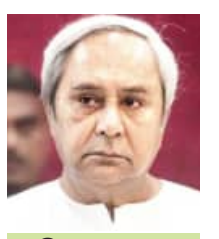
ବିଧାନସଭା ଦଳ ବୈଠକରେ ଅନୁପସ୍ଥିତ