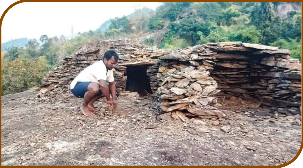
ବୌଦ୍ଧର ଅନନ୍ୟ ପ୍ରାଚୀନ କାର୍ତ୍ତି