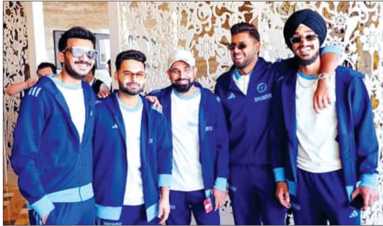
ଦୁବାଇ, ୧୫.୧୨ (ଏକେଡି):

ପାକିସ୍ତାନ ଓ ଦୁବାଇରେ ଖେଳାଯିବାକୁ ଥିବା ଚଳିତ ଫ୍ଲୋରସର ଚାମ୍ପିଅନ୍ ଟ୍ରଫିରେ ଅଂଶଗ୍ରହଣ କରିବା ଲାଗି ଭାରତୀୟ କ୍ରିକେଟ୍ ଦଳ ଶନିବାର ଏଠାରେ ପହଞ୍ଚିଛନ୍ତି। ପୂର୍ବରୁ ଏକ ସତର ବିମାନ ଯୋଗେ ସମସ୍ତ ଖେଳାଳି ଓ ସପୋର୍ଟ ସ୍ଟାଫ୍ ଏକସଙ୍ଗେ ଆସିଛନ୍ତି। ଏହି ସଂସ୍କରଣ ଆୟୋଜନ କରିବାକୁ ପାକିସ୍ତାନ ଅଧିକାରୀ ପାଇଥିଲା। କିନ୍ତୁ ପାକିସ୍ତାନ ଯିବାକୁ ଭାରତ ସରକାର ଅନୁମତି ନ ଦେବାକୁ ହାଇଡ୍ରୋ ମଡେଲରେ ଏହି ରୁଣ୍ଡମେଣ୍ଟ ଆୟୋଜନ କରିବାକୁ ଅନ୍ତର୍ଜାତୀୟ କ୍ରିକେଟ୍ କାଉନ୍ସିଲ୍ ନିଷ୍ପତ୍ତି ନେଇଥିଲା। ଏହା ଫଳରେ ଭାରତ ତାହାର ସମସ୍ତ ମ୍ୟାଚ୍ ଦୁବାଇରେ ଖେଳିବେ। ଏହା ପରେ ଫେବୃଆରୀ ୨୩ ବା ରବିବାର ପାକିସ୍ତାନ ସହ ହାଇଦରାବାଦକୁ ପୁଲ୍‌ବିଲ୍‌ ଅନୁମତି ନ ଦେବାକୁ ହାଇଡ୍ରୋ ମଡେଲରେ ଏହି ରୁଣ୍ଡମେଣ୍ଟ ଆୟୋଜନ କରିବାକୁ ଅନ୍ତର୍ଜାତୀୟ କ୍ରିକେଟ୍ କାଉନ୍ସିଲ୍ ନିଷ୍ପତ୍ତି ନେଇଥିଲା। ଏହା ଫଳରେ ଭାରତ ତାହାର ସମସ୍ତ ମ୍ୟାଚ୍ ଦୁବାଇରେ ଖେଳିବେ। ଏହି ରୁଣ୍ଡମେଣ୍ଟ ଆୟୋଜନ କରିବାକୁ ଅନ୍ତର୍ଜାତୀୟ କ୍ରିକେଟ୍ କାଉନ୍ସିଲ୍ ନିଷ୍ପତ୍ତି ନେଇଥିଲା। ପାକିସ୍ତାନର କରାଚିରେ ପାକିସ୍ତାନ-ଦୁଇଜାତୀୟ ପୁଲ୍‌ବିଲ୍‌କୁ ଏହି ରୁଣ୍ଡମେଣ୍ଟ ଚଳିତମସ ୧୯ରୁ ଆରମ୍ଭ ହେବ। ଦିନିକିଆ ଫର୍ମାଟରେ ଖେଳାଯିବାକୁ ଥିବା