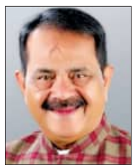
ଗୃହ ବାହାରେ ଖଣ୍ଡନ କଲେ ମନ୍ତ୍ରୀ