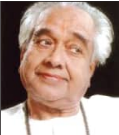
ଶୋକବ୍ୟକ୍ତ କଲେ ମୋହନ ନବୀନ