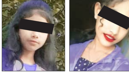
ଉଚ୍ଚସ୍ତରୀୟ ତଦନ୍ତ ପାଇଁ ବିଭିନ୍ନ ସଂଗଠନର ଦାବି

କରାଯାଇ ପ୍ରତ୍ୟେକ ଛାତ୍ରୀଙ୍କୁ ତେଣୁ କରାଯାଇଛି ବୋଲି ସେମାନେ ଅଭିଯୋଗ କରିଛନ୍ତି। ପୂର୍ବରୁ ପୁଲିସ୍ ତାଙ୍କୁ ଏତଲାରେ ଆମୁହତ୍ୟା ବୋଲି ଲେଖିବାକୁ ବାଧ୍ୟ କରିବା, ଯୁବତୀଦ୍ୱୟଙ୍କ ଶରଣରେ ଥିବା ଶତ୍ରୁ ସ୍ଥାନ ଏଫର୍‌କରେ ପୁଲିସ୍ କିଛି ନ କହିବା ଏବଂ ଏବେ ବିକମ୍ପରେ ବ୍ୟବଚ୍ଛେଦ ରିପୋର୍ଟ ଆସିଥିବାରୁ ଏହା ଭିତରେ କିଛି ବଡ଼ ଧରଣର ଶତ୍ରୁମୁଖ କରାଯାଇଥିବା ସେମାନେ ସନ୍ଦେହ କରିଛନ୍ତି। ତେଣୁ ଏହାର ଉଚ୍ଚସ୍ତରୀୟ ତଦନ୍ତ କରି ଉଚିତ୍ ନ୍ୟାୟ ପ୍ରଦାନ କରିବାକୁ ସେମାନେ ଦାବି କରିଛନ୍ତି। ସେମାନେ ଆହୁରି କହିଛନ୍ତି ଯେ ଏତେ ଛୋଟ ପିଲାଦ୍ୱୟ କେମିତି ଗୋଟିଏ ତାଳକ୍ଷ୍ମୀ ପାଖାପାଖି ଆତ୍ମହତ୍ୟା କଲେ, ଏହା ସମ୍ଭବ କାରଣ କ'ଣ, ଘଟଣାସ୍ଥଳକୁ ନିର୍ଦ୍ଦିଷ୍ଟ ମୋବାଇଲ୍‌ନମ୍ବର କ'ଣ ତଥ୍ୟ ମିଳିଲା; ସେସବୁ ମଧ୍ୟ ପୁଲିସ୍ ସ୍ପଷ୍ଟ କରୁ। ସେହିପରି ଜିଲ୍ଲାର ବିଭିନ୍ନ ସଙ୍ଗଠନ ଏବଂ ବୁଦ୍ଧିଜୀବୀମାନେ ଏହାର ଉଚ୍ଚସ୍ତରୀୟ ତଦନ୍ତ ହେଲେ ସତ୍ୟ ଘଟଣା ପଦାକୁ ଆସିବ ବୋଲି କହିବା ସହ ଆଗାମୀ ଦିନରେ ଘଟଣାକୁ ନେଇ ଉପରିସ୍ଥ ଅଧିକାରୀଙ୍କୁ ଭେଟି ସଠିକ୍‌ତଦନ୍ତ ପାଇଁ ଦାବି କରିବାକୁ ବୋଲି କହିଛନ୍ତି।