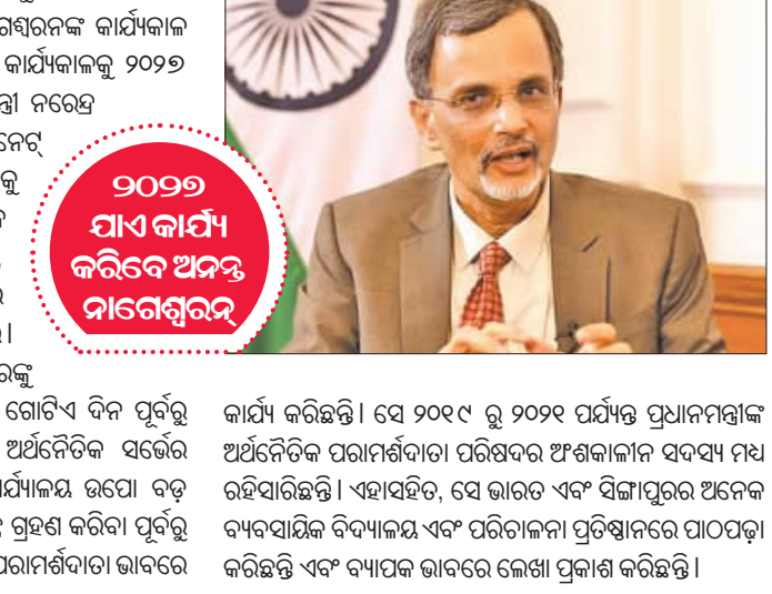
୨୦୨୭ ପାଏ କାର୍ଯ୍ୟ କରିବେ ଅନନ୍ତ ନାଗେଶ୍ୱରନ

ନୂଆଦିଲ୍ଲୀ, ୨୦୧୯ (ଏକେଡି): ଦେଶର ମୁଖ୍ୟ ଅର୍ଥନୈତିକ ପରାମର୍ଶଦାତା (ସିଏବି) ଭି ଅନନ୍ତ ନାଗେଶ୍ୱରନଙ୍କ କାର୍ଯ୍ୟକାଳ ବୃଦ୍ଧି ହୋଇଛି। କେନ୍ଦ୍ର ସରକାର ତାଙ୍କର କାର୍ଯ୍ୟକାଳକୁ ୨୦୨୭ ମାର୍ଚ୍ଚ ପର୍ଯ୍ୟନ୍ତ ବୃଦ୍ଧି କରିଛନ୍ତି। ପ୍ରଧାନମନ୍ତ୍ରୀ ନରେନ୍ଦ୍ର ମୋଦିଙ୍କ ଅଧିକାରରେ ଅନୁଷ୍ଠିତ କ୍ୟାବିନେଟ୍ ନିର୍ଦ୍ଦିଷ୍ଟ କମିଟି ନାଗେଶ୍ୱରନଙ୍କ କାର୍ଯ୍ୟକାଳକୁ ଆଉ ୨ ବର୍ଷ ପର୍ଯ୍ୟନ୍ତ ବୃଦ୍ଧିକୁ ଅନୁମୋଦନ ଦେଇଛନ୍ତି। ଏଠାରେ ସୂଚନାଯୋଗ୍ୟ ଯେ, ଶ୍ରୀ ନାଗେଶ୍ୱରନ ୨୦୨୨ ଜାନୁଆରୀ ୨୮ ରେ ସିଏବି ଭାବରେ ଦାୟିତ୍ୱ ଗ୍ରହଣ କରିଥିଲେ। ବିଭିନ୍ନ ଆର୍ଥିକ ନୀତି ଉପରେ ସରକାରଙ୍କୁ ପରାମର୍ଶ ଦେବା ଏବଂ କେନ୍ଦ୍ର ବଜେଟ୍‌ର ଗୋଟିଏ ଦିନ ପୂର୍ବରୁ ସଂସଦରେ ଉପସ୍ଥାପିତ ହେବାକୁ ଥିବା ଅର୍ଥନୈତିକ ସର୍ତ୍ତରେ ତିନି ପ୍ରସ୍ତୁତ କରିବା ପାଇଁ ସିଏବିଙ୍କ କାର୍ଯ୍ୟକାଳ ଉପରେ ବଡ଼ ଦାୟିତ୍ୱ ରହିଥାଏ। ସିଏବି ଭାବରେ ଦାୟିତ୍ୱ ଗ୍ରହଣ କରିବା ପୂର୍ବରୁ ନାଗେଶ୍ୱରନ କଣ୍ଠେ ଲେଖକ, ଶିକ୍ଷକ ଏବଂ ପରାମର୍ଶଦାତା ଭାବରେ