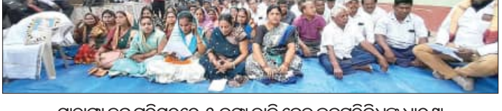
ମାହାଙ୍ଗା ବୁକ୍ ପରିସରରେ ୫ ଦମ୍ପା ଦାବି ନେଇ ଜନପ୍ରତିନିଧିଙ୍କ ଧାରଣା