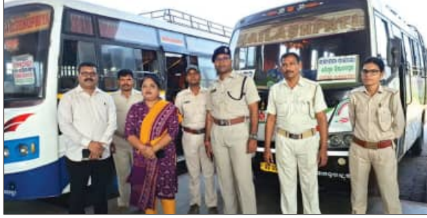
ହେଉଥିବା ବିଭିନ୍ନ ରୁଟ୍‌ରୁ ୨୦ରୁ ଅଧିକ ବସ୍ ଉପରେ ନକର ରଖିଥିଲେ । ପ୍ରଥମେ ଆସୁଥିବା ମହିଳା ଯାତ୍ରାଙ୍କ ପ୍ରତି ବସ୍ କର୍ମଚାରୀଙ୍କ କିଭଳି ବ୍ୟବହାର ରହୁଛି, ତାହା ଦେଖିଥିଲେ । ଏହାସହ କର୍ମଚାରୀରେ ଥିବା ଅନେକ ମହିଳା

ଯାତ୍ରାକଠାରୁ ଏ ଫ୍ଳାଗ୍‌ରେ ପତାରି ବୁଝିଥିଲେ । ମୋଟର ଯାନ ଆଇନ ଅନୁଯାୟୀ, ଯାତ୍ରାଙ୍କ ମଧ୍ୟରେ ପାତରଅନ୍ତର କରାଯିବା ଦଣ୍ଡନୀୟ ଅପରାଧ । ଏଥିପାଇଁ ନିୟମାବଳୀରେ