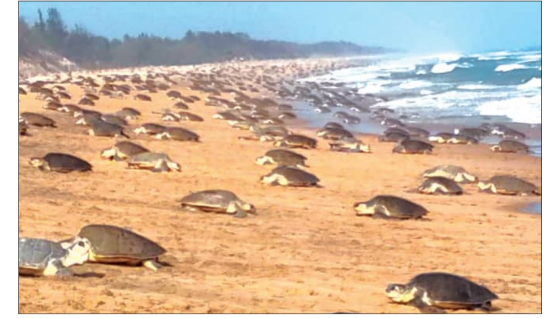
ଗଞ୍ଜାମ ବ୍ଲକ୍ ଅନ୍ତର୍ଗତ ପୋଡ଼ାପାଟଣା ଗ୍ରାମଠାରୁ ବଟେଶ୍ୱର ମନ୍ଦିର ନିକଟ ସମୁଦ୍ର କୋଳକୁମ୍ଭରେ ଅଲିଭ୍ ରିଡ୍‌ଲେକ୍ ଗଣ ଅଣ୍ଡାଧାନ