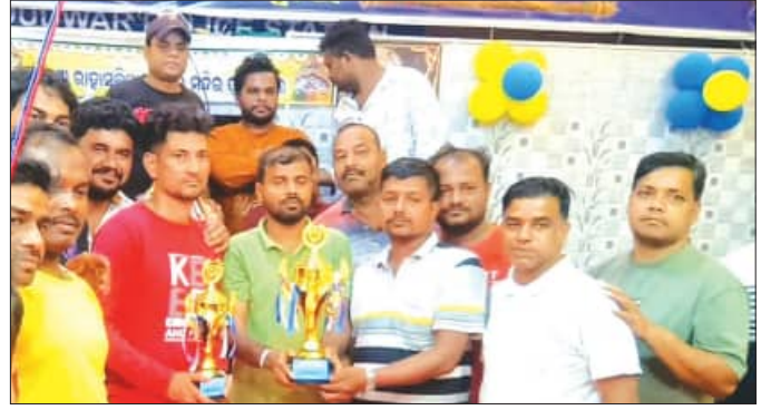
ଚାମ୍ପିଅନ ଯୋଗିକୁ ୫ହଜାର ଟଙ୍କା ଅର୍ଥ ଯୋଗିକୁ ୩ ହଜାର ଟଙ୍କା ଓ ଚାମ୍ପି ପ୍ରଦାନ ରାଶି ସହିତ ଚାମ୍ପିଅନ ଚାମ୍ପି ଓ ରନର୍ସ ଅପ୍ କରିଥିଲେ ।

ଚୌଦ୍ୱାର, ୧୮/୧୨ (ସମିଧ) : ଚୌଦ୍ୱାର ଚୌରପାଳିକା ୪୯୯ ଓଡ଼ିଆ ଶ୍ରୀ ଶ୍ରୀ ରାହାସ ବିହାରୀକାୟା ଯୁବକ ଫାପ ଆନୁକୁଲ୍ୟରେ ଆୟୋଜିତ ୫ମ ବାର୍ଷିକ କ୍ୟାମ୍ପ ଟୁର୍ଣ୍ଣାମେଣ୍ଟ ଉଦ୍‌ଯାପିତ ହୋଇଯାଇଛି ।