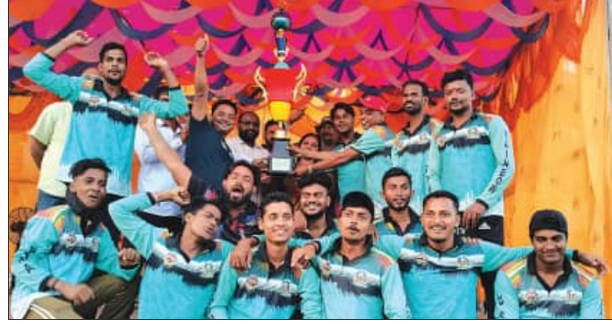
କଣ୍ଠାପଡ଼ା, ୧୮/୧୨ (ସମିଧ) : ନାହାଳପୁର ମେମୋରିଆଲ କ୍ରିକେଟ ଟୁର୍ଣ୍ଣାମେଣ୍ଟ ଆଜି ଉଦ୍‌ଯାପିତ ହୋଇଯାଇଛି ।

ଉତ୍ସୁକା କ୍ରିକେଟ ଟିମ ମଧ୍ୟରେ ଅନୁଷ୍ଠିତ ହୋଇଥିଲା । ୧୫ ଓଭର ବିଶିଷ୍ଟ ଏହି ମ୍ୟାଚ୍‌ରେ ଟପ୍ ଜିଟି ଦକ୍ଷିଣ ଉତ୍ତମୀ ଦଳ ପ୍ରଥମେ ବ୍ୟାଟିଂ କରି ୧୪୮ ରନ କରିଥିଲା ।