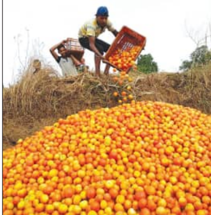
କେବଳ ଆଗଲପୁର ବ୍ଲକ୍, ଜିଲ୍ଲାର ପ୍ରାୟ ସମସ୍ତ ବ୍ଲକ୍‌ରେ ଉଣାଅଧିକ ଟମାଟୋ ଚାଷ ହୋଇଛି । ବିଭାଗୀୟ ସୂଚନା ଅନୁସାରେ ରବି ସମୟରେ ପ୍ରାୟତଃ ଚାଷୀମାନେ ଟମାଟୋ ଚାଷ କରିଥାନ୍ତି । ନଭେମ୍ବର, ଡିସେମ୍ବରରେ ଟମାଟୋ ଚାଷ ଆରମ୍ଭ ହୋଇଥିବା ବେଳେ ବର୍ତ୍ତମାନ ସମୟରେ ଟମାଟୋ ଅମଳ ହୋଇଥାଏ । ଜିଲ୍ଲାର

ବଲାଙ୍ଗିର, ୧୮/୨ (ସମ୍ପାଦକ): ରାଜ୍ୟର ଗରିବ ଚାଷୀଙ୍କ ଅର୍ଥନୀତି ସୁଦୃଢ଼ କରିବାର ପ୍ରତିଶ୍ରୁତି ଦେଇ କ୍ଷମତାକୁ ଆସିଥିବା ବିଜେପି ସରକାରର ଅସଲ ଚେହେରା ପଦାରେ ପଡ଼ିଛି । ଆରମ୍ଭରୁ ରାଜ୍ୟ ସରକାର ପରିପରିବା ଚାଷୀମାନଙ୍କ ଅମଳ ପରିବା ସଂରକ୍ଷଣ ଓ ବଜାର ବ୍ୟବସ୍ଥା କଥା କହୁଥିବା ବେଳେ ଆଜି ଯାଏଁ କିଛି ବ୍ୟବସ୍ଥା ହୋଇନାହିଁ । ଉପମୁଖ୍ୟମନ୍ତ୍ରୀ ଓ ସାହାଯ୍ୟ ମନ୍ତ୍ରୀଙ୍କ ଲିଲ୍ଲାରେ ଚାଷୀ ଅଭାବୀ ବିକ୍ରିର ଶିକାର ହେବା ଏହାର କୁଳତ ପ୍ରମାଣ ବୋଲି ଚାଷୀମହଲରେ ଅଭିଯୋଗ ହୋଇଛି । ବଲାଙ୍ଗିରରେ ଏବେ ଟମାଟୋ ଚାଷୀ ନାକରେ କାନ୍ଥୁଛନ୍ତି । କେଜି ପ୍ରତି ଟମାଟୋ ଦର ଏକ ଟଙ୍କାକୁ ଖସିଥିବା ବେଳେ ବାଧ୍ୟ ହୋଇ ଚାଷୀ ଜମିରେ ଟମାଟୋ ପରିବା ପାଇଁ ବାଡ଼ି ଦେଇଥିବା ଦେଖିବାକୁ ମିଳିଛି । ଏପରିକି, ଟମାଟୋ ଦରକୁ ଦେଖିଲେ, ତୋଳିବାର ନିୟୋଜିତ ଶ୍ରମିକଙ୍କ ପାଉଣା ବି ସେଥିରୁ ବାହାରୁନାହିଁ । ଫଳରେ ଚାଷୀର ଚିନ୍ତା ବଢ଼ିଛି । ଅଣସଫଳ ସମୟରେ ରାଜ୍ୟରେ ୭୦ରୁ ୮୦ ଟଙ୍କାରେ ବିକ୍ରି ହେଉଥିବା ଟମାଟୋ କେଜି ଏବେ ୧୦ଟିଏରୁ ବି କମରେ ଚାଷୀ ବିକିବାକୁ ବାଧ୍ୟ ହେଉଛି । ବର୍ତ୍ତମାନ ବଲାଙ୍ଗିର ଜିଲ୍ଲାରେ ଟମାଟୋକୁ ନେଇ ଏକ ଅଭାବୀ ବିକ୍ରି ପରିସ୍ଥିତି ସୃଷ୍ଟି ହୋଇଛି । ଜିଲ୍ଲାର ଆଗଲପୁର ବ୍ଲକ୍‌ରୁ ଆସିଥିବା ଚିତ୍ର ସମସ୍ତଙ୍କୁ ଦେଖି କିଛି ମାସ ପୂର୍ବରୁ ଯେଉଁ ଟମାଟୋ ଦର ବଜାରରେ ୩୦ରୁ ୪୦ ଟଙ୍କା ଥିଲା, ତାହାର ଦର ଆଜି କେଜି ପ୍ରତି ୧ ଟଙ୍କାରେ ପହଞ୍ଚିଛି । ଏହି ବ୍ଲକ୍‌ର ରୋଡ, ଫଟାମୁଣ୍ଡା, ଉପରବାହାଲ, ନଅଗାଁ(କ) ଅଞ୍ଚଳରେ ବହୁ ପରିମାଣର ଟମାଟୋ ଚାଷ ହୋଇଥାଏ । ଗତ କିଛି ଦିନ ହେଲା ଟମାଟୋ ଦର ହ୍ରାସ ପାଇଥିବା ବେଳେ ଚାଷୀଙ୍କ ପାଖରୁ ଦେପାରାମାନେ କେରେଟ୍ ଅର୍ଥାତ୍ ୨-୫ କେଜିକୁ ୨୦ରୁ ୨୫ ଟଙ୍କା ଦେଇ କିଣୁଥିବା ଅଭିଯୋଗ ହୋଇଛି । ବଜାରରେ ଦର ମଧ୍ୟ କମିଛି ସତ, କିନ୍ତୁ ଏହାଦ୍ୱାରା ଚାଷୀଙ୍କ ମୂଳ ବି ଉଠୁନାହିଁ ।