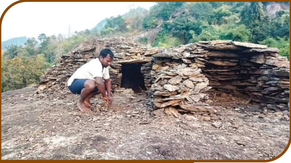
ବୌଦ୍ଧର ଅନନ୍ୟ ପ୍ରାଚୀନ କାର୍ତ୍ତି