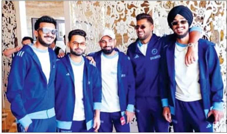
ଦୁବାଇ, ୧୫.୧୨ (ଏକେଡି):

ପାକିସ୍ତାନ ଓ ଦୁବାଇରେ ଖେଳାଯିବାକୁ ଥିବା ଚଳିତ ଫ୍ଲୋରୀସ୍‌ରେ ଚାମ୍ପିଅନ୍ ଟ୍ରଫିରେ ଅଂଶଗ୍ରହଣ କରିବା ଲାଗି ଭାରତୀୟ କ୍ରିକେଟ୍ ଦଳ ଶନିବାର ଏଠାରେ ପହଞ୍ଚିଛନ୍ତି। ପୂର୍ବରୁ ଏକ ସତର ବିମାନ ଯୋଗେ ସମସ୍ତ ଖେଳାଳି ଓ ସପୋର୍ଟ ସ୍ଟାଫ୍ ଏକସଙ୍ଗେ ଆସିଛନ୍ତି। ଏହି ସଂସ୍କରଣ ଆୟୋଜନ କରିବାକୁ ନିଷ୍ପତ୍ତି ହୋଇଥିଲା। ପାକିସ୍ତାନର ଅଧିକାରୀ ପାଇଥିଲା କିନ୍ତୁ ପାକିସ୍ତାନ ଯିବାକୁ ଭାରତ ସରକାର ଅନୁମତି ନ ଦେବାକୁ ହାଇଡ୍ରୋ ମଡେଲରେ ଏହି ଦୁର୍ଘଟଣା ଆୟୋଜନ କରିବାକୁ ଅନୁମତି ଦେଇଛନ୍ତି। କୋଭିଡ୍-୧୯ ନିୟମିତ ନିୟମ ଅନୁଯାୟୀ ଗୁପ୍ ପର୍ଯ୍ୟାୟ ମ୍ୟାଚ୍ ଗୁଡିକ ରାଉଣ୍ଡ ରବିନ ଫର୍ମାଟରେ ଖେଳାଯିବ। ପ୍ରତ୍ୟେକ ପାକିସ୍ତାନ-ଫ୍ଲୋରୀସ୍ ମ୍ୟାଚ୍ ପାଇଁ ଏହି ଦୁର୍ଘଟଣା ଚଳିତମସ ୧୯ରୁ ଆରମ୍ଭ ହେବ। ଦିନିକିଆ ଫର୍ମାଟରେ ଖେଳାଯିବାକୁ ଥିବା