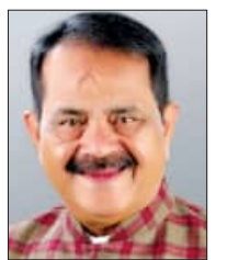
ଗୃହ ବାହାରେ ଖଣ୍ଡନ କଲେ ମନ୍ତ୍ରୀ