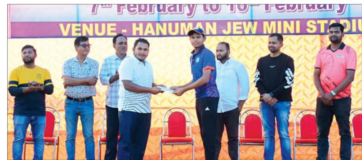
ବନ୍ଧୁ/ଆଗରପଡ଼ା, ୧୫.୧୨ (ସମିତ):

କଟକର ଯୁନିଅନ ସ୍କୋର୍ ଓ ଗୁଡ଼ାଓର୍ ସାପିଏନ୍ସ ଟିମ୍ ମଧ୍ୟରେ ୨୯ତମ ଟିଲୋ କସ୍ କ୍ରିକେଟ୍ ଦୁର୍ଦ୍ଦିନେଶ୍ୱର ଫାଇନାଲ ମୁକାବିଲା ଖେଳାଯିବ।