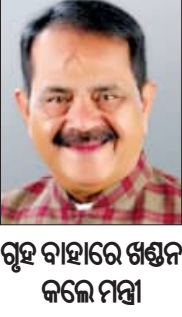
ଗୃହ ବାହାରେ ଖଣ୍ଡନ କଲେ ମନ୍ତ୍ରୀ