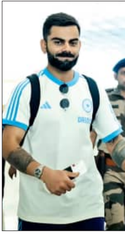
ଦୁବାଇ, ୧୫.୧୨ (ଏକ୍ସପ୍ରେସ୍):

ପାକିସ୍ତାନ ଓ ଦୁବାଇରେ ଖେଳାଯିବାକୁ ଥିବା ଚଳିତ ଫାସ୍ତରଗର ଚାମ୍ପିଅନ୍ ଟ୍ରଫିରେ ଅଂଶଗ୍ରହଣ କରିବା ଲାଗି ଭାରତୀୟ କ୍ରିକେଟ ଦଳ ଶନିବାର ଏଠାରେ ପହଞ୍ଚିଛନ୍ତି।