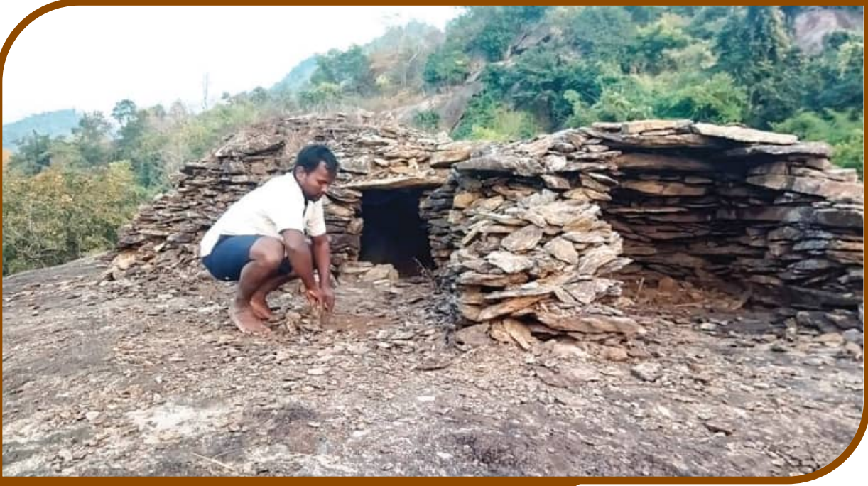
ବୌଦ୍ଧର ଅନନ୍ୟ ପ୍ରାଚୀନ କାର୍ତ୍ତି

ଅନ୍ତର୍ଗତ ହତୁଙ୍ଗ ପଞ୍ଚାୟତର ନେତୃସାହି ଓ ଝାରଖମଣ ରାଜ୍ୟ ଗ୍ରାମର ମଧ୍ୟଭାଗରେ ରହିଛି ଯୋଗା ମୁଣ୍ଡିଆ। ସେଇଠି ଦୁଇଟି ମୁନିରଖିକ ଗୁମ୍ଫା ସହ ଏକ ଯଜ୍ଞ କୁଣ୍ଡ ରହିଛି। ସ୍ଥାନୀୟ ଲୋକଙ୍କ କହିବା ଅନୁସାରେ ଖ୍ରୀଷ୍ଟାଦ ଅଷ୍ଟାଦଶ ଶତାବ୍ଦୀର ମଧ୍ୟ ଭାଗରୁ ଶେଷ ଭାଗ ମଧ୍ୟରେ ଏହି ପାହାଡ଼ରେ ମୁନିରଖି ଗଣ ପ୍ରସ୍ତରରେ ନିଜର ପଥର ଗୁମ୍ଫା ନିର୍ମାଣ କରି ଜଗତ କଲ୍ୟାଣ ପାଇଁ କଠୋର ତପସ୍ୟା ଓ ସାଧନା କରୁଥିଲେ। ଯାହାପାଇଁ ସେହି ଅଞ୍ଚଳରେ ବେଦମନ୍ତ୍ର ଗୁଞ୍ଜାରିତ ହେଉଥିଲା। ସେମାନେ ନିଜର କ୍ଷୁଧାମେଣ୍ଡାଇବା ପାଇଁ ସ୍ଥାନୀୟ ଜଙ୍ଗଲରୁ ଫଳମୂଳ ଫଗୁଣ କରି ଖାଉଥିଲେ ଓ ସତେବେଳେ ତୃଷ୍ଣା ମେଣ୍ଡାଇବା ନିମନ୍ତେ ଏକ କୂପା ମଧ୍ୟ ଖନନ କରିଥିଲେ ଯାହା ଆଜି ବିଜ୍ଞାନ ମତରେ ଭୁଲକମ୍ପ ଓ ସାମାଜିକ ଏବଂ ଧାର୍ମିକ ମତରେ ମାତା ବା ଅଶୈବ ହେଉଥିବାରୁ ତାହା ପତନ ହୋଇଯାଇଛି। ତେବେ ସମୟାନୁକ୍ରମେ ସେହି ରଖିମୁନି ମାନେ କୁଆଡ଼େ ଅତ୍ୟୁକ୍ତି ହେଉଯାଇଛି। କିଛି ଲୋକଙ୍କ କହିବା ଅନୁସାରେ ଏହି ପାହାଡ଼ରେ ଚାରିଜଣ ରଖି ରହୁଥିଲେ ଏବଂ ଆଉ କେହିକେହି କୁହନ୍ତି ଯେ ଜଣେ ରଖି ଓ ତାଙ୍କ ଭଉଣୀ ମିଶି ରହୁଥିଲେ। ରଖି ଜଣକ ତଳ ଗୁମ୍ଫାରେ ବିଶ୍ରାମ କରୁଥିବା ବେଳେ ରଖିକ ଭଉଣୀ ଉପର ଗୁମ୍ଫାରେ ବିଶ୍ରାମ କରୁଥିଲେ। ସମୟର ଅବର୍ତ୍ତନରେ ସେହି ମୁନିରଖିକ ଆକ୍ରମଣ ପରେ ଉନ୍ନତ ଶତାବ୍ଦୀର ପ୍ରଥମ ଭାଗରେ ଝାରଖମଣ ଗ୍ରାମର ତତ୍କାଳୀନ ଗଡ଼ଜାତ ରାଜ୍ୟ ମଲ୍ଲିକ ଜଣେ ଧାର୍ମିକ ବ୍ୟକ୍ତି ଓ ବାବା ଅଭିରାମ ପରମ ହଂସଳ ପରମ ଭକ୍ତ ଥିଲେ। ସେତେବେଳେ ପ୍ରତିବର୍ଷ ଅକାଳ ମରୁତ ପଡ଼ୁଥିବାରୁ ସେ କିଛିଲୋକଙ୍କୁ ନେଇ ଏହି ଯୋଗା ମୁଣ୍ଡିଆର ପାହାଡ଼ ଗୁମ୍ଫାରେ ଲହୁଣୀ ଆରମ୍ଭ କରିଥିଲେ। କିଛି ବର୍ଷ ଲହୁଣୀ ଲାଗାପରେ ଉନ୍ନତ ଶତାବ୍ଦୀର ମଧ୍ୟ ଭାଗ ପାଖାପାଖି ତାଙ୍କ ଦେହାନ୍ତ ହେଲା। ତାପରେ ଏହି ଲହୁଣୀ ପୂଜା କିଛି ବର୍ଷ ପାଇଁ ବନ୍ଦ ରହିଲା। ପରବର୍ତ୍ତୀ ସମୟରେ ତାଙ୍କର ପର