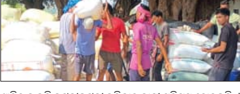
ଖାତିର ନ କରି କଟକ-ନିକଟରେ ଧାନ ସଂଗ୍ରହ ହୋଇଛି । କଳାହାଣ୍ଡି ଜିଲ୍ଲାରେ ନଭେମ୍ବର ୨୯ ତାରିଖରୁ ଖରିଫ ଧାନ ସଂଗ୍ରହ ପ୍ରକ୍ରିୟା ଆରମ୍ଭ ହୋଇଥିଲେ ହେଁ ବାସ୍ତବରେ ଏହା ବିସ୍ତରଣ ପ୍ରାପ୍ତ ହୋଇଛି । ଚଳିତ ବର୍ଷ ଧାନ ପୁରଣ ହୋଇଛି । ଚଳିତ ବର୍ଷ ଧାନ ପୁରଣ ହୋଇଛି । ଚଳିତ ବର୍ଷ ଧାନ ପୁରଣ ହୋଇଛି ।

ଭବାନୀପାଟଣା, ୧୩/୨ (ସମ୍ବିଧ): କଳାହାଣ୍ଡି ଜିଲ୍ଲାରେ ଚଳିତ ଖରିଫ ଧାନ ସଂଗ୍ରହ କାର୍ଯ୍ୟ ସରିଛି । ଏଥିରେ ଚାଷୀଙ୍କୁ ସରକାର ୮୦୦ ଟଙ୍କା ଇନ୍-ପୁର୍ଟ୍ ସବସିଡି ଦେବାକୁ ଘୋଷଣା ହେବାରୁ ଧାନ ପୁରଣ ହୋଇଛି । ପ୍ରାୟ ୧୧ ଲକ୍ଷ ମଣ୍ଡି ଧାନ ପୁରଣ ହୋଇଛି ।