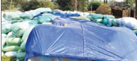
ହଜାର ଗଣ୍ୟା ଜଣ ଚାଷୀ ୧୪୧୧୦୦୯.୮୬ ଟଙ୍କା ଧାନ ବିକି କରିଛନ୍ତି । କିନ୍ତୁ ବ୍ୟାପକ ଅବ୍ୟବସ୍ଥା ଏବଂ ବେପାରୀ ଓ ମିଲରଙ୍କ ଲାଭଖୋର ମନୋବୃତ୍ତି ଯୋଗୁଁ ଧାନକିଣାରେ କେନ୍ଦ୍ରାପଡ଼ା ବହୁ ପଛରେ ପଡ଼ିଛି । ଅପରପକ୍ଷେ, କେନ୍ଦ୍ରାପଡ଼ାରେ ଧାନକିଣାରେ ବ୍ୟାପକ

କେନ୍ଦ୍ରାପଡ଼ା, ୧୩/୨ (ସମ୍ବିଧ): ଧାନକିଣାକୁ ନେଇ ରାଜ୍ୟବ୍ୟାପୀ ଗୋଟିଏ ପରେ ଗୋଟିଏ ଅବ୍ୟବସ୍ଥା ସାମ୍ନାକୁ ଆସୁଥିବା ବେଳେ କେନ୍ଦ୍ରାପଡ଼ା ଜିଲ୍ଲାରେ ଏହା ସବୁ ସୀମା ସରହ ପାରୁ ନାହିଁ । ଚାଷୀଙ୍କ ଟୋକନରେ ବେପାରୀ ଧାନ କିଣି ମାଲିକାନା ହେବା, ପ୍ରକୃତ ଚାଷୀ ଏହାଧିକାରୀ ନୁହେଁ, ମିଲର ଓ ପ୍ରଶାସନିକ ଅଧିକାରୀଙ୍କ ମଧ୍ୟରେ ମଧ୍ୟସ୍ତରୀୟ, ବ୍ୟାପକ କଟନା-ଛଟନା ଭଳି ଯାବତୀୟ କେଳେକାରୋ-ଦୁର୍ନୀତି-ଅବ୍ୟବସ୍ଥା ଜିଲ୍ଲାରେ ଦେଖିବାକୁ ମିଳିଛି । ଖାଲି ସେତିକି ନୁହେଁ, ଧାନ ବିକ୍ରି ଅବଧିକୁ ଆଉ ପାଖାପାଖି ଦେଖିବାକୁ ମିଳୁଛି । ଏହା ବ୍ୟତୀତ ଧାନ ବିକ୍ରି ପାଇଁ ନୌ ପଞ୍ଜୀକରଣ କରିଛନ୍ତି । ଏଥିରେ ଜିଲ୍ଲାରୁ ୧୧୬ ଯାକ ମାଧ୍ୟମରେ ୮ ଲକ୍ଷ ୫୩ ହଜାର କିଣାଯାଇ ଧାନ କିଣିବାକୁ ସରକାର ଚାରେନ୍ଦ୍ର ରଖିଛନ୍ତି । କିନ୍ତୁ ଏହା ମାତ୍ର ୧୪ ହଜାର ୮୨୪୫ ଟଙ୍କା ଚାଷୀ ୫୫୫୫ ୫୫୫୫ ୫୫୫୫ ଧାନ ବିକ୍ରି କରିଛନ୍ତି । ଅର୍ଥାତ୍ ପଞ୍ଜୀକୃତ ଚାଷୀଙ୍କ ମଧ୍ୟରୁ