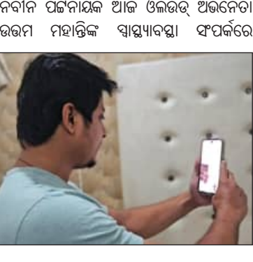
ଭୁବନେଶ୍ୱର, ୧୩/୨ (ସମ୍ବିଧ): ବିଜେଡି ସୁପ୍ରିମୋ ନବାନ ପଟ୍ଟନାୟକ ଆଜି ଓଲିଉଡ଼ ଅଭିନେତା ଉତ୍ତମ ମହାନ୍ତିଙ୍କ ସ୍ୱାସ୍ଥ୍ୟାବସ୍ଥା ସଂପର୍କରେ