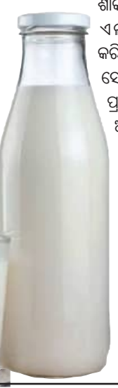
ଚିକେନ୍, ମାଛ ଆଦି ପ୍ରାଣୀ ସ୍ତ୍ରୋତରୁ