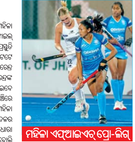
ମହିଳା ଏସିଆଲ୍ ଏବଂ ପ୍ରୋ-ଲିଗ୍

ସ୍ଥାନୀୟ କଳିଙ୍ଗ ଷ୍ଟାଡିୟମ୍ରେ ଶନିବାରଠାରୁ ମହିଳା ପ୍ରୋ-ଲିଗ୍ ଆରମ୍ଭ ହେବ। ଏହି ହାଇପ୍ରୋଫାଇଲ ଚୁର୍ଣ୍ଣାମେଣ୍ଟ ଲାଗି ଭାରତୀୟ ଦଳ ବେଶ ପ୍ରସ୍ତୁତି କରିଛି। ଅଲ୍ଟିମ ପୁରସ୍କାର ବିଜେତା ସଲିମା ଟେଟେ ଦଳର ନେତୃତ୍ୱ ନେଉଥିଲେବେଳେ ପ୍ରତିଷ୍ଠିତ ହେଉଥିବା ଦିଲ୍ଲୀ କ୍ୟାପିଟାଲ୍ସ ଦଳରେ ଅଧିକ ସଫର୍ଯ୍ୟ ଦେଖିବାକୁ ସମର୍ଥକଙ୍କୁ ଆଶା ରଖିଛି। ବିଶେଷ କରି ଗାଁରେ ଗତବର୍ଷ ଅନୁଷ୍ଠିତ ଏସିଆନ୍ ଚାମ୍ପିଅନ୍ସ ଟ୍ରଫି ମହିଳା ହକିରେ ଚାମ୍ପିଅନ୍ ହେବା ପରେ ମାଉସାମୀ ଦଳର ଆତ୍ମବିଶ୍ୱାସ ଛେଦ ବୃଦ୍ଧି ପାଇଛି ଓ ଏହି ବିଜୟଯାଗା ଏସିଆଲ୍ ଏବଂ ପ୍ରୋ ଲିଗ୍ରେ ବଜାୟ ରଖିବା ବୋଲି ଆଶା ରଖିଛି। କିନ୍ତୁ ସବୁଠୁ ଅଧିକ ଭରସା ହେଉଛି ସ୍ଥାନୀୟ ଦର୍ଶକ। ଅନ୍ୟ ଯେ କୌଣସି ଷ୍ଟାଡିୟମ୍ ଅପେକ୍ଷା କଳିଙ୍ଗର ଦର୍ଶକ ଓ ସମର୍ଥକଙ୍କ ସ୍ଥାନ ଆମ ଲାଗି ଶ୍ରେଣୀ। ଏମାନଙ୍କ ଉତ୍ସାହ ଓ ସମର୍ଥନ ବଳରେ ଏଠାରେ ଆମେ ଅଧିକ ସଫଳ ହେବୁ ବୋଲି ଭଲ ଭାବେ ଭାବିଛୁ।