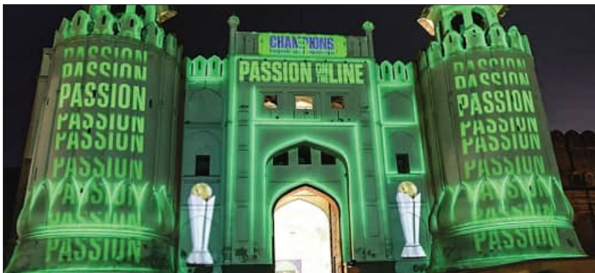
ଚାମ୍ପିଅନ୍ସ ଟ୍ରଫି ଭାରି ସୁସଜ୍ଜିତ ଲହରୀର ଆଲମ୍ପରିରି ଚେନ୍

ବୋଲି ସେ ନିଜ ଭାଷଣରେ ଘୋଷଣା କରିଥିଲେ । ଏପର୍ଯ୍ୟନ୍ତ ୪ଟି ଦଳ କରାଚୀରେ ପହଞ୍ଚି ସାରିଛନ୍ତି । ସେହିପରି ଜର୍ମାନୀ ଓ ଅଷ୍ଟ୍ରେଲିଆ ଦଳ ମଙ୍ଗଳବାର ପହଞ୍ଚିବାର କାର୍ଯ୍ୟକ୍ରମ ରହିଛି ସେ ସୂଚନା ଦେଇଥିଲେ । ଏହି ରଙ୍ଗାରଙ୍ଗ ଉତ୍ସବରେ ଚୁର୍ଣ୍ଣାମେଣ୍ଟର ଅଂଶଗ୍ରହଣ କରିବାକୁ ଥିବା ୮ଟି ଦଳର ଅଧିନାୟକ ଉପସ୍ଥିତ ନଥିଲେ । ଫଳରେ ଉତ୍ସବ ସାମାନ୍ୟ ଫିକା ପଡିଯାଇଥିଲା । ଚାମ୍ପିଅନ୍ସ ଟ୍ରଫି ଇତିହାସରେ ବଡ଼ ଉଦ୍‌ଘାଟନା ଉତ୍ସବରେ ପରମ୍ପରା ନ ଥିଲେ ମଧ୍ୟ 'କ୍ୟାପ୍ଟେନ୍ସ ଇଭେଣ୍ଟ' ଓ ଫଟୋସୁଟ୍‌କୁ ବେଶ୍ ଗୁରୁତ୍ୱ