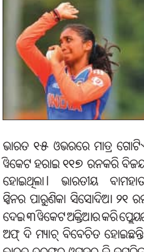
ଭାରତ ୧୫ ଓଭରରେ ମାତ୍ର ଗୋଟିଏ ଟେଷ୍ଟେ ହରାଇ ୧୧୩ ରନକରି ବିଜୟ ହୋଇଥିଲା। ଭାରତୀୟ ବାମହାତୀ ସ୍ଟିନର ପାଣ୍ଡେଶିକା ସିଦ୍ଧାଦିଆ ୨୧ ରନ ଦେଇ ୩ ଟେଷ୍ଟେ ଅକ୍ତିଆର କରି ପୁରୁଷ ଅଧିକାରୀ ମ୍ୟାଚ୍ ବିବେଚିତ ହୋଇଛନ୍ତି। ଭାରତ ଚଳେଇଥିବା ପ୍ରଥମ ଟେଷ୍ଟରେ ଭାରତ ୧୫ ଓଭରରେ ୧୧୩ ରନ କରିଥିଲା। ଦଳ ଚଳେଇଥିବା ପ୍ରଥମ ଟେଷ୍ଟରେ ଭାରତ ୧୫ ଓଭରରେ ୧୧୩ ରନ କରିଥିଲା।

କାଲକଟ୍ଟା, ୩୧ (ଏକେନ୍ଦ୍ର): ଏଠାରେ ଚାଲିଥିବା ୧୯ ବର୍ଷରୁ କର୍ମ ମହିଳା ଟି-୨୦ ବିଶ୍ୱକପ୍‌ରେ ଗତପର ଦିନିଆର ଭାରତ ପାଇନାଲରେ ପ୍ରବେଶ କରିଛି। ଶୁକ୍ରବାର ଅନୁଷ୍ଠିତ ଲୋ ଷ୍ଟୋର୍ଟି ବିତୀୟ ସେମିଫାଇନାଲରେ ଭାରତ ୫ ଓଭର ବାକିଥିଲା ଇଂଲଣ୍ଡକୁ ୯ ଟେଷ୍ଟେ ହରାଇ କ୍ରମାଗତ ବିତୀୟଥର ପାଇନାଲକୁ ଉଠିଛି। ଟାଇଟଲ ପାଇଁ ଭାରତ ରବିବାର ପାଇନାଲରେ ଦକ୍ଷିଣ ଆଫ୍ରିକାକୁ ଭେଟିବ। ଦକ୍ଷିଣ ଆଫ୍ରିକା ପ୍ରଥମ ସେମିଫାଇନାଲରେ ଇଂଲଣ୍ଡକୁ ୨୯ ରନରେ ହରାଇ ୧୧୩ ରନ କରିଥିଲା। ଦଳ ଚଳେଇଥିବା ପ୍ରଥମ ଟେଷ୍ଟରେ ଭାରତ ୧୫ ଓଭରରେ ୧୧୩ ରନ କରିଥିଲା। ଦଳ ଚଳେଇଥିବା ପ୍ରଥମ ଟେଷ୍ଟରେ ଭାରତ ୧୫ ଓଭରରେ ୧୧୩ ରନ କରିଥିଲା। ଦଳ ଚଳେଇଥିବା ପ୍ରଥମ ଟେଷ୍ଟରେ ଭାରତ ୧୫ ଓଭରରେ ୧୧୩ ରନ କରିଥିଲା।