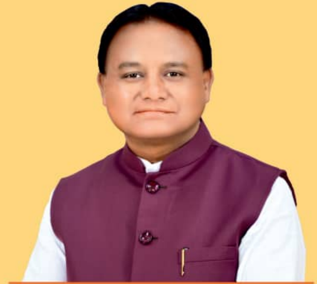
ଶ୍ରୀ ମୋହନ ଚରଣ ମାଝୀ ମୁଖ୍ୟମନ୍ତ୍ରୀ, ଓଡ଼ିଶା