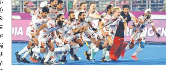
ରାଉରକେଲା, ୩୧ (ଏକେନ୍ଦ୍ର): ଚଳିତ ହକି ଇଣ୍ଡିଆ ଲିଗ୍ (ଏସିଆଇଏଲ) ଷଷ୍ଠ ସଂସ୍କରଣର ପାଇନାଲ ମୁକାବିଲା ଷ୍ଟୁଟ ହୋଇଛି। ଶନିବାର ଟାଇଟଲ ପାଇଁ ଶ୍ରୁତି ବେଙ୍ଗଲ ଟାଇଟର୍ସ ଓ ହାଇଦରାବାଦ ତୁପାନ୍ ପରସ୍ପରକୁ ଭେଟିବେ। ସ୍ଥାନୀୟ ବିର୍ସା ମୁଣ୍ଡା ଷ୍ଟାଡିୟମରେ ଶୁକ୍ରବାର ଅନୁଷ୍ଠିତ କଡ଼ା ସଂଘର୍ଷପୂର୍ଣ୍ଣ ପ୍ରଥମ ସେମିଫାଇନାଲ ସୁନ୍ ଆଉଟ୍‌ରେ ୬-୫ ଗୋଲରେ ଡାମିଲନାଡୁ ଡ୍ରାଗନ୍‌ସ୍‌ ହରାଇଥିଲା। ସେହିପରି ଏକପାଖିଆ ବିତୀୟ ସେମିଫାଇନାଲରେ ତୁପାନ୍ ୩-୧ ଗୋଲରେ