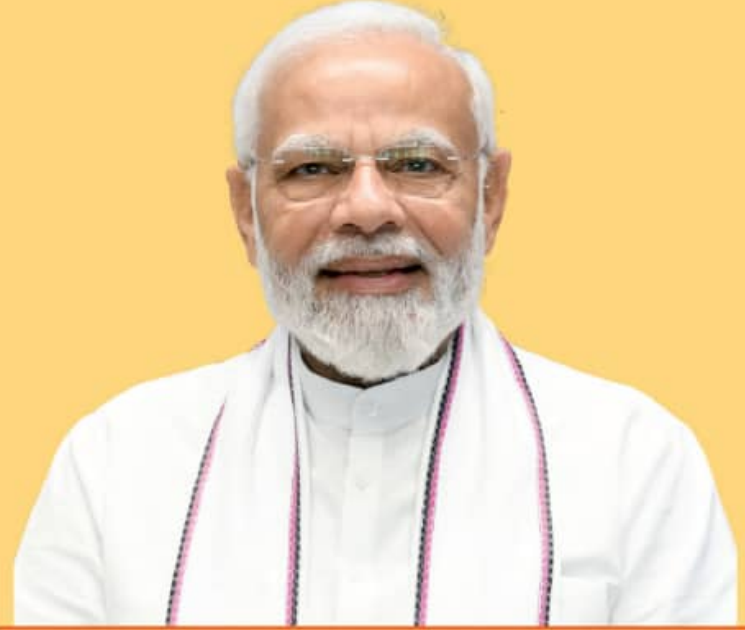
ଶ୍ରୀ ନରେନ୍ଦ୍ର ମୋଦୀ ପ୍ରଧାନମନ୍ତ୍ରୀ