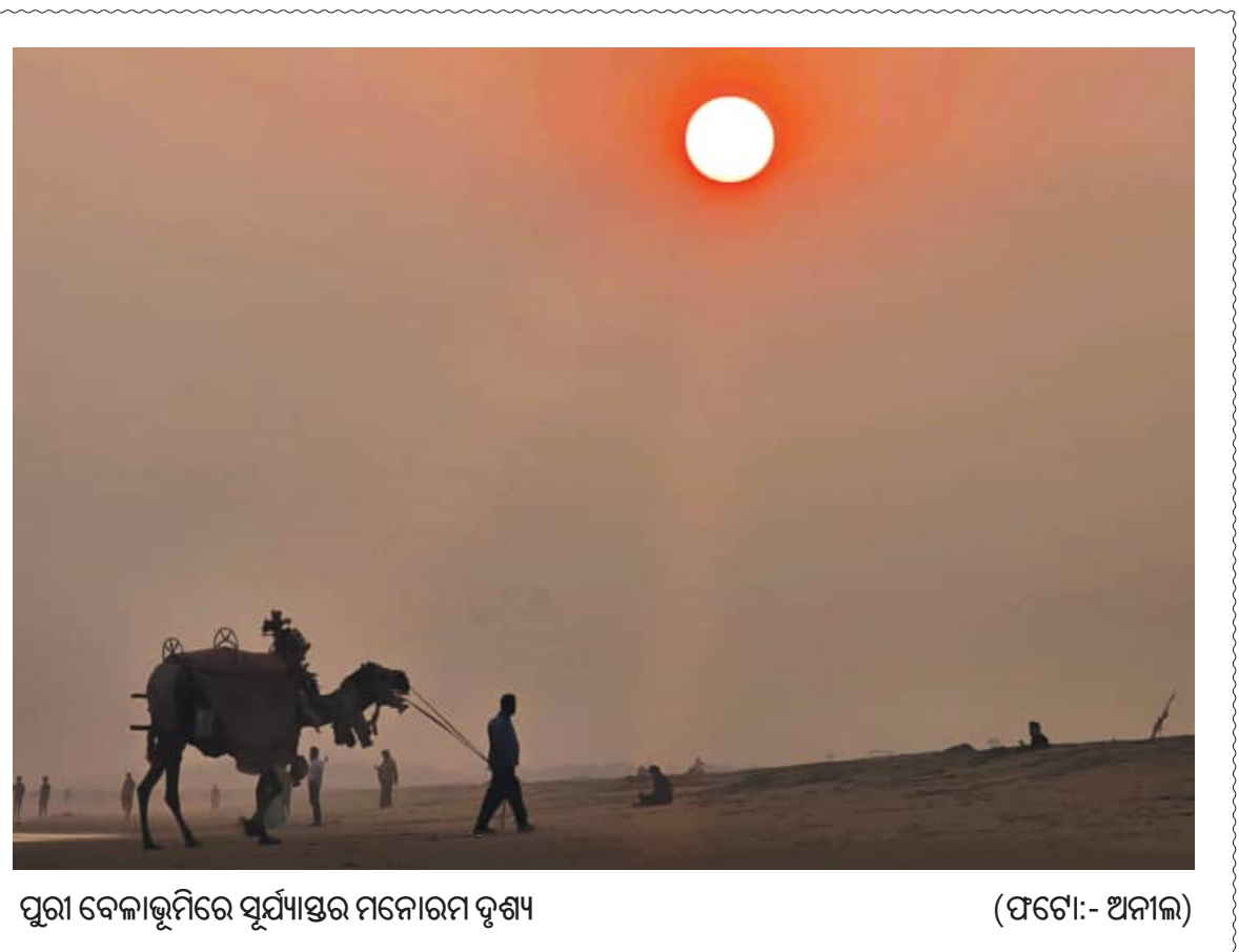
ପୁରୀ ବେଳାକୁମ୍ଭରେ ସୂର୍ଯ୍ୟାସ୍ତର ମନୋରମ ଦୃଶ୍ୟ

ଚେଷ୍ଟା କରିଚାଲିଛନ୍ତି । ବିଗତ ଦିନରେ ତାଙ୍କ ଫର୍ଦ ନାମରେ ବିଭିନ୍ନ ପ୍ରକାର କାରକପତ୍ର ଓ ଲେଟର ମ୍ୟାଡ୍କୁ ନକଲ କରି ସେମାନଙ୍କର ଫାଇଦା ହାସଲ ପାଇଁ ଚିତ୍ତେ ମଧ୍ୟ କୁଣ୍ଠାବୋଧ କରୁନାହାନ୍ତି । କିନ୍ତୁ ଫର୍ଦ ପ୍ରତିଷ୍ଠାର ମୂଳମନ୍ତ୍ର ଏହା ଥିଲା କି ପାରାଦୀପ ବନ୍ଦରରେ କାର୍ଯ୍ୟରତ ୧୦୦୦ ରୁ ଅଧିକ ଡିଏଲଆର