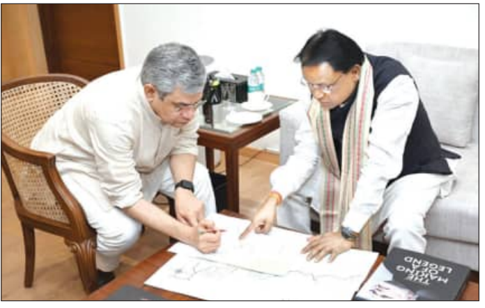
ଓଡ଼ିଶାରେ ରେଳ ଭିତ୍ତିଭୂମି ବିକାଶ ସମ୍ପର୍କରେ ରେଳ ମନ୍ତ୍ରୀ ଅଶ୍ୱିନୀ ଦେବିଙ୍କୁ ସହ ମୁଖ୍ୟମନ୍ତ୍ରୀ ମୋହନ ଚରଣ ମାଝି ଆଲୋଚନା କରୁଛନ୍ତି ।