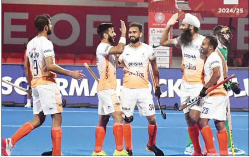
ଭୁବନେଶ୍ୱର, ୨୧/୨ (ସମିପ):

କଳିଙ୍ଗ ଏସଆଇଏର୍ ପୁରୁଷ ପ୍ରୋ ଲିଗ୍ରେ ଘରୋଇ ଭାରତୀୟ ହକି ଦଳ କଳିଙ୍ଗ