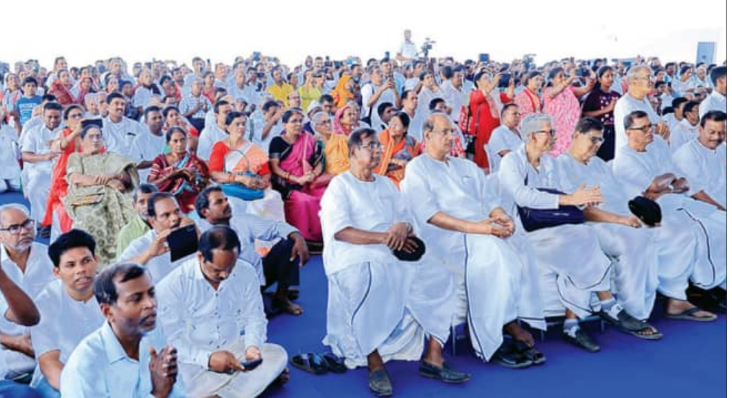
ଜନତା ମଇଦାନରେ ପରମ ପ୍ରେମମୟ ଶ୍ରୀଗ୍ରାମୀ ଠାକୁର ଅନୁକୂଳଚନ୍ଦ୍ରଙ୍କ ୧୩୭ତମ ଜନ୍ମ ମହୋତ୍ସବ