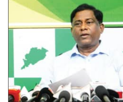
ହରିକ୍ଷଣ ଯୋଜନାର ସହାୟତା ଅର୍ଥ ରାଶି ମଧ୍ୟ ମିଳିପାରିଲା ନାହିଁ। ରାଜଧାନୀରୁ ବନ୍ଧୁ ତୁରନ୍ତରେ ଥିବା କଶାସ ବୁକ୍‌ରେ ମାସେରୁ ଅଧିକ ସମୟ ଧରି ଚଳି ପଞ୍ଚାୟତରେ ଝାଡ଼ାବାଜ୍ଞି ବ୍ୟାପିଥିବା ବେଳେ ଏପର୍ଯ୍ୟନ୍ତ ଏ ବାବଦରେ ମୁଖ୍ୟମନ୍ତ୍ରୀ