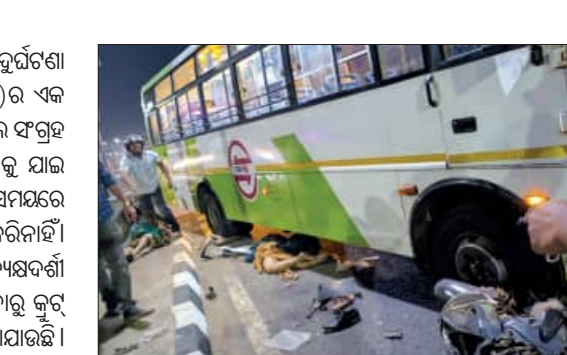
ଦୁର୍ଘଟଣାର କାରଣ ଖୋଜିବ ସତରୁ କମିଟି: କୁଟ୍‌ର

ଭୁବନେଶ୍ୱର, ୧୫୫୨(ସମ୍ବିଧ): ଶୁକ୍ରବାର ରାତିରେ 'ମୋ ବସ୍' ଦୁର୍ଘଟଣା ଘଟଣାସ୍ଥଳରେ କ୍ୟାମିରା ଲାଗି ରହିଥିବା ଅର୍ଦ୍ଧାଂଶ ପ୍ରାୟୁପୋର୍ଟ (କୁଟ୍‌ର) ଏକ ଟେକ୍ନିକାଲ ଟିମ୍ ବସ୍‌ରେ ଲାଗିଥିବା ସିସିଟିଭି କ୍ୟାମିରାର ଭିଙ୍ଗିଆଳି ସଂଗ୍ରହ କରିଛି। ଟେକ୍ନିକାଲ ଟିମ୍‌ର ସଦସ୍ୟ ପୂର୍ବାହୁରେ ତମାଣ୍ଡୋ ଆନାକୁ ଯାଇ ଜବତ ବସ୍‌ରେ ଲାଗିଥିବା ସିସିଟିଭି ହାର୍ଡ ଡ୍ରାଇଭକୁ ଦୁର୍ଘଟଣା ସମୟରେ କ'ଣ ଦୃଶ୍ୟକୁ ସଂଗ୍ରହ କରିଛନ୍ତି। କିନ୍ତୁ ଏହାକୁ କୁଟ୍‌ର ସାର୍ବଜନୀନ କରିନାହିଁ। ଦୁର୍ଘଟଣା ସମୟର ଦୃଶ୍ୟ ଅତ୍ୟନ୍ତ ହୃଦୟଙ୍ଗମକାରୀ ଥିଲା ବୋଲି ପ୍ରତ୍ୟକ୍ଷଦର୍ଶୀ କହୁଥିବାବେଳେ ଏହି ଘଟଣାରେ 'ମୋ ବସ୍' ଚାଳକଙ୍କ ଭୁଲ ଥିବାରୁ କୁଟ୍‌ର ପକ୍ଷରୁ ଏହି ସିସିଟିଭି ପୁଟେଜ୍‌କୁ ସାର୍ବଜନୀନ କରାଯାଇ ନ ଥିବା କୁହାଯାଇଛି। ଯେଉଁଠି ମୋ ବସ୍‌ର ଭୁଲ ନ ଥାଏ, ସେଠି କୁଟ୍‌ର ପକ୍ଷରୁ ଭିଡ଼ି ଓ ଜାରି କରାଯାଇ ଅନ୍ୟ ଉପରେ ଦୋଷ ଠେଲିଦିଆଯାଏ। କିନ୍ତୁ ନିଜ କର୍ମଚାରୀଙ୍କ ଭୁଲକୁ ସାର୍ବଜନୀନ କରିବାରେ କୁଟ୍‌ର ପଛଘୁଞ୍ଚା ଦେଇଛି। ଦୁର୍ଘଟଣା ସମୟରେ ବସ୍‌ର ବେଗ କେତେ ଥିଲା, ଡ୍ରାଇଭର ଜଣକ ମଦ୍ୟପାନ କରି ଗାଡ଼ି ଚଳାଉଥିଲା ନା ନାହିଁ ଏନେଇ କୁଟ୍‌ର କର୍ମଚାରୀଙ୍କୁ ପୁଣି ଖୋଜି ନ ଥିବା ନଜରକୁ ଆସିଛି।