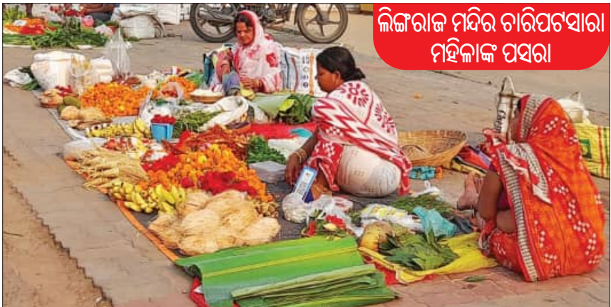
ଲିଙ୍ଗରାଜ ମନ୍ଦିର ଚାରିପଟେ ଯାତ୍ରୀମାନଙ୍କ ପସରା

ଭୁବନେଶ୍ୱର, ୧୫୧୨(ସମ୍ପାଦକ): ମନରେ ସାହସ ଥିଲେ ଯେ କୌଣସି କାମ ବି ସଫଳରେ କରିହୁଏ। ଏଥିପାଇଁ ବୟସର ଆବଶ୍ୟକତା ନ ଥାଏ। ବିଶେଷକରି ପରିବାରର ଚିନ୍ତା ରହିଲେ ସବୁ କାମ ସମ୍ଭବ ହୋଇପାରିବ। ଯାହାକି ସହରର ବିଭିନ୍ନ ସ୍ଥାନରେ ଥିବା ହାଟ, ମାର୍କେଟରେ