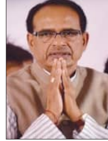
କେନ୍ଦ୍ର ମନ୍ତ୍ରୀଙ୍କୁ ଫଟା ସିଟ୍। ଏୟାର ଇଣ୍ଡିଆରେ କେନ୍ଦ୍ର ମନ୍ତ୍ରୀଙ୍କୁ ଫଟା ସିଟ୍।

ନୂଆଦିଲ୍ଲୀ, ୨୨୧୨ (ଏକେନ୍ଦ୍ର): ରଣବୀର ଆହ୍ଲାବାଦିଆଙ୍କ ମାମଲା ପରେ ସୋସିଆଲ ମିଡ଼ିଆର ବିଷୟ ବହୁ ଏବଂ ଉପଯୁକ୍ତ ତଥ୍ୟକୁ ନେଇ ବିଭିନ୍ନ ମହଲରେ ପ୍ରଶ୍ନ ଉଠିଛି। ଏହାକୁ ଦୃଷ୍ଟିରେ ରଖି କେନ୍ଦ୍ର ସରକାର ଅନଲାଇନ୍ କଣ୍ଠେଣ୍ଡ ଉପରେ ଏକ କଠୋର ନିୟମ ଆଣିବାର ଆବଶ୍ୟକତା ରହିଛି ବୋଲି ପ୍ରକାଶ କରିଛନ୍ତି।