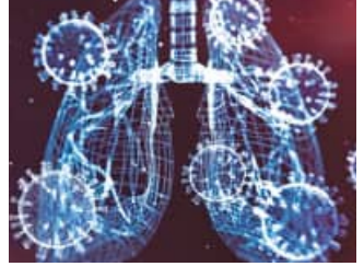
ହସ୍ପିଟାଲରେ ରହି ଚଳିଥିବା କୋଭିଡ୍-୨ ରୋଗୀଙ୍କ ସଂଖ୍ୟା କ୍ରମେ ବୃଦ୍ଧିପାଇଛି। ଚୀନରେ କୋଭିଡ୍-୨ ରୋଗୀଙ୍କ ସଂଖ୍ୟା କ୍ରମେ ବୃଦ୍ଧିପାଇଛି।

କୋଭିଡ୍-୨ ରୋଗୀଙ୍କ ମଧ୍ୟରେ ପ୍ରବେଶ କରେ ଏହାପରେ ଚୀନରେ ପୁଣି ଥରେ ମହାମାରୀ ଆଖ୍ୟା ବଢ଼ିଛି। ଚୀନ ଉତ୍ତର ଉପକଣ୍ଠରେ କୋଭିଡ୍-୨ ରୋଗୀଙ୍କ ସଂଖ୍ୟା କ୍ରମେ ବୃଦ୍ଧିପାଇଛି। ଚୀନରେ କୋଭିଡ୍-୨ ରୋଗୀଙ୍କ ସଂଖ୍ୟା କ୍ରମେ ବୃଦ୍ଧିପାଇଛି। ଚୀନରେ କୋଭିଡ୍-୨ ରୋଗୀଙ୍କ ସଂଖ୍ୟା କ୍ରମେ ବୃଦ୍ଧିପାଇଛି।