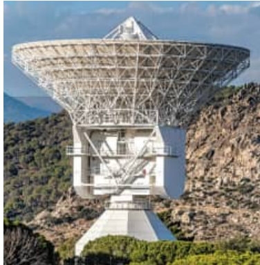
ଭାରତ ଉପରେ ନଜର ରଖିବ ରାଜ୍ୟ ସିଣ୍ଡିକେଟ। ଚୀନ୍ର ଆଉ ଏକ ଚାଲ୍।

ଭାରତ ସହ ସମ୍ପର୍କ ଉନ୍ନତ କରି ଚୀନ୍ ବିଭିନ୍ନ କ୍ଷେତ୍ରରେ କାର୍ଯ୍ୟ କରିବାକୁ ଆଗ୍ରହୀ ବୋଲି କହୁଛି। ଚୀନ୍ ଅନେକ କ୍ଷେତ୍ରରେ ଗୁରୁତ୍ୱପୂର୍ଣ୍ଣ ଭୂମିକା ଗ୍ରହଣ କରିବାକୁ ଚାହୁଁଛି।