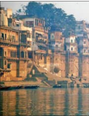
ଶୁବଶାସ୍ତ୍ର ନଦୀଗୁଡ଼ିକର ଜଳସ୍ତର ହ୍ରାସ ପାଇଯିବ। ହିମାଳୟ ଗୁାସିୟରରୁ ବାହାରିଥିବା ଦୁଇ ଧାରା

ଲାଗିଛନ୍ତି। ତେଣୁ ଯୁଏନ୍‌ ଏହି ପଦକ୍ଷେପ ନେଇଛି। ବିଶ୍ୱ ଏତିହ୍ୟ ସ୍ତଳରେ ଲକ୍ଷେ ୮୬ ହଜାର ଗୁାସିୟର ଚିହ୍ନଟ କରାଯାଇଛି। ଏହି ଗୁାସିୟର ୬୬ ହଜାର ବର୍ଗ କିମି ପର୍ଯ୍ୟନ୍ତ ବ୍ୟାପିଛି। ଏହା ମୋଟ ଗୁାସିୟରର ୧୦ ପ୍ରତିଶତ। ହିମାଳୟ ସହିତ ସମଗ୍ର ବିଶ୍ୱରେ ୧୦ ବର୍ଗ କିମି କ୍ଷେତ୍ରରେ ଥିବା ଗୁାସିୟର ଆଗାମୀ ୨୫ ବର୍ଷରେ ଶୁଖିଯିବେ ବୋଲି ଆକଳନ କରାଯାଇଛି। ସେହିପରି ଶହେ ବର୍ଗ କିମି କ୍ଷେତ୍ରରେ ବ୍ୟାପିଥିବା ଗୁାସିୟର ଆଗାମୀ ୬୫ ବର୍ଷରେ ଶୁଖିଯିବେ। ବିଶ୍ୱ ଏତିହ୍ୟ ଗୁାସିୟରଗୁଡ଼ିକ ପ୍ରତି ବର୍ଷ ୫୮ ବିଲିୟନ ଟନ୍ ବରଫ ହରାଇଛନ୍ତି। ଏହା ଦ୍ୱାରା ସମୁଦ୍ର ଜଳସ୍ତର ବର୍ଷକୁ ୪.୫ ପ୍ରତିଶତ ହାରରେ ବଢ଼ି ଚାଲିଛି। ଏପରି କାରି ରହିଲେ ଗଙ୍ଗା, ଯମୁନା, ଘାଘରା, ଗାମଗଙ୍ଗା