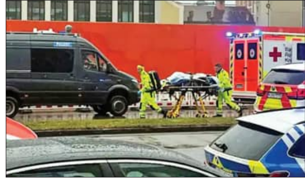
ଧରାଦଳ ଲୋକଙ୍କ ଉପରେ ମିନି କୁପର କାର୍ ତଡ଼ାଇ ଦେଇଥିଲା। ପୁଲିସ୍ ଏହାକୁ ଜବତ କରିଛି। ଜାଣିଶୁଣି ଆକ୍ରମଣ କରାଯାଇଛି ବୋଲି ପୁଲିସ୍ ସନ୍ଦେହ କରୁଛି।

ଲଣ୍ଡନ, ୧୩୨ (ଏକେନ୍ସି): ଜର୍ମାନୀର ଯୁନିଟ୍ ସହରରେ ଜଣେ ଆଫଗାନ ଶରଣାର୍ଥୀ ଲୋକଙ୍କ ଉପରେ କାର୍ ତଡ଼ାଇ ଦେଇଛି। ଏହି ଆକ୍ରମଣରେ ୨୮ ରୁ ଅଧିକ ଲୋକ ଆହତ ହୋଇଛନ୍ତି। ଏମାନଙ୍କ ମଧ୍ୟରୁ କିଛି ଜଣଙ୍କ ସ୍ୱାସ୍ଥ୍ୟାବସ୍ଥା ଗୁରୁତର ରହିଛି। ପୁଲିସ୍ ୨୪ ବର୍ଷୀୟ ଆକ୍ରମଣକାରୀ ଧରାଦଳ ଗିରଫ କରିଛି। ସେ ୨୦୧୨ରେ ଜର୍ମାନୀ ଆସିଥିଲା। ସେ ଇସ୍ଲାମୀ ପ୍ରଦର୍ଶନ ସମୟରେ ଜଣେ ପୁଲିସ୍ ଅଧିକାରୀଙ୍କ ସମେତ ୬ ଜଣଙ୍କ ଉପରେ ଛୁରା ମାଡ଼ କରିଥିଲା। ଏହାକୁ ନେଇ ତା ବିରୋଧରେ ମାମଲା ଚାଲିଛି। ସୁତନା ଅନୁଯାୟୀ ଗୁରୁବାର ସକାଳ ୧୦ଟା ୩୦ (ସ୍ଥାନୀୟ ସମୟ)ରେ ଯୁନିଟ୍‌ର ତାଜନଗର ଅଞ୍ଚଳରେ 'ସର୍ଭିସ୍ ଆର୍ବିଭିଜନ' ପକ୍ଷରୁ ବିସ୍ଫୋଟ ପ୍ରଦର୍ଶନ କରାଯାଇଥିଲା। ଏହି ସମୟରେ