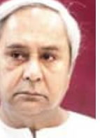
ବିଧାୟକ ଦଳ ବୈଠକରେ ଅନୁପସ୍ଥିତ