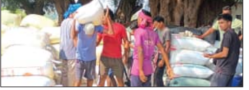
ଖାତିର ନ କରି କଟନାଛଟନା କରିବାକୁ ଚାଷୀ ଧରିପୁସ୍ତ ହୋଇଛନ୍ତି । କଳାହାଣ୍ଡି ଜିଲ୍ଲାରେ ନଭେମ୍ବର ୨୯ ତାରିଖରୁ ଖରିଫ ଧାନ ସଂଗ୍ରହ ପ୍ରକ୍ରିୟା ଆରମ୍ଭ ହୋଇଥିଲେ ହେଁ ବାସ୍ତବରେ ଏହା ବିସ୍ତାପନ ପ୍ରଥମ ସମ୍ପାଦକ କାର୍ଯ୍ୟକାରୀ ହୋଇଛି । ଗତ ୧୧ ତାରିଖରେ ଜିଲ୍ଲାର ସବୁ ମଣ୍ଡି ବନ୍ଦ କରାଯାଇଛି । ଜିଲ୍ଲାରେ ୨୪ଲକ୍ଷ ୬୪ହଜାର ୧୯୧୯କିଣା ଧାନ କ୍ରୟ ଲକ୍ଷ୍ୟ ଥିଲେ ବି ୪ ଲକ୍ଷ କିଣା କମ୍ ଅର୍ଥାତ୍ ୬୦ଲକ୍ଷ

ଭବାନୀପାଟଣା, ୧୩/୨ (ସମ୍ପାଦକ): କଳାହାଣ୍ଡି ଜିଲ୍ଲାରେ ଚଳିତ ଖରିଫ ଧାନ ସଂଗ୍ରହ କାର୍ଯ୍ୟ ସରିଛି । ଏଥର ଚାଷୀଙ୍କୁ ସରକାର ୮୦୦ ଟଙ୍କା ଇନ୍-ପୁର୍ଟ୍ ସବ-ସିଡି ଦେବାକୁ ଘୋଷଣା ହେବାରୁ ଧାନ ପୁରଣ ହୋଇ ପାରି ନାହିଁ । କଟନାଛଟନା ହେବନି ବୋଲି ସରକାରଙ୍କ ଘୋଷଣା ପ୍ରଚାରଣରେ ଚାଷୀମାନେ ସରକାରଙ୍କ ନିର୍ଦ୍ଦେଶକୁ