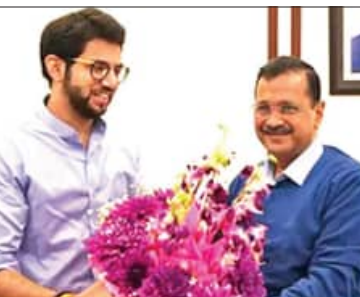
ଆଦିତ୍ୟ କହିବା ସହିତ ନିର୍ବାଚନରେ ଅନିର୍ଣ୍ଣିତତା କରି ଦଳ ସବୁ ସ୍ଥାନରେ କ୍ଷମତାସାଧନ ହେବାକୁ ଚାହୁଁଛି ବୋଲି କହିଛନ୍ତି। ଦିଲ୍ଲୀ ନିର୍ବାଚନରେ

ନୂଆଦିଲ୍ଲୀ, ୧୩୧୨ (ଏକେନ୍ଦ୍ର): ଶିବସେନା(ୟୁବିଟି) ନେତା ଆଦିତ୍ୟ ଠାକରେ ଗତକାଲି କଂଗ୍ରେସ ନେତା ରାହୁଲ ଗାନ୍ଧୀଙ୍କୁ ଭେଟିବା ପରେ ଗୁରୁବାର ଆମ ଆଦମ୍ବା ପାର୍ଟି ମୁଖ୍ୟ ଅରବିନ୍ଦ କେନ୍ଦ୍ରୀୟ ଲୋକଙ୍କୁ ଭେଟି ବିଭିନ୍ନ ପ୍ରସଙ୍ଗରେ ଆଲୋଚନା କରିଛନ୍ତି। ଦଳ କ୍ଷମତାରେ ଥାଇ କି ନ ଥାଇ ଲକ୍ଷ୍ମୀ ମେଣ୍ଟର ସହଯୋଗୀ ଦଳ ଭାବେ କେନ୍ଦ୍ରୀୟ ଲୋକଙ୍କ ସହ ଠାକରେ ସାକ୍ଷାତକାର ଯୋଜନାମୂଳକ ଥିଲା ବୋଲି ସେ କହିଛନ୍ତି। ତେବେ ଏହି ସମୟରେ ଆଞ୍ଚଳିକ ଦଳଗୁଡ଼ିକୁ ପ୍ରତି ବିଜେପିର ଆକ୍ରମଣକୁ ନେଇ ସେ ବଡ଼ ପ୍ରଶ୍ନ ଉଠାଇଛନ୍ତି। ବିଜେପି ଦେଶରୁ ସବୁ ଆଞ୍ଚଳିକ ଦଳକୁ ଶେଷ କରି ଦେବାକୁ ବସିଛି ବୋଲି