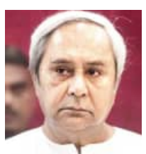
ବିଧାନସଭା ଦଳ ବୈଠକରେ ଅନୁପସ୍ଥିତ