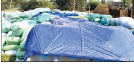
ହଜାର ଗଣ୍ୟା ଜଣ ଚାଷୀ ୧୪୧୧୦୦୯.୮୬ କୁଣ୍ଡା ଧାନ ବିକି କରିଛନ୍ତି । କିନ୍ତୁ ବ୍ୟାପକ ଅବ୍ୟବସ୍ଥା ଏବଂ ବେପାରୀ ଓ ମିଳରଙ୍କ ଲାଭଖୋର ମନୋବୃତ୍ତି ଯୋଗୁଁ ଧାନକିଣାରେ କେନ୍ଦ୍ରାପଡ଼ା ବହୁ ପକ୍ଷରେ ପଡିଛି । ଅପରପକ୍ଷେ, କେନ୍ଦ୍ରାପଡ଼ାରେ ଧାନକିଣାରେ ବ୍ୟାପକ

କେନ୍ଦ୍ରାପଡ଼ା, ୧୩/୨ (ସମ୍ପାଦକ): ଧାନକିଣାକୁ ନେଇ ରାଜ୍ୟବ୍ୟାପୀ ଗୋଟିଏ ପରେ ଗୋଟିଏ ଅବ୍ୟବସ୍ଥା ସାମ୍ନାକୁ ଆସୁଥିବା ବେଳେ କେନ୍ଦ୍ରାପଡ଼ା ଜିଲ୍ଲାରେ ଏହା ସବୁ ସାମାନ୍ୟ ସରକାର ପାର୍ କରୁନାହାନ୍ତି । ଚାଷୀଙ୍କ ଟୋକନରେ ବେପାରୀ ଧାନ କିଣି ମାଲିକାନା ହେବା, ପ୍ରକୃତ ଚାଷୀ ଏହାଧିକାରୀ ବଳି ପଡିବା, ମିଳର ଓ ପ୍ରଶାସନିକ ଅଧିକାରୀଙ୍କ ମଧ୍ୟରେ ମଧୁରତ୍ରୟ, ବ୍ୟାପକ କଟନା-ଛଟନା ଭଳି ଯାବତୀୟ କେଳେକାରୋ-ଦୁର୍ନୀତି-ଅବ୍ୟବସ୍ଥା ଜିଲ୍ଲାରେ ଦେଖିବାକୁ ମିଳିଛି । ଖାଲି ସେତିକି ନୁହେଁ, ଧାନ ବିକ୍ରି ଅଧିକାରୀ ଧାନ ଚାଷୀଙ୍କୁ ଦେବୁ ମାସ ଧାନ ବେଳେ ଏହାଧିକାରୀ ଅଧିକାରୀ ଧାନ ବିକିପାରିନାହାନ୍ତି । ଅପରପକ୍ଷେ, ସମୟମଧ୍ୟରେ ଧାର୍ଯ୍ୟ ଚାର୍ଜେଟ୍ ପୁରଣ ହେବ କି ନାହିଁ, ସେନେଇ ମଧ୍ୟ ପ୍ରଶ୍ନବାଚୀ ସୃଷ୍ଟି ହେଲାଣି । ସୂଚନାମୁତାୟ, କେନ୍ଦ୍ରାପଡ଼ା ଜିଲ୍ଲାରେ ଚଳିତ ବର୍ଷ ମୋଟ ୪୩ ହଜାର ୪୨୨ ଜଣ ଚାଷୀ ଧାନ ବିକ୍ରି ପାଇଁ ନାଁ ପଞ୍ଜୀକରଣ କରିଛନ୍ତି । ଏଥର ଜିଲ୍ଲାରୁ ୧୧୬ ଯାକ ମାଧ୍ୟମରେ ୮ ଲକ୍ଷ ୫୩ ହଜାର କିଣା ଧାନ କିଣିବାକୁ ସରକାର ଚାର୍ଜେଟ୍ ରଖିଛନ୍ତି । କିନ୍ତୁ ଏହା ମାତ୍ର ୧୪ ହଜାର ୮୨୪ଜଣ ଚାଷୀ ୫ଲକ୍ଷ ୬୪ହଜାର ୫୯୩ କୁଣ୍ଡା ଧାନ ବିକ୍ରି କରିଛନ୍ତି । ଅର୍ଥାତ୍ ପଞ୍ଜୀକୃତ ଚାଷୀଙ୍କ ମଧ୍ୟରୁ