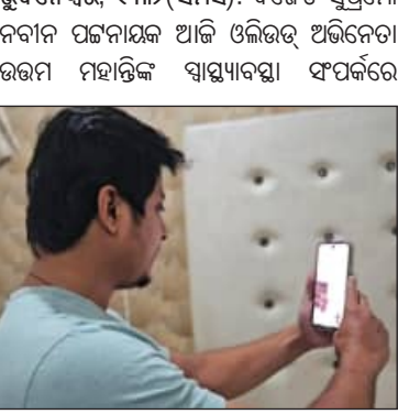
ଭୁବନେଶ୍ୱର, ୧୩/୨ (ସମ୍ପାଦକ): ବିଜେଡି ସୁପ୍ରିମୋ ନବୀନ ପଟ୍ଟନାୟକ ଆଜି ଓଲିଉଡ଼ ଅଭିନେତା ଉତ୍ତମ ମହାନ୍ତିଙ୍କ ସ୍ୱାସ୍ଥ୍ୟାବସ୍ଥା ସଂପର୍କରେ