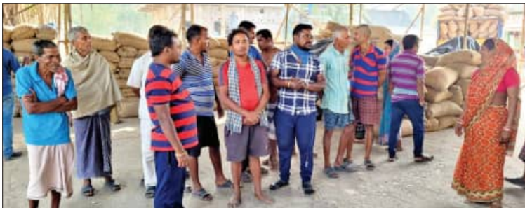
ଧାନ ବସ୍ତା ଓଜନ ପାଇଁ ଦେବାକୁ ପଡ଼ୁଛି ଚାରି ଟଙ୍କା

■ ଭଦ୍ରକ/ବାସୁଦେବପୁର, ୧୮।୧ (ସମ୍ପାଦକ): ଭଦ୍ରକ ଜିଲ୍ଲାର ବିଭିନ୍ନ ମଣ୍ଡିରେ ଧାନବିକ୍ରିକୁ ନେଇ ଅସନ୍ତୋଷ ଦେଖାଦେଇଛି। ମଣ୍ଡିରେ ଧାନ ବସ୍ତା ଓଜନ ପାଇଁ ୪ ଟଙ୍କା ଦେବାକୁ ପଡ଼ୁଥିବା ବେଳେ ସାଡ଼େ ୮ ରୁ ୧୦ ପର୍ଯ୍ୟନ୍ତ କର୍ମଚାରୀ ଛଟନାକୁ ନେଇ ଉତ୍ତେଜନା ପ୍ରକାଶ ପାଇଛି। ଫଳରେ କେଉଁଠି ଚାଷୀ ଧାନ ବିକ୍ରି ବନ୍ଦ କରିଦେଇଥିବା ବେଳେ ଆଉ କେଉଁଠି ସୋସାଇଟି ଧାନ ନ କିଣି ଚାଷୀଙ୍କୁ ହଇରାଣ କରୁଥିବା ଅଭିଯୋଗ ହୋଇଛି।