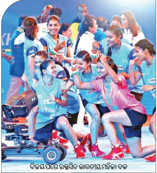
ବିଜୟ ପରେ ଉତ୍ତମବର୍ଗ ଭାରତୀୟ ମହିଳା ଦଳ

ନୂଆଦିଲ୍ଲୀ, ୧୮ (ଏକେନ୍ଦ୍ରି): ସ୍ଥାନୀୟ ଇନ୍ଦିରା ଗାନ୍ଧୀ ଇଣ୍ଡୋର ଷ୍ଟାଡ଼ିୟମରେ ଚାଲିଥିବା ପ୍ରଥମ ଖୋ ଖୋ ବିଶ୍ୱକପ୍ରେ ଆୟୋଜକ ଭାରତକୁ ଶନିବାର ଡବଲ୍ ସପକଟା ମିଳିଛି। ଭାରତର ଉତ୍ତମ ପୁରୁଷ ଓ ମହିଳା ଦଳ ସେମିପାଇନାଲରେ ବିଜୟ ହୋଇ ପାଇନାଲରେ ପ୍ରବେଶ କରିଛନ୍ତି। ସେମିପାଇନାଲରେ ଭାରତୀୟ ପୁରୁଷ ଦଳ ୧୮ ପଏଣ୍ଟ (୧୦-୪୨)ରେ ଦକ୍ଷିଣ ଆଫ୍ରିକାକୁ ପରାସ୍ତ କରିଥିଲା। ସେହିଭଳି ମହିଳା ଦଳ ୫୦ ପଏଣ୍ଟ (୨୬-୧୬)ରେ ସହଜରେ ସମାନ ଦକ୍ଷିଣ ଆଫ୍ରିକାକୁ ହରାଇ ପାଇନାଲରେ ସ୍ଥାନ ପକ୍ଷା କରିଛି। ରବିବାର ପୁରୁଷ ବିଭାଗ ପାଇନାଲରେ ଭାରତର ମୁକାବିଲା ନେପାଳ ସହ ହେବ। ସେହିଭଳି ମହିଳା ବିଭାଗରେ ମଧ୍ୟ ସମାନ ପ୍ରତିଦ୍ୱନ୍ଦ୍ୱୀକୁ ଦେଖିବାକୁ ମିଳିବ। ଭାରତୀୟ ମହିଳା ସହ ନେପାଳ ମହିଳା ଦଳ ଟାଇଟଲ୍ ଲାଗି ଟପ୍ କୁ ଓହ୍ଲାଇବେ। ନେପାଳ ପୁରୁଷ ଦଳ ସେମିରେ ୬୨-୨୦ରେ ଇରାନକୁ ଓ ମହିଳା ଦଳ ୮୯-୧୮ରେ ଉଗାଣ୍ଡାକୁ ହରାଇଥିଲା। ଶନିବାର ଭାରତ ଓ ଦକ୍ଷିଣ ଆଫ୍ରିକା ମଧ୍ୟରେ