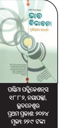
ପଞ୍ଜିନ ପରିକେଶନସ ୧୮୮୨, ନୟାପଲ୍ଲୀ, ଉତ୍ତରକୋଶଳୀ ପ୍ରଥମ ପ୍ରକାଶ: ୨୦୨୪ ମୂଲ୍ୟ: ୨୨୯ ଟଙ୍କା