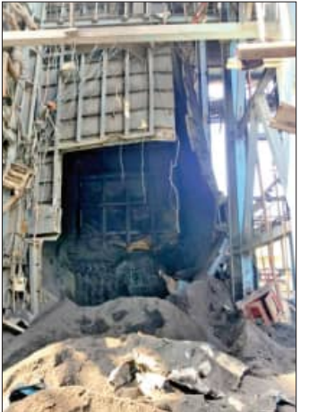
ବ୍ୟଲର ବଙ୍କର୍ ଓ କନଭେୟର ବେଲୁ ସିଲ୍