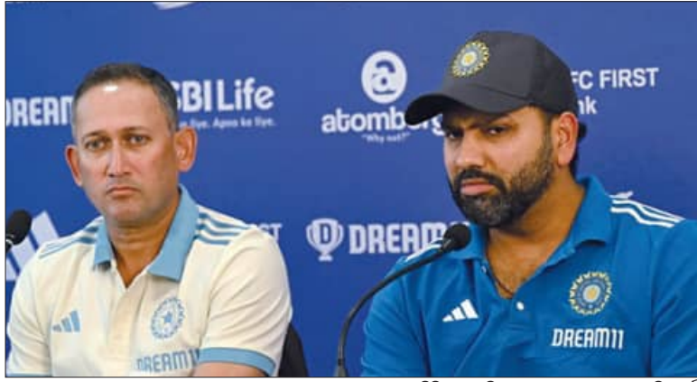
ଦଳ ଘୋଷଣା ଅବସରରେ ଚୟନ କମିଟି ଅଧ୍ୟକ୍ଷ ଅଜିତ ଅଗରକର ଓ ଅଧିନାୟକ ରୋହିତ୍ ଶର୍ମା

ଘୋଷଣା କରାଯାଇଥିବା ୧୫ ଜଣିଆ ଭାରତୀୟ ଦଳରେ ସ୍ଥିନର ଓ ହୁଇ ଖେଳାଳିଙ୍କୁ ଗୁରୁତ୍ୱ ଦିଆଯାଇଛି । ଏହି ଦଳରେ ୪ଜଣ ସ୍ଥିନର ଯଥା ରବୀନ୍ଦ୍ର କାଡେଟକା, ଅକ୍ଷୟ ପଟେଲ, ଖର୍ଚ୍ଚିଟନ ସୁନ୍ଦର ଓ କୁଲଦୀପ ଯାଦବଙ୍କୁ ନିଆଯାଇଛି । ଏମାନଙ୍କ ମଧ୍ୟରୁ ପ୍ରଥମ ୩ଜଣ ବ୍ୟାଟିଂରେ ଦଳ ଲାଗି ବୋନସ୍ ସାବ୍ୟସ୍ତ ହୋଇଆସିଛନ୍ତି । ସେହିପରି ଭବିଷ୍ୟତର ଅଧିନାୟକ ଭାବେ ସ୍ଥିନର ଗିଲ୍‌ଙ୍କୁ ଏହି ଦଳଟି ସିରିଜ୍‌ରୁ ପ୍ରସ୍ତୁତି ଆରମ୍ଭ ହୋଇଯାଇଛି । ସେହିପରି ଅଧିନାୟକ ହୁଇ ଖେଳାଳି ତଥା ଓପନର ଯଶସୀ ଜୟସାଲଙ୍କୁ ମଧ୍ୟ ପ୍ରଥମଥର ଦଳରେ ସାମିଲ କରାଯାଇଛି । ଏହାର