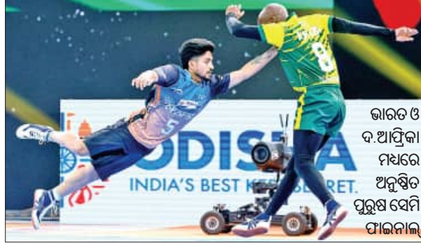
ଭାରତ ଓ ଦ.ଆଫ୍ରିକା ମଧ୍ୟରେ ପୁରୁଷ ସେମି ପାଇନାଲ

ନୂଆଦିଲ୍ଲୀ, ୧୮ (ଏକେନ୍ଦ୍ରି): ସ୍ଥାନୀୟ ଇନ୍ଦିରା ଗାନ୍ଧୀ ଇଣ୍ଡୋର ଷ୍ଟାଡ଼ିୟମରେ ଚାଲିଥିବା ପ୍ରଥମ ଖୋ ଖୋ ବିଶ୍ୱକପ୍ରେ ଆୟୋଜକ ଭାରତକୁ ଶନିବାର ଡବଲ୍ ସପକଟା ମିଳିଛି। ଭାରତର ଉତ୍ତମ ପୁରୁଷ ଓ ମହିଳା ଦଳ ସେମିପାଇନାଲରେ ବିଜୟ ହୋଇ ପାଇନାଲରେ ପ୍ରବେଶ କରିଛନ୍ତି। ସେମିପାଇନାଲରେ ଭାରତୀୟ ପୁରୁଷ ଦଳ ୧୮ ପଏଣ୍ଟ (୧୦-୪୨)ରେ ଦକ୍ଷିଣ ଆଫ୍ରିକାକୁ ପରାସ୍ତ କରିଥିଲା। ସେହିଭଳି ମହିଳା ଦଳ ୫୦ ପଏଣ୍ଟ (୨୬-୧୬)ରେ ସହଜରେ ସମାନ ଦକ୍ଷିଣ ଆଫ୍ରିକାକୁ ହରାଇ ପାଇନାଲରେ ସ୍ଥାନ ପକ୍ଷା କରିଛି। ରବିବାର ପୁରୁଷ ବିଭାଗ ପାଇନାଲରେ ଭାରତର ମୁକାବିଲା ନେପାଳ ସହ ହେବ। ସେହିଭଳି ମହିଳା ବିଭାଗରେ ମଧ୍ୟ ସମାନ ପ୍ରତିଦ୍ୱନ୍ଦ୍ୱୀକୁ ଦେଖିବାକୁ ମିଳିବ। ଭାରତୀୟ ମହିଳା ସହ ନେପାଳ ମହିଳା ଦଳ ଟାଇଟଲ୍ ଲାଗି ଟପ୍ କୁ ଓହ୍ଲାଇବେ। ନେପାଳ ପୁରୁଷ ଦଳ ସେମିରେ ୬୨-୨୦ରେ ଇରାନକୁ ଓ ମହିଳା ଦଳ ୮୯-୧୮ରେ ଉଗାଣ୍ଡାକୁ ହରାଇଥିଲା। ଶନିବାର ଭାରତ ଓ ଦକ୍ଷିଣ ଆଫ୍ରିକା ମଧ୍ୟରେ