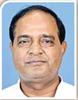
ଆଳୁ ପ୍ରଶ୍ନ ପଚାରିବା ମନା