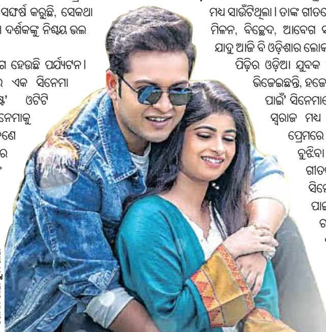
ଖୋକା ଭାଇ ତୁମ ପାଇଁ

ସଂସ୍କୃତିର ଏକ ପ୍ରମୁଖ ଦିଗ ହେଉଛି ପର୍ଯ୍ୟଟନ। ସେହିଭଳି ପର୍ଯ୍ୟଟନକୁ ନେଇ ଏକ ସିନେମା 'ଡାଲଟିନି'। 'ଆଓ ନେଷ୍ଟ' ଓଡ଼ିଶା ପୁରୀଫର୍ମରେ ଏହି ସିନେମାକୁ ଦେଖିପାରିବେ। କାହାଣୀରେ ଜଣେ ଯୁବକ ଭ୍ରମଣ ଉଦ୍ଦେଶ୍ୟରେ ଆସିଛନ୍ତି ଏବଂ ଝିଅ ଗାଳତ୍ସକ ସହ ପ୍ରେମରେ ପଡ଼ିଛନ୍ତି। ଏହାରି ଭିତରେ ଓଡ଼ିଶାର ବିଭିନ୍ନ ପର୍ଯ୍ୟଟନସ୍ଥଳ ଭ୍ରମଣର ଅନୁଭୂତିକୁ ଚିତ୍ରଣ କରାଯାଇଛି। ଏହା କେବଳ ଏକ ସିନେମା ନୁହେଁ, ବରଂ ଓଡ଼ିଶାର ସମୃଦ୍ଧ