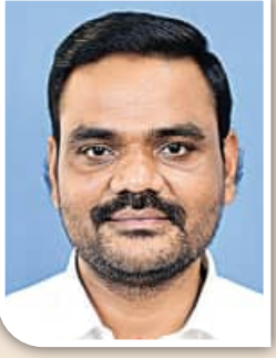
ଶିକ୍ଷା ମନ୍ତ୍ରୀ ଭାରି ବିଜି

ଏ ବର ରାଜ୍ୟ ସରକାରରେ ଯେତେ ମନ୍ତ୍ରୀ ଅଛନ୍ତି; ସେମାନଙ୍କ ମଧ୍ୟରୁ ଦି' ଜଣ ଭାରି ବିଖ୍ୟାତ । ଗାଁ ଗାଁରେ ଲୋକ କଥାରେ ବିଖ୍ୟାତ ମନ୍ତ୍ରୀଙ୍କୁ ଅହରହ ଗାଳି କରୁଛନ୍ତି । ଆଳୁ-ପିଆଜ ଦର ବୃଦ୍ଧିକୁ ନେଇ ତାଙ୍କ ତଉଦ ପୂରୁଷ ଉତ୍ପାଦୁଛନ୍ତି । ମାତ୍ର ପ୍ରଥମଥର ନିର୍ବାଚିତ ହେବା ସତ୍ତ୍ୱେ ଉପମୁଖ୍ୟମନ୍ତ୍ରୀ ପଦ ପ୍ରଭାତୀଙ୍କୁ ଯେତିକି ପରିଚିତି ଦେଇନାହିଁ, ସୁଭଦ୍ରା ଯୋଜନା ତା'ଠୁ ବେଶୀ ବିଖ୍ୟାତ କରିଛି । ଦୀର୍ଘଦିନ ଧରି ପଦ୍ମ ସଙ୍ଗଠନର ମହିଳାଙ୍କ ମୋର୍ଚ୍ଚା ଧରିବାର ଅଭିଜ୍ଞତା ଓ ଅଭିଜ୍ଞ ନେତାଙ୍କ ନିର୍ଦ୍ଦେଶ ଅନୁଯାୟୀ ନିଷ୍ଠା କୁଆଡ଼େ ତାଙ୍କ କାମରେ ପ୍ରତିଫଳିତ ହେଉଥିବା କେହି କେହି କହୁଥିବା ଶୁଣା ଯାଉଛି । ଯଦିଓ ଶୁଦ୍ଧ ଭାଷଣ ମାରିବାରେ ପଦ୍ମ ଦଳିଆଙ୍କଠାରୁ ପାରଙ୍ଗମ ନେତା ଓ ନେତ୍ରୀ ଅନ୍ୟ ଦଳରେ ବିଶେଷ ଦେଖା ଯାଆନ୍ତି ନାହିଁ, ହେଲେ ମାପିତ୍ରୁପି କଥା କହିବାରେ ପ୍ରଭାତୀଙ୍କ ପରି ନେତ୍ରୀଙ୍କ ସଂଖ୍ୟା ତାଙ୍କ ଦଳରେ ଯଥେଷ୍ଟ କମ୍ । ନିକଟରେ ରାଜସ୍ଥାନରେ ଅନୁଷ୍ଠିତ ବିଭିନ୍ନ ରାଜ୍ୟର ମହିଳା ଓ ଶିଶୁବିକାଶ ବିଭାଗ ମନ୍ତ୍ରୀମାନଙ୍କ ସମ୍ମିଳନୀରେ ପ୍ରଭାତୀ ଅଜ୍ଞାନବାଡ଼ିରେ ଅଣ୍ଟା ପ୍ରଦାନ ପ୍ରସଙ୍ଗରେ ଯେଉଁ ପ୍ରସଙ୍ଗ ଉଠାଇଛନ୍ତି, ତାହା ଅନେକଙ୍କୁ ପ୍ରଭାବିତ କରିଛି । ଅଜ୍ଞାନବାଡ଼ି, ମଧ୍ୟାହ୍ନ ଭୋଜନ ଆଦି ପାଇଁ ମୂଲ୍ୟ କେନ୍ଦ୍ର ସରକାର ନିର୍ଦ୍ଧାରଣ କରିଥାଆନ୍ତି । ମାତ୍ର ପରିବର୍ତ୍ତିତ ସମୟରେ ଅଣ୍ଟାପ୍ରଦାନ ପାଇଁ ଯେତିକି ଅର୍ଥ ବରାଦ କରାଯାଉଛି ତାହା ପର୍ଯ୍ୟାପ୍ତ ହେଉ ନ ଥିବାରୁ ସମସ୍ୟା ହେଉଛି । ତେଣୁ ଏହା ଉପରେ ବିଚାର କରାଯିବା ଉପରେ ପ୍ରଭାତୀ ଯେଉଁ ପ୍ରସ୍ତାବ ଦେଇଛନ୍ତି ତାହା ବିଚାରଯୋଗ୍ୟ ବୋଲି ଅନେକ କହୁଛନ୍ତି । ■