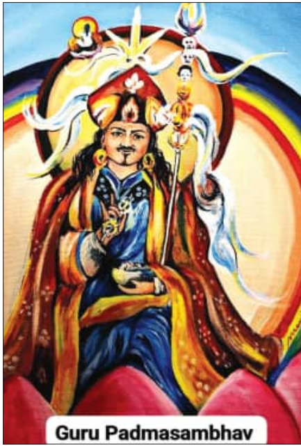
ଦ୍ୱିତୀୟ ବୁଦ୍ଧ କଥା

ଶାନ୍ତରାଜ୍ୟକୁ ପୁନଶ୍ଚ ତିବ୍ୱତ ଫେରାଇ ଆଣି ଲାସା ନିକଟରେ 'ସମୟେ' ମହାବିହାର ଭାରତରେ ଉପସ୍ଥାପନା ମହାବିହାର ଶୈଳୀରେ ନିର୍ମାଣ କରାଇ ସେଠାରେ ମୁଖ୍ୟ ଭାବେ ଅବସ୍ଥାପିତ କରାଇଲେ। ତିବ୍ୱତର ପ୍ରଥମ ବୌଦ୍ଧ ସଂପ୍ରଦାୟ ସେଠାରେ ପ୍ରତିଷ୍ଠା କରାଇଲେ। ତିବ୍ୱତରେ ଥିବା ବେଳେ ହିଁ ପଦ୍ମସମ୍ଭବ ଏହାର ପାର୍ଶ୍ୱବର୍ତ୍ତୀ ଅନାନ୍ୟ ହିମାଳୟ ଅଞ୍ଚଳ ଯଥା ଭୁଟାନ, ସିକିମ୍, ନେପାଳ, ଲଦାଖ, ହିମାଚଳ ପ୍ରଦେଶ, ଅରୁଣାଚଳ ପ୍ରଦେଶ ଆଦି ଅଞ୍ଚଳକୁ ଯାଇ ସେଠାରେ ଲାମାଧର୍ମର ବ୍ୟାପକ ପ୍ରଚାର ପ୍ରସାର ଘଟାଇଥିଲେ। ତିବ୍ୱତରେ ସେ ଥିବା ସମୟରେ ଏକ ନୂତନ ସମ୍ଭାଜନା ଓ ଜାଗରଣ ଘଟିଥିଲା ଏବଂ ସେ ସର୍ବଜନାତ୍ମକ ଧର୍ମଗୁରୁଭାବେ ପ୍ରତିଷ୍ଠା ଲାଭ କଲେ। ଏପରିକି ବୁଦ୍ଧକାଳରୁ ସେ ଅଧିକ ସମ୍ମାନ ଲାଭ କରିଥିଲେ। ତିବ୍ୱତୀୟ ତଥ୍ୟ ମୁତାବକ ସେଠାରୁ ସେ ଖ୍ରୀ ୮୦୨ରେ ଭାରତରେ ନିଜ ସ୍ଥାନ ଉନ୍ନତୀୟନକୁ ଫେରି ଯାଜପୁର ଅଞ୍ଚଳରେ ରହିଗି ଓ ଉପସ୍ଥାପିତ ମହାବିହାରରେ ରହିଲେ ଏବଂ ସେଠାରୁ ନିର୍ଗମିତ ଆସାମ ଦେଇ ଭୁଟାନକୁ ଯାତ୍ରାରେ କରୁଥିଲେ।