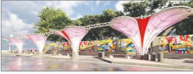
କରିଥାଏ। ଲୋକ ଶାନ୍ତିରେ ଖାଇ ମଧ୍ୟ ତିଆରି ହେବ 'ଖାଉଗଳି' । ଏହାରେ କ୍ଷୁଦ୍ର ପାରକ୍ଷି ନାହିଁ । ଏହି ଅସୁବିଧାକୁ ଦୂର କରିବାକୁ ଏହା ଖୋଲିବେ ।

ଖୁବ ଶୀଘ୍ର ସମ୍ବାଲପୁରରେ ଖୋଲିବ ଖାଉଗଳି। ଖାଉଗଳି ପାଇଁ ଗଠନ କରାଯାଇଛି । ଏହା ଖୋଲିବା ପରେ ସମ୍ବାଲପୁର ମହାନଗର ନିଗମ ଆରମ୍ଭ କରିବେ । ଏହା ପାଇଁ ନିଗମ ସହାୟତା ସହାୟକରେ ଏହା ଖୋଲିବ ।