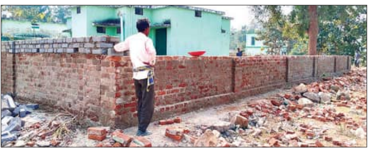
ନୂଆପଡ଼ା, ୧୭।୧।୨୫(ସମ୍ପାଦନା) : ପୁରୁଣା ଇଟାରେ ତିଆରି କରି ଟଙ୍କା ଆମ୍ବସାତ ଉଦ୍ୟମ... ପୁରୁଣା ଇଟାରେ ତିଆରି କରି ଟଙ୍କା ଆମ୍ବସାତ ଉଦ୍ୟମ...