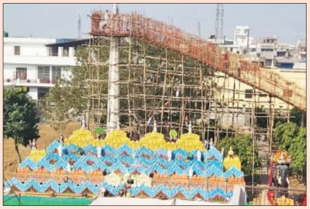
ପାଇଁ । ଆହତମାନଙ୍କ ମଧ୍ୟରେ ପ୍ରାୟ ୧୫ ଜଣ ପୁଲିସ୍ କର୍ମୀ ରହିଥିବା କୁହାଯାଇଛି । ଘଟଣାସ୍ଥଳରେ ଉଦ୍ଧାରକାରୀ ଦଳ ପହଞ୍ଚି ଉଦ୍ଧାର କାର୍ଯ୍ୟ ଜାରି ରଖିଛନ୍ତି ।

ଲକ୍ଷ୍ନୌ, ୨୮ (ଏକେନ୍ଦ୍ର): ଉତ୍ତର ପ୍ରଦେଶର ବାଗପତ ଜିଲ୍ଲାରେ ମଙ୍ଗଳବାର ଏକ ଧାର୍ମିକ କାର୍ଯ୍ୟକ୍ରମରେ ଅଘଟଣ ଘଟିବା ପରେ ୭ ଜଣଙ୍କ ମୃତ୍ୟୁ ହେବା ସହିତ ୪୦ରୁ ଅଧିକ ଲୋକ ଆହତ ହୋଇଛନ୍ତି । ଆହତମାନଙ୍କ ମଧ୍ୟରୁ ୧୫ ଜଣଙ୍କୁ ପ୍ରାଥମିକ ଚିକିତ୍ସା କରିବା ପରେ ଛାଡି ଦିଆଯାଇଥିଲା ବେଳେ ଅନ୍ୟମାନଙ୍କ ଚିକିତ୍ସା ଜାରି ରହିଛି । ମିଳିଥିବା ଖବର ଅନୁସାରେ ବାଗପତ ଜିଲ୍ଲା ବାଗପତ ଟାୱାରରେ ଜୈନ ସଂପ୍ରଦାୟ ପକ୍ଷରୁ ମଙ୍ଗଳବାର ଭଜନୀନ ଆଦିନାଥଙ୍କ ନିର୍ବାଣ ଲଢ଼ୁ ମହୋତ୍ସବ ଆୟୋଜନ କରାଯାଇଥିଲା । ଏହି ଉତ୍ସବରେ ଆଖପାଖ ଅଞ୍ଚଳର ବହୁ ଶ୍ରଦ୍ଧାଳୁ ଯୋଗ ଦେଇଥିଲା ବେଳେ ଏଠାକରେ କାଠରେ ନିର୍ମିତ ଏକ ‘ୱାର୍ ଟାୱାର’ ଭୁଣ୍ଡି ପଡ଼ିଥିଲା । ଏହି ଟାୱାର ଭୁଣ୍ଡି ପଡ଼ିବାରୁ ଦକାତକଟା ସ୍ଥିତି ସୃଷ୍ଟି ହୋଇଥିଲା । ଏହି ଘଟଣାରେ ୭ ଜଣଙ୍କ ମୃତ୍ୟୁ ହେବା ସହିତ ୪୦ରୁ ଅଧିକ ଲୋକ ଆହତ ହୋଇଥିଲେ ବୋଲି ବାଗପତ ଜିଲ୍ଲାପାଳ ସୂଚନା ଦେଇଛନ୍ତି । ଟାୱାର ତଳେ ଚାପି ହୋଇ ଆହତ ହୋଇଥିବା ଲୋକଙ୍କ ମଧ୍ୟରୁ କେତେକଙ୍କ ଅବସ୍ଥା ସାମାନ୍ୟତାରେ ରହିଥିବାରୁ ମୃତ୍ୟୁଫଣ୍ଡା ଆହୁରି ଦର୍ଦ୍ଦପାରେ ବୋଲି ଆଖ୍ୟା ପ୍ରକାଶ