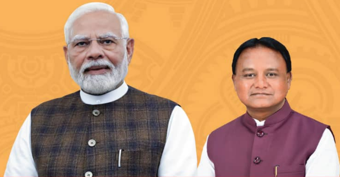
Shri Narendra Modi Prime Minister

Hon'ble Prime Minister, Shri Narendra Modi inaugurates the Utkarsh Odisha – Make in Odisha Conclave 2025 today, we invite industry leaders and entrepreneurs to be a part of this transformational journey.