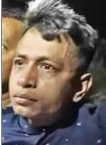
ଆକ୍ରମଣ ପରେ ବସ୍ ଷ୍ଟାଣ୍ଡରେ ଶୋଇଥିଲା ଆମେ ସିଦା ପୂର୍ବରୁ ପୋଷାକ ବଦଳାଇ ଥିଲା ତୋରି କରି ପଦ୍ଧତି ବିଦା ହୋଇଥିଲା